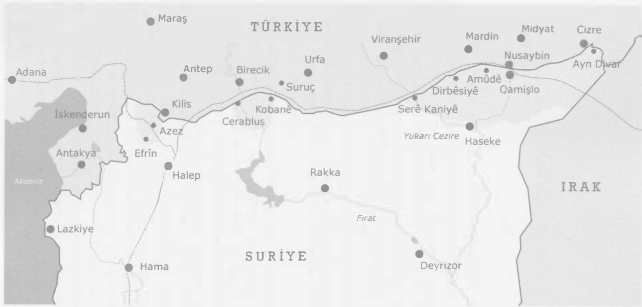
Harita 1: Suriye'nin kuzeyindeki Kürt anklavları