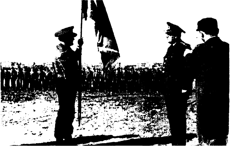
229'uncü Alay sancığının teslimi

İşler o kadar çok zaman alıcı ve bağlayıcı idi ki, Türkiye çok kritik bir dönem geçirmesine rağmen, politik olayları basından bile takip etmeye fırsat