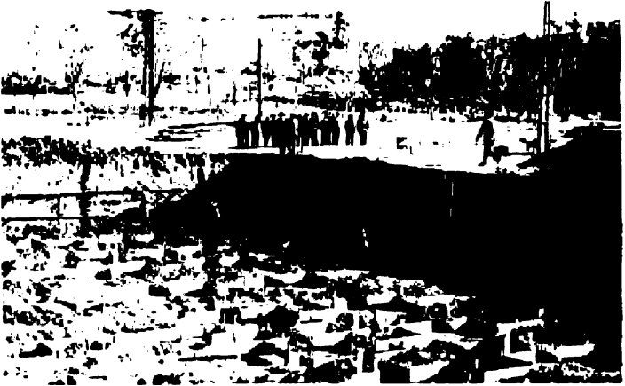
Temel atma töreni

İskân edildiğimiz yer çok yetersizdi. Komutanların direktifi ile yeni bir yerleşim yeri inşaatı kararlaştırıldı.