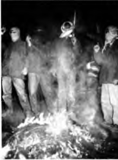
Yukarıda: Bu silahlı genç adamlar PKK'nın Güneydoğu'da sahip olduğu faal sivil yandaşlarından oluşan ve genellikle "milis" olarak bilinen geniş şebekenin üyeleri. Güçlerini genellikle protestolarda ve cenaze törenlerinde gösteriyorlardı. Bu fotoğraf, o yıllarda PKK'nın sağlam bir kalesi olan 1992 yılı Cizre'sinde çekildi.