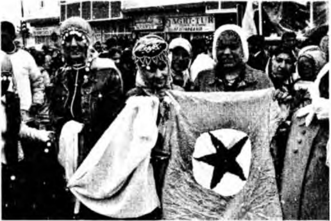
Sağda: Ağrı- Doğubeyazıt merkezinde Kürt yılbaş Newroz'u kutlamak için toplanmış, aralarında PKK bayrağı tutan bir kadının da bulunduğu Kürtler, Mart 2005.