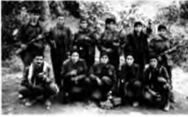
Solda ve aşağıda: Güneydoğu'da faal olan PKK asileri. Bu genç erkek ve kadınlar Cizre dışındaki bir grup küçük köye birkaç saatlik yürüme mesafesinde bulunan bir vadiye bulunuyorlardı. (Fotoğraf, Aliza Marcus, 1993).