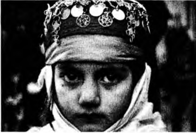
Solda: Kürt yılbaş Newroz'u kutlamak için giyiniş süslenmiş bir Kürt kıızı, Mart 2005.