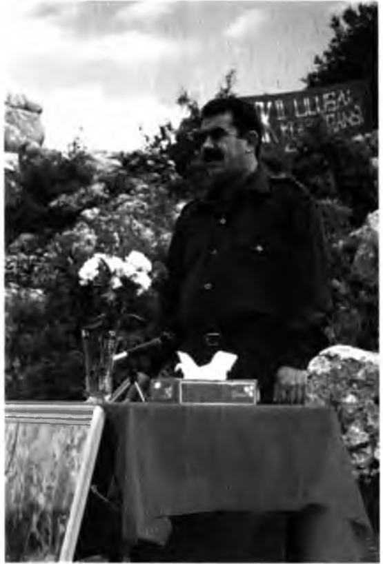
PKK lideri Abdullah Öcalan.