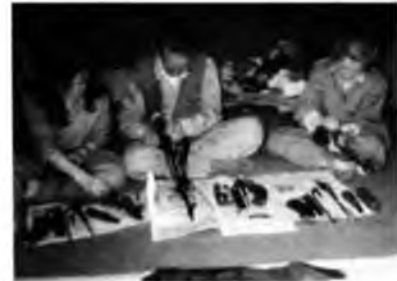
Sağda: PKK'nın 1993'te örgütlediği Kürdistan Meclisi delegeleri, Kuzey Irak'taki Zeli kampında kalaşnikofları temizlemeyi öğreniyor.