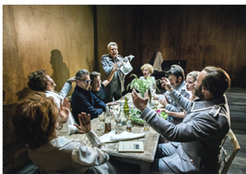
سى خوشک لە شانۆی پادشایەتى لە ستوکھۆلم

ويست و توانا دهخولیتتهوه. (ئەم شارەمان دووسەد سالا دەمەزراوه و سەد ھەزار کەسی تیدا ئەژی، کەچی خەلکەکەى ھەموو ھەک یەکن... نە لە پابردوودا و نە ئیستا یەک تاقە زانا و ھونەرمەندیک و پیاویکی ناسراوی تیدا پەیدا نەبووه کە ھەز بەکەى ھەک ئەو بی و لاسایی بەکەیتەوه! ھەر ئەخۆن و ئەخۆنەوه و ئەنوون و دوایی ئەمرن... ھیی تر لەدایک ئەبن و دیسان ئەخۆن و ئەخۆنەوه و ئەنوون و بۆ ئەوهى لە بیزاریدا ھار نەبن، ژيانیان بە خواردنەوهى قوڭگای قوزەلقورت و قوماڕ و کاری ناڕەوا ئەپازیننەوه. ل ١٦٢)، ئەمەى ئەندریی دەلیت، دەبیټ بە سمبۆلی بیمانایی ژیان، سمبۆلیک لە سمبۆلی شانۆنامەکانی مەتەرلینگ و تەننات (خەونەنمایش) ستریندبیرگ-یش بەھیزتر و ئاشکراتر. سمبۆلەکانی چیخەف لەنیو بی پووداوی و ریتەمە پوژانەییەکەى ژیانى پوژانەدا، ھەرۆک ئەندریی دەلیت، لە دووبارە بوونەوهیەکی بەردەوامدايە و لە مۆتیفەکانی ریالیزمەکەیدا پوڤلیکی تر و بەھایەکی تری لەخۆ گرتووه.