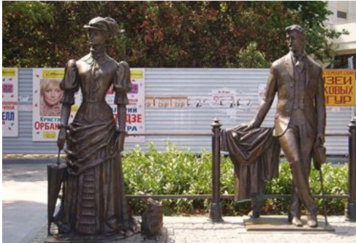
یکەریکی خانم و سەگەکە لە شاری یالتا

سەد سال لە مەو بەر و لە پیکەوتی یازدەمی تەمموزی سالی ۱۹۰۴ دا نووسەری گەورەمی ڕووسی، چێخەف جانتاکەمی دەپینیتەو و بەیانی زوو لە گەل ھاوسەرەکەمی، ھونەر مەندی شانۆیی "ئۆلگا کنیپەر" بەرەو ناوچەمی "شوارزولڈ" لە شاری بادینقییلەری ئەلمانی بەرێ دەکەون. ئەم گەشتەیش دوو گەشتی چێخەف دەبیت و ھەرگیز جاریکی تر ناگەریتەو بوو یالتا و مالهەکی خۆی. <۱>