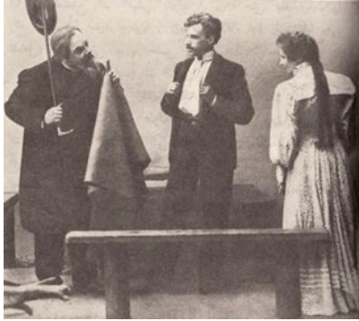
دیمه نیک له نه مایشی نه ورهس له شانوی هونه ری مؤسکو

ئهرکادینای ژنه ئه کتەر، پوژیککی خووشی هاوین له گهل یاره کهی، تریگورینی نووسەر دین بو خانووه هاوینه کهی سورینی برای، کورده کهی (که نستهنن)، که خهونی ئه وهی ههیه، بیته نووسەر، له وی دهژی، ههروهها برا به ته مه نه کهی (سورین) ئه مه جگه له که سانیککی تریش، بو نمونه شه مرانیف و په لینای ژنی و ماشای کچی، دورنی پزیشک، نینا، که کیژیککی گهنجه، مدقیدینکای ماموستا، که یه کیکه له کاره کتەر کومیدیه کانی چیخهف. له په ردهی یه که مدا، نمایشیککی ئه ماتورئاسای هه رزه کارانه، له م که ناری دهریایه، له شیوهی شانوی هاوینه دا پیشکesh ده کریت، که به پشیوی و ئازاوه کوتایی دیت. له په ردهی دووه مدا که نستهنن له ئه نجامی خو شه ویستییه کی بیئا کامه وه هه ولی خو کوشتن دهاد. له په ردهی سییه مدا، ئه رکادینا و تریگورین خویان ئاماده ده کهن بو ئه وهی بگه رینه وه بو مؤسکو، تریگورین دهیه ویست بمینتته وه، ئه رکادینا ناچاری دهکات، له کاتیکدا ئه و له پشتی