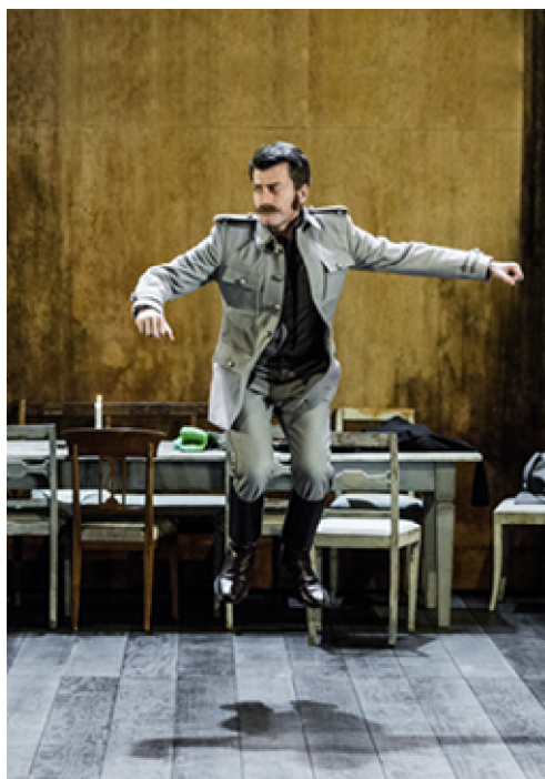
سى خوشک له شانۆی پادشایه‌تی له ستۆکهۆلم

جوانانه وه مه‌بینه، که دواى دووسه‌د سالل یان سیسه‌د سالی تر روو دده‌دن. مروّف له هه‌موو سه‌رده‌میکدا پیویستی به یوتوبیای خوئی هه‌یه، به‌لام یوتوبیا ده‌بیت هه‌لقولای راستیی واقیعی ژیان بیت. مروّف پیویسته له‌و شوینه کار بکات، یان هه‌لومه‌رجه‌کانی خوئی بگوریت. گه‌شینی سى خوشکه‌که، کاریکی ئاسان و سه‌رکه‌وتنیکی پر له چه‌پله‌ریزان نییه، به‌لام خوشکه‌کان یه‌که‌م هه‌نگاویان له‌و پرۆسه‌یه‌دا ناوه، که له باخی گیل‌اس‌دا روون و ئاشکراتر دهرده‌که‌ویت.