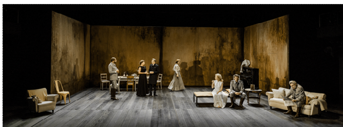
سى خوشك له شانۆى پادشايه‌تى له ستوكهۆلم

ستراكتورى رووداوهكان، له بوشاييهكى گهورهدا گهشه دهكات، كارهكتهره پياوهكان هيدى هيدى دور دهكهونهوه و ئافرهتهكان دهमितنهوه. ديالوگهكان، ههروهك ئهوهى به ريكهوت بگوترين، له دوبارهكردنهوهكاندا بزر دهبن، ههنديك جار ئهوهى دهيلين شتيكى ئهوه تو نيه، بهلام له كوتاييدا دهبنه پهيقى چاره‌نووسسازى گرنهگ. ئهوه بوشاييهى له دهقه‌دا ههيه، له خودى بيدهنگى و پشووهكاندا گهوره دهبن: ژماره‌ى پشووهكان له‌م دهقه‌دا، له هه‌موو دهقه‌كانى ترى چيخه‌ف زياتره و له په‌رده‌يه‌كه‌وه بو په‌رده‌يه‌كى تر، به به‌رده‌وامى زور دهبن.