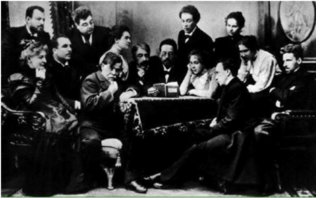
چىخەف و ئەندامانى شانتوى ھونەرى مۇسكو