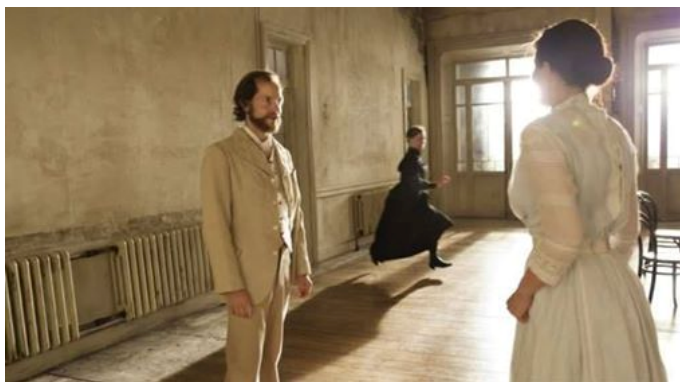
دیمەنیک لە نەمایىشى نەورەس