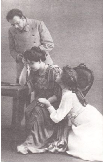
سى خوشك له شانوى هونەرى مۇسكو

ئەمە ئاستى ترۇپكى ئەو خۇشەويستىيە، كە فېرشىنېن و ماشا بۇ يەكتىرى دەردەبېن، ماشا وەلامى فېرشىنېن دەداتەو؛ پەخنەگرەكان ئەم دېمەنە بە يەكېك لە دېمەنە بەرزەكانى ئەدەبى جىھانى ھەژمار دەكەن. ئەمە پىرسىيار و وەلامە، دووپىاتكردەنەوہى ئەو عەشقىيە، كە لەنيوانىاندایە. دوای ئەوہ (فیدوتىك) بە سەماوہ دیتە ژوورەوہ و