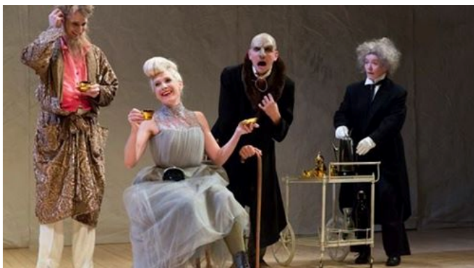
باخی گیلاس له سه‌ر شانۆی گهل