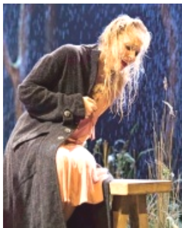
دیمەنیک لە نەورەس لەسەر شانۆی نەتەوایەتی لە لەندن

که نستەنتین وەکو خەونیک بێر لە دەقەکە دەکاتەو، پاشەپوژی زۆر دووری دونیایەکی مردووی وینا کردووە، که لە مەنەلۆژیکی درێژدا، نینا بەرجهستە دەکات، هاوکات وەک سـمـبـۆـلـیـزـمـەـکان، بەکارهێنانی کاریگەرییە شانۆییەکان، ڕەنگ و بۆن: دەرکەوتنی دوو خالی