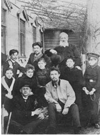
چىخەف لە گەل خانەوادەكەيدا