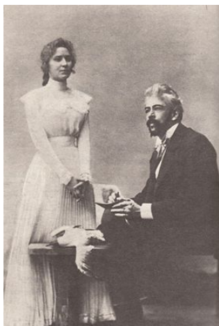
نهورهس له شانوي هونهري موسكو

به م شيوهيه شانوانامه (نهورهس) شهري نهوهكان، كون و نوي، مروقه بههرمه و بينههرهكان دهخاته روو. له شهردا كه نستهنتين بههونهرهكهيهوه نوينهري نهويهكي نوييه و دژي چينه ناودار و هونهرمهنده تهقليدييهكانه، دژي فورمه كون و چهقبهستوههكانه و دژي نه هونهرهيه، كه لهسه ربنه ما