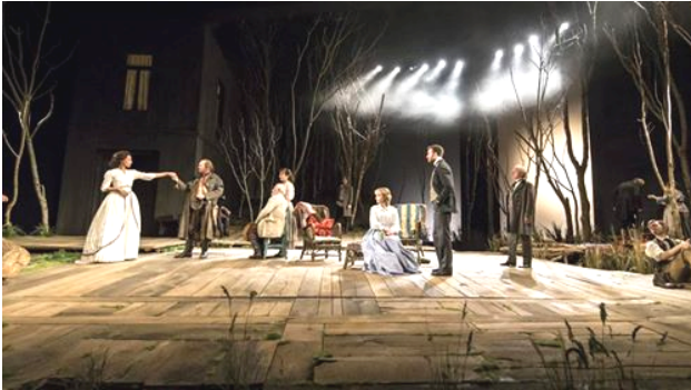
پلاتونوف لە شانۆي نەتەوايەتەى لەندن

پلاتونوف، يەكەم تەقەلا شانۆيەكانى چيخەف-ە و چيخەف لە تەمەنى حەقدە يان ھەژدە سالاندا، كە قوتايى ناوھندى بوو لە شارى تاگانروگ، نووسيويتە. سەرھتا ئاماژە بۆ سالى ۱۸۸۱ كراو، كە ئەم دەقەى تيا نووسرا بيت، چيخەف لەم سالەدا رەشئوسەكەى ناردوو بۆ خانمە ئەكتەرى بەناوبانگى ئەو كاتەى پووسيا (ماريا يارمەلۇفا) لە شانۆي مالى، لە مۆسكۆ، بەلام دەقەكەى بەبى ھيچ بارى سەرنج و ھەلسەنگاندىكەو بۆ دەگيرنەو. دواتر پسيپورانى بواری چيخەف گەيشتوونەتە ئەو برۆايەى، كە ئەم دەقە لەنيوان سالانى ۱۸۷۷-۱۸۷۸دا، دواى ئەوھى خانەوادەكەى دەگويزنەو بۆ مۆسكۆ و ئەو بە تەنھا لە تاگانروگ ماووتەو، نووسراو. ئەوھى زياتریش ئەم بۆچوونە پشتراست دەكاتەو، نامەيەكى برا گەرەكەى چيخەف (ئەليكساندەر)، كە لە مانگى دەى سالى ۱۸۷۸دا، لە مۆسكۆو بۆ چيخەفى ناردوو و باسى دەقيك بە ناونيشانى (نەوھيەكى بيتاوك) يان (ھەتيمچەكان) ھو