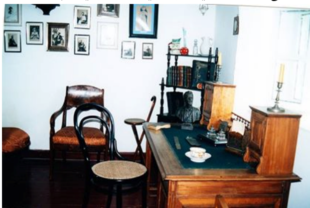
سه‌رمیژه‌که‌ی چینه‌ف له‌هاوینه‌هه‌واری گورزۆف

سه‌رده‌مه‌دا و ئیستایش هر به "خانوه‌سپییه‌که" به‌ناوبانگه و له‌سه‌رده‌می دروستکردنیدا زۆر جیاواز و مؤدیرن بووه.