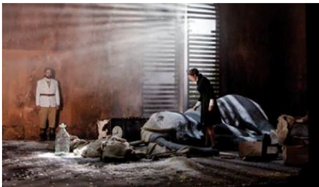
دیمه‌نی کوتایی له نه‌مایشیکی باخی گیللاس