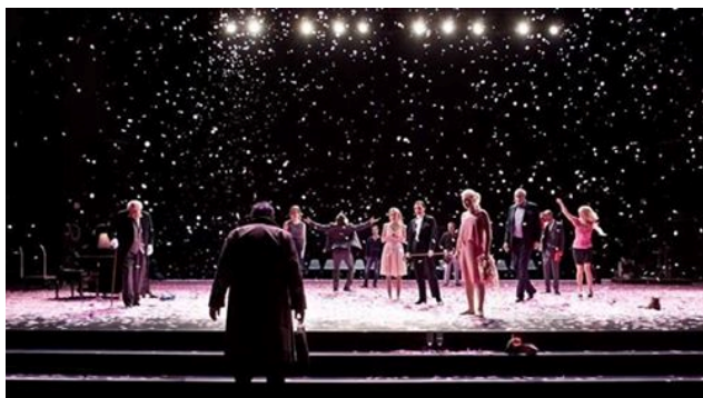
باخی گیلاس له سهر شانۆی شار

فلادیمیر نیمیرۆفیچ-یش له نامهیه کیدا، بو چیخهف دهنووسیت، که دهقه که چهندان کاره کتیری گریاوی تیدایه. چیخهف له وهلامدا دهلیت، ئه وه گریان نییه، به لکو تۆن و سیمایان پر له ژبانه و دلخۆشن، هه رچهنده فرمیسک له چاوه کانیان قه تیس بووه، به لام ئه مه نابیت هیچ ههستیکی به زهیی لای بینهران دروست بکات. ئولگا کنیپه ر له نامهیه کدا باسی کاردانه وهی ستانیسلافسکی و ئه ندامانی شانۆی هونه ر، سه باره ت به باخی گیلاس دهکات و دهلیت: (/.../ئه مرق له شانۆ "باخی گیلاس" دهخویندنه وه، من بریارم داوه نه چم بو ئه وئ. له هه مان کاتیشدا دهمه ویت بچم؛ تا ئیستا من نازانم چی بکه م. که نهسته نتین سیرگنیه فیچ (ستانیسلافسکی) شهیدای دهقه که بووه. ئه و په رده ی یه که می وه ک کۆمیدیا یه ک خویندۆته وه، وه ک خۆیشی دهلیت په رده ی دووم کاریکی به هیزی تیکردووه، له په رده ی سییه مدا ئاره قیکی زوری درداوه، به درییابی په رده ی چواره میش بیوچان گریاوه. ئه و دهلیت تو هه رگیز کاریکی وا به هیز و کاریگه رت نه نووسیوه.