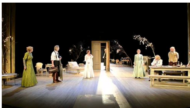
دېمەنىك لە خالە قانیا

دىالۆگەكانى دوكتور ئەستروۋف لە پەردەى دووھەمدا، بەتايبەتى لەگەل سۇنيادا، ھەمان ئەستروۋفى سەرەتاي پەردەى يەكەمە؛ خاۋەن ستايل، ھەندىك غەمگىن، بەدېقەت. دوكتور ئەستروۋف لىرەدا دەگەپتەۋە بۇ ھەمان ئەو باسانەى، كە لەۋەوبەر لەگەل مارىنادا باسى دەكرد، ئەو بەرەست و ئاستەنگە رۇھىيەى ھەستى پى دەكات، ئەو تەنبايىيەى تىاي دەژى، كارىكى بەردەوام (من وەك خالتان، لە ژيانى خۆم پازى نىم، بۇيە ھەردووكىشمان ھەردەم بۆلەمان دىت. ل ۵۵)، ھەر لەم دىالۆگە درىژەيشدا بە سۇنيا دەلېت (خەلكىشم خۆش ناۋى... زۇر دەمىكە كەسىكم خۆش نەويستوۋە. ل ۵۶). تەنھا