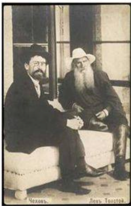
چیخه ف له دیده نی تولستویدا

خستوونیه ته ږوو، له م ږووه وه ده لیت: (بو که سیکی کیمیاگر شتی پیس له سهر زه ویدا نییه، نو سهریش له سهریه تی وهک کیمیاگر بابه تی بیت، خوئی له زاتییه تی ئاسایی ږزگار بکات. ئه وهیش بزانیته، که پیسی و پاشه ږو له سهر زه ویدا ږولی بهرچاوی هه یه. ده بیت ئه وهیش بزانیته، که له ژاندا وهک چوڼ شه یدابوونی باش هه یه، شه یدابوونی خرابیش هه یه).