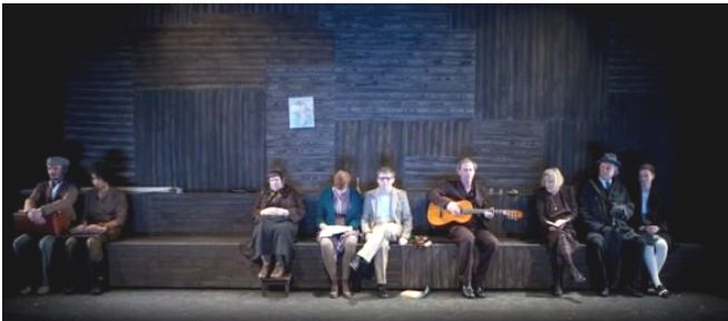
دیمه نیک له خاله فانی