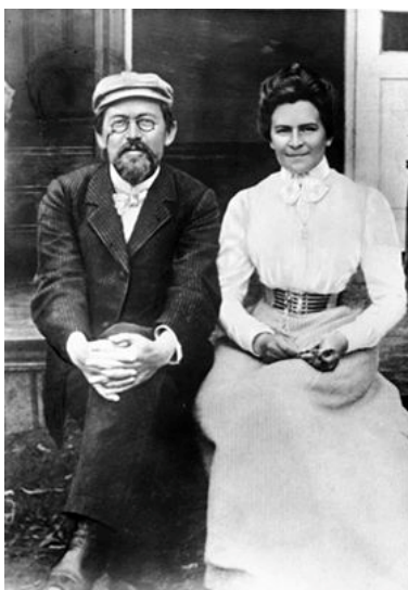
چیخه‌ف و ئۆلگا کنیپه‌ر

چوارده‌وری ئه‌و باخچه گه‌وره‌یه‌دا پینک هیناوه. داره‌کان وه‌ک چه‌تریکی گه‌وره‌سییه‌ریکی فینکیان به‌سه‌ر پانتایی و پووبه‌ری باخچه‌که‌دا دروست کردووه. لیره و له‌وی له سووچ و ژیر سیبه‌ری داره‌کاندا، کورسییه ته‌خته‌کانی چیخه‌ف تا ئیستا وه‌ک خۆیان ماونه‌ته‌وه، له‌یه‌کیک له سووچه‌کاندا، یه‌کیک له کورسییه ته‌خته‌کانی چیخه‌ف که به‌رده‌وام له‌سه‌ری دانیشتووه، وه‌ک خۆی ماوه. له‌سه‌ر ئه‌م کورسییه ده‌ستی له‌ناو ده‌ستی ئۆلگا کنیپه‌ردا بووه، هه‌ر له‌سه‌ر ئه‌م کورسییه‌یش له‌گه‌ل مه‌کسیم گۆرکی هاورپی دانیشتووه و گفتوگۆیان له‌باره‌ی ئه‌ده‌ب و ژیانه‌وه کردووه. چیخه‌ف له‌زۆر نامه‌یدا باسی باخچه‌که‌ی ده‌کات و له‌یه‌کیک له‌و نامه‌نه‌دا ئاماژه‌ی بۆ ئه‌وه کردووه، که هینده سه‌رقالی باخچه‌که‌یه‌تی، خه‌ریکه له‌بری نووسه‌ر، ده‌بیته باخه‌وان.