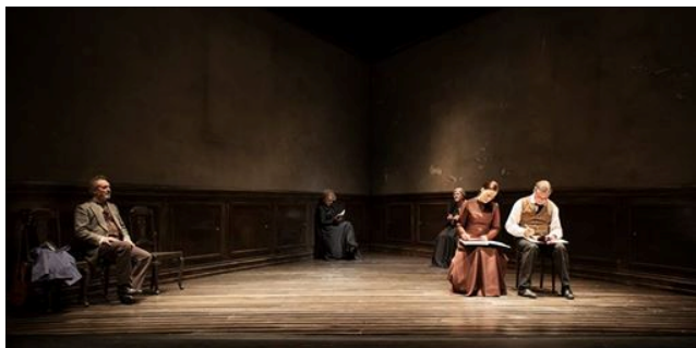
دیمه نیک له خاله قانیا