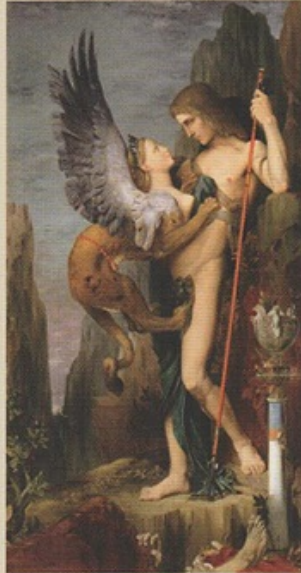
Gustave Moreau, Oedipus ve Sphinks

Roman, bir yandan genç kahramanın aşk, kıskançlık, sorumluluk ve özgürlük duygularıyla derinden tanışmasını hikâye ederken, diğer yandan medeniyetler üzerinden babalar ve oğullar; "otoriterlik" ve birey olma konularını tartışıyor.