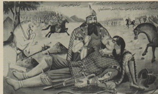
İran halk resmi, Rüstem ve Sührab

Kırmızı Saçlı Kadın 'da okur, Batı'nın ve Doğu'nun iki temel efsanesi Sophokles'in Kral Oidipus 'u (babayı öldürmek) ile Firdevsî'nin "Rüstem ve Sührab"ıyla (oğulu öldürmek) yeniden karşılaşacak ve kendine sıradan hayatlarımızın eski metinlerden ne kadar etkilendiği sorusunu soracak.