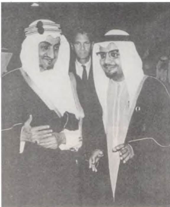
Suudi Arabistan Kralı Faysal ve Petrol Bakanı Zeki Yamani Amerikalı petrolcüler ile yapılan görüşmelerde.