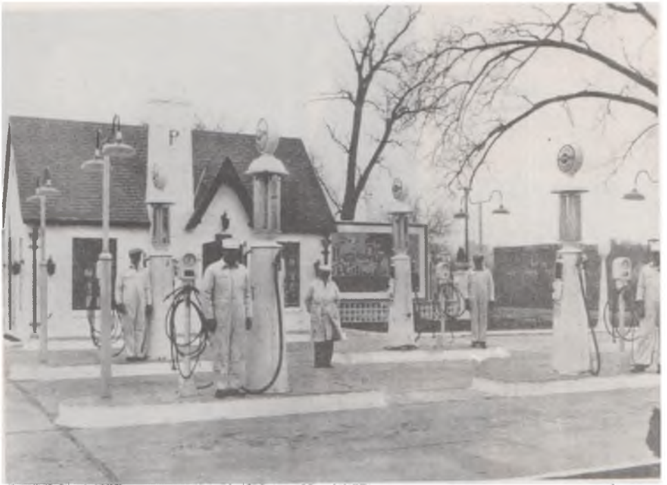
1927 yılında Kansas, Wichita'da, Phillips Şirketi'nin ilk benzın istasyonunun açılışı.