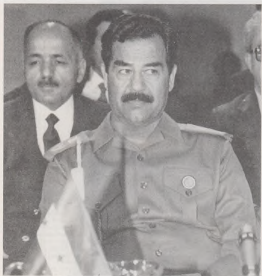
Soğuk Savaş sonrasında ilk petrol krizini başlatan Irak'ın güçlü adamı Saddam Hüseyin.