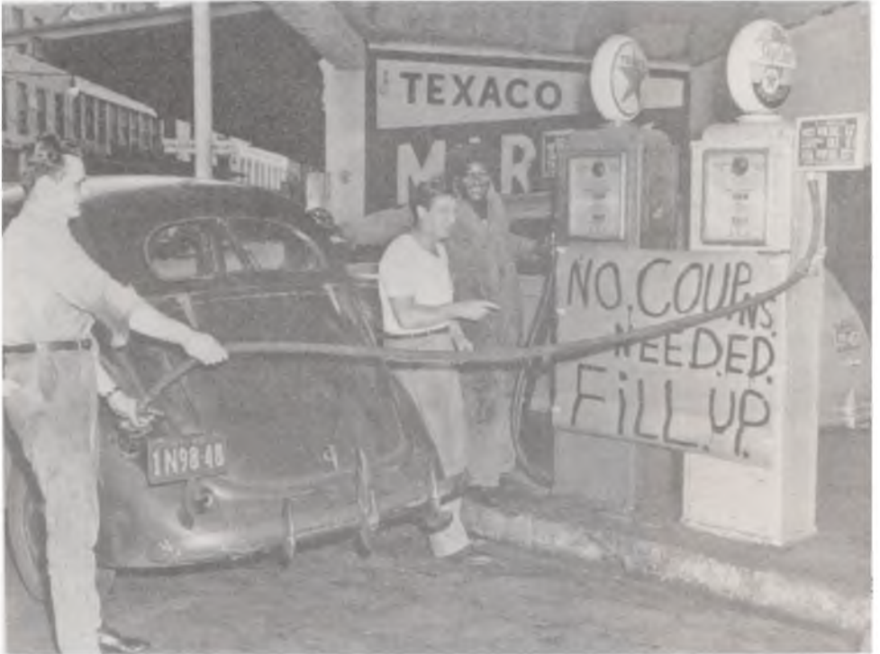
Mutlu günler geri geldi. Benzinde karnesi bitti. Deponuzu doldurabilirsiniz.