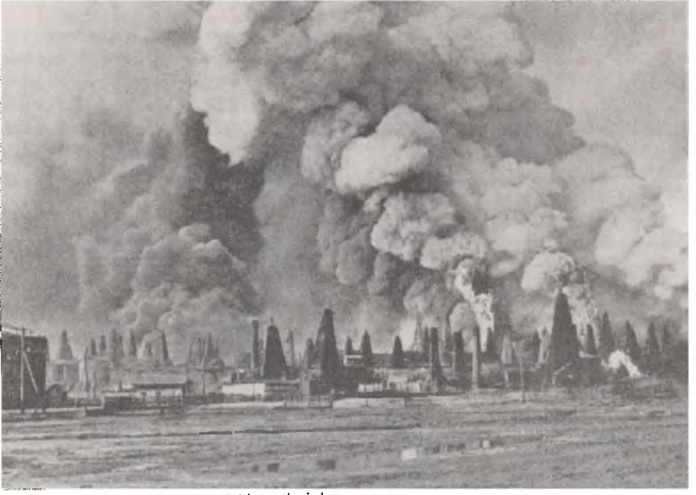
1905 Devrimi sırasında ateşe verilen Bakû petrol sahaları.