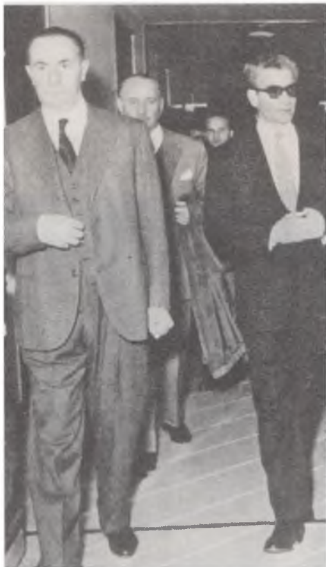
İtalya'nın büyük işadamlarından Enrico Mattei (solda), 1957 yılında İran Şahı Rıza Pehlevi (sağda) ile anlaşma yapınca başlıca uluslararası petrol şirketlerini öfkelenirdi.