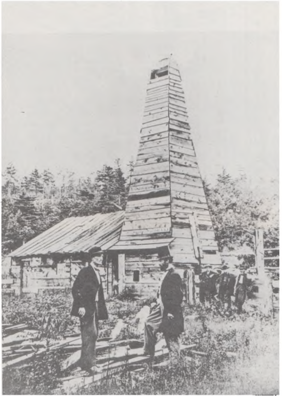
"Albay" Edwin Drake (süldür şapkalı) Pennsylvania'daki Titusville yakınlarında, 1859 yılında açılan ilk petrol kuyusunun önünde.