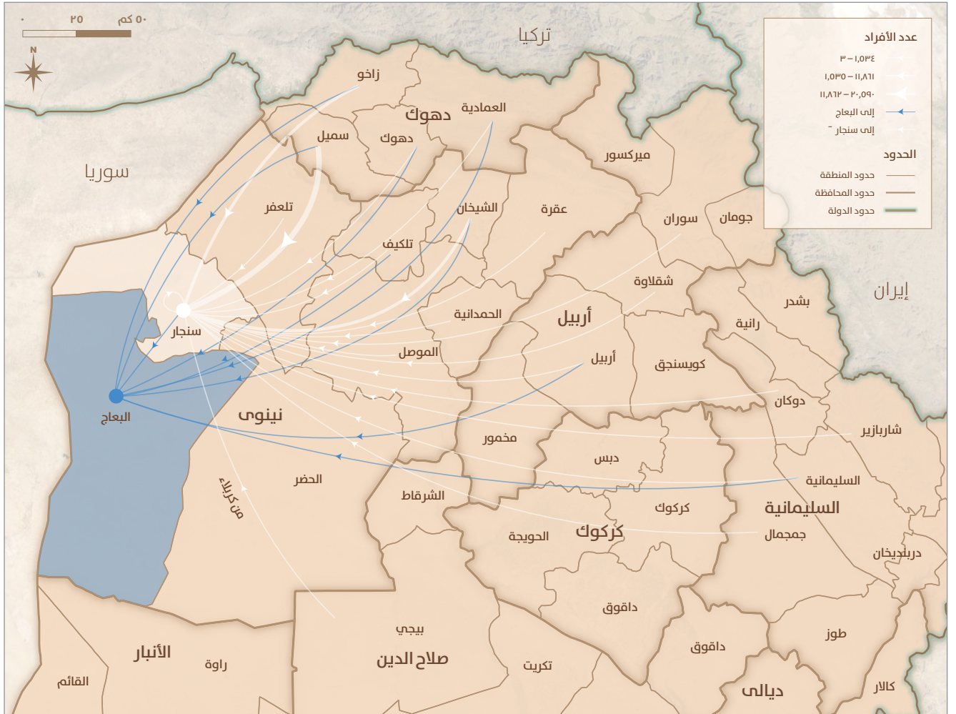
الخريطة ١: التحركات السكانية إلى منطقتي سنجار والبعاث في كانون الأول ٢٠٢٠. يرجى الاطلاع على الخريطة المرفقة

تتناول الدراسة الخيارات المتاحة لإدارة سنجار في سعيها لإيجاد الطريق قديماً. يعد هذا أمراً بالغ الأهمية بشكل خاص منذ الإعلان عن اتفاقية