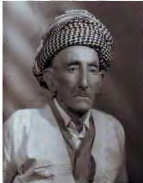
محمود أغا الزيباري