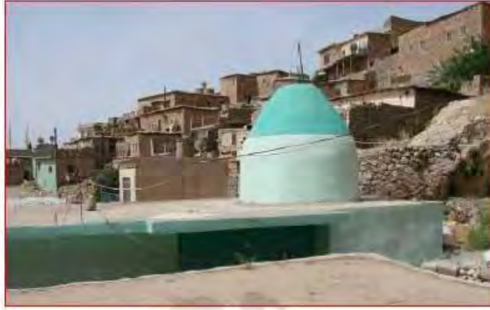
القبة التي على حجرة قبر بير جب