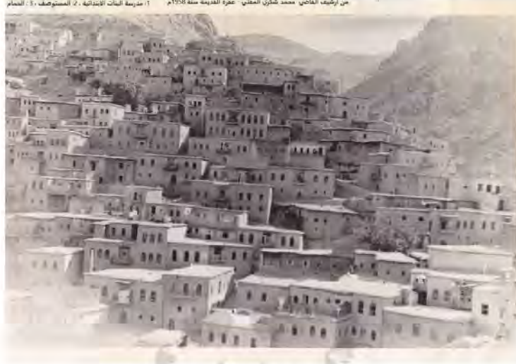
من أرشيف القاضي محمد شكرى المفتي - عمرة القديمة سنة 1958م ١- مدرسة البنات الابتدائية ، 2- المستوصف ، 3- الحمام

مدرسه البنات الابتدائية ، المستوصف ، الحمام تصوير : محمدشكرى مغنى ، (من أرشيف : بلند محمدشكرى) ١٩٥٨