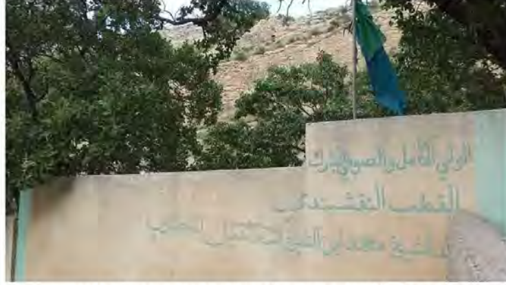
مزار العالم الجليل (الشيخ محمد بن الشيخ اسماعيل المجذوب) المشهور بسيدا مجدوب