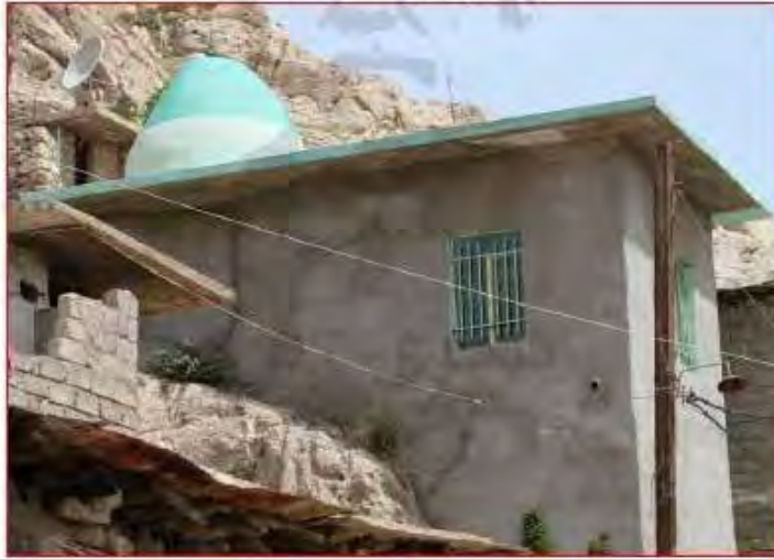
بيت بير جب في عقره، وفيه قبره