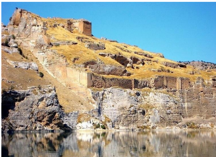
Румкала – здесь находилась резиденция армяно-григорианской церкви с 1149-го по 1293 -й годы.

несен «в селение Тордан, в его родовое имение, расположенное в верховьях восточной части реки Евфрат» 221 . Другой, более ранний средневековый албанский памятник также подтверждает вышеуказанное и указывает, что большую часть своей жизни Григорий парфянин провел в Приевфратском хорониме и прах его хранился «в местечке Тордан» 222 . Эти источники на матрице истины показали реалии истории: следы основателя армяно-григорианской церкви Григория парфянина не могут быть выявлены на Кавказе. И причина тому была простая – армяно-григорианская цер-