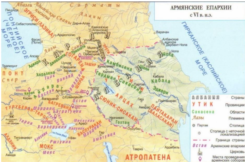
Карта, составленная Ф.Мамедовой

мира. И была образована намного раньше армяно-григорианской церкви. Эти реалии были указаны в албанском источнике М.Каланкатуйского. В созванном в 704-м году церковном собрании в Барде было особо отмечено: «Албанский престол выше и старше армянского» 272 .