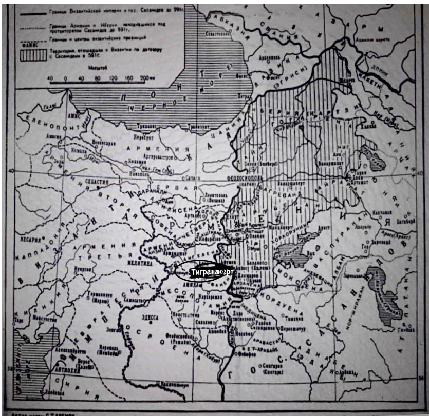
Карта, составленная С.Еремяном. см. Айвазян К.В. «История Тарона» и армянская литература IV-VII веков. С.114.

Карта, составленная С.Еремяном и включенная в монографию К.В.Айвазяна «История Тарона» и армянская литература IV–VII веков» показывает реальную локализацию города Тигранакерта. На карте четко показано, что Тигранакерт был построен в Софене. И принимая во внимание вышеуказанное, констатируем: древние города армян находились в Приевфратском хорониме и, следовательно, армян на Кавказе не было.