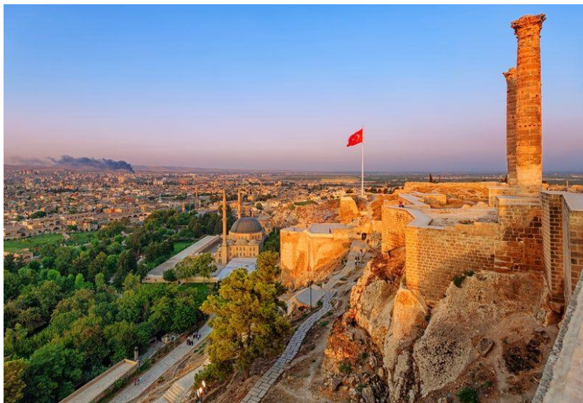
Эдесса – крепость царя Осроены Абгара V, расположенная на окраине города Шанлы-Урфа. Турция.

творчества, фальсификаторы истории, окунувшись в виртуальный мир, развивали свои фантазии и выдвинули новый миф: армянская церковь – это не армяно-григорианская церковь, она – армянская апостольская церковь. И, в принципе, их можно понять. Если целый пласт легенд