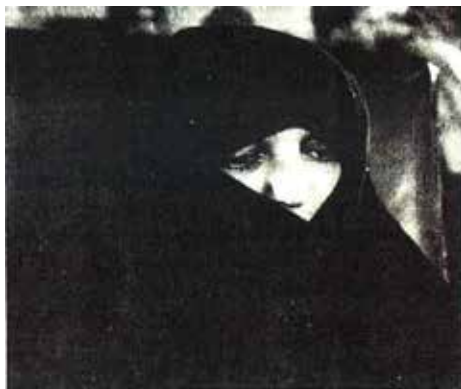
مۆنەر گۆرچی کە ئەمبارانی ئەندام ئە بەجێی دانی بەسای بەسای بە ئە ئێرانی ئۆپی ئێستاتی نا، جێمانی مۆنەتی فارسی ئە ئەر گۆرچی - کە بە چاندور بە ئۆبەنگە - رۆژی بەگنەسە ئە گنەیی گۆرچی ئۆبۆمەر نا.

تاران (NTB- رۆیتێر- UPI): ریبەری ئۆلی لە ئێران دا، ئایەتوللا خومەینی دووبارە هێرشی کردە سەر ئۆپۆزیسیۆن لە ولات دا. ئەو فەرمانی داخستنی ٢٢ پۆژنامە ی دا و داوا لە ئەو ریکخراوە سیاسیانە ی کە پشتگیری ئیسلام ناکەن کرد کە چەکەکانیان رادەست بکەن. لە جوابێک دا بۆ هەموو کوردەکان، خومەینی داوای لە خەڵک کرد کە بۆ قوبولبەستکردنی ئەندامانی حیزبی دیموکراتی کوردستانی ئێران و ریبەرانە هاوکاریی هێزەکانی دەولەت بکەن. لە تاران دا خەڵکیکی زۆر بەشداریان کرد لە رپۆرەسمی بە خاکسپاردنی ئەو پاسدارانە ی کە لە شەرەکانی ئاخری هەفتە دا لە پارێزگا کوردییەکان دا کوژرابوون. ئەوان داوایان دەکرد کە دەبێ ریبەرانە سەرھەڵدانی کورد ئێعدام بکری.