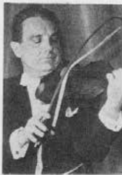
Vega-buen stryker en fire-stemmig akkord.

Fra midten av 1500-tallet overtok den de seksstrengte instrumenters plass i orkestersammenheng. En mann ved navn Gasparo de Solo hvis egentlige navn var Gasparo Bertalotti, fant ut at mennesket var, for fiolinens vedkommende, utstyrt med fire aktive fingre + en løs streng, og den vanlige skala (den diatoniske) kunne herved fortsette fra den dypeste av strengen (g-strengen) videre gjennom kvinten (d-strengen) og slik kunne skalaen gjennomføres gjennom fire oktaver, helt til toppen hvor tonen A eller G betegner grippbrettets avslutning. Ved dobbeltgrep var, til å begynne med, fiolinbuen krum og hårende mindre stramme slik at ved den soppakrømmende buen var det meget mulig uten brudd, å spille på alle de fire strengene på en gang.