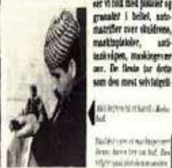
Med kurdisk og kurdisk i Mahabad.

Mahabad er et sentrum for iransk Kurdistan. Her er det kurdisk radio og fjernsynssending, og det er her kollektivet for Kurdi- stan Demokratiske Parti