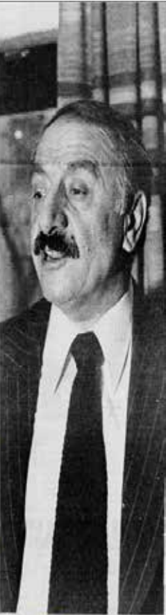
KDP-lederen Ghassemlou. Han ble leder for KDP i Iran i 1975. Han har vært i Norge i mange år.

— Vi er overbevist om at Norge kan bli det eneste vestlige landet som vil støtte de iranske kurdere politisk og i internasjonale fora som FN og UNESCO. Årsaken er at Norge ikke selger våpen til Midt-Østen og heller ikke har behov for olje fra området, i motsetning til andre vestlige land.