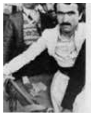
گه‌لێ ئه‌وه‌ ده‌توانن مه‌سه‌له‌یه‌کیک به‌ن؟ ئه‌ی ناوا ده‌کا که‌ ترخی ئه‌ سه‌ر دا‌به‌ین (به‌ چا‌مه‌د؟). هه‌ر و ده‌ا فێشمه‌کی ده‌سانجاش ده‌ر و ئه‌ن.

کوردستان له‌ لایه‌ن له‌شکه‌ری سو‌قیه‌ته‌وه له‌ ئاخه‌ره‌کانی شه‌ری دووه‌می جیهانی دا گیرا. له‌ ۱۹۴۵ دا ئه‌وان پاشه‌کشه‌یان کرد. قازی محه‌مه‌د کۆمارێکی کوردی راگه‌یانند. ئه‌و ۱۱ مانگی خایاند. که‌ ریژیمی شاه به‌ پشتیوانی ئینگلیز و ئامریکا گه‌رایه‌وه. ئه‌وان لانی که‌م ۱۵ هه‌زار که‌سیان کوشت. قازی محه‌مه‌د له‌ سێداره‌ درا. حیزبی دیموکراتی کوردستان له‌ گه‌ل کۆمار دامه‌زرا، حیزبه‌که‌ زۆر به‌ توندی که‌وته‌ به‌ر ته‌عقیب. شاه ۶-۵ جار هه‌ول‌ی تیکشکاندن‌ی حیزبی دیموکراتی