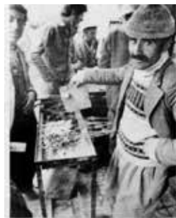
جو‌ردی گه‌ی کورده‌ی سه‌ر شه‌قام ئه‌و له سه‌ر مه‌مفلان گوشت ده‌په‌ژێرن. یه‌ن ده‌لێن ته‌باب (توو نووسراوه‌یه‌ به‌ ده‌له‌ له‌ نه‌ه‌شت و نه‌ه‌ه‌ه‌ی ده‌که‌ که‌ هه‌رێن. بان‌راوه‌ له‌ رۆژنامه‌که‌ دا)