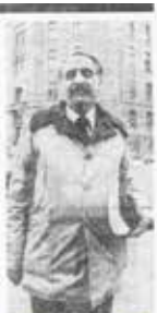
Kurdene over møtte. Det kurdiske partiet har nå sagt for 40 000 revolusjonære soldater med dem i kampen da de skal dra til 10 000 kurdere mistet i kampene mot Iran. 60 prosent av dem var stille.

Det kurdiske partiet har nå sagt for 40 000 revolusjonære soldater med dem i kampen da de skal dra til 10 000 kurdere mistet i kampene mot Iran. 60 prosent av dem var stille.