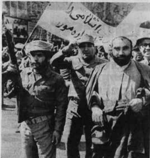
En marsjopprett side om side med iranske soldater under marsjen til støtte for Khomeini i Tebran mandag.

I Tebran marsjerte 25.000 soldater gjennom demonstrasjonene for å vise at de støtter ayatollah Khomeini. Det ble holdt lik-