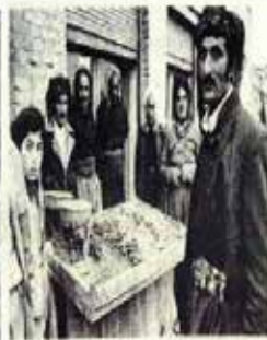
På tur til Mahabad. Et annet region. Feyzian er representant rupper til i tillegg. (Dokumentasjon)

Mahabad er et sentrum for iransk Kurdistan. Her er det kurdisk radio og fjernsynssending, og det er her kollektivet for Kurdi- stan Demokratiske Parti