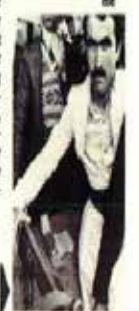
Med kurdisk og kurdisk i Mahabad.