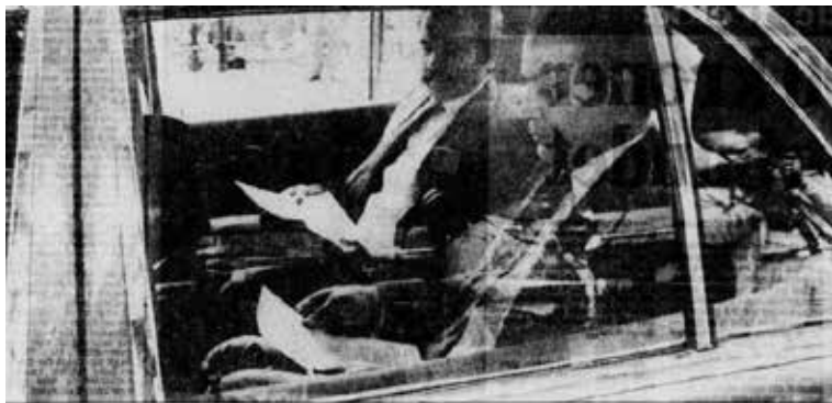
سابق ئوبزراڧە لە سەر ھېرشى فوڭكەمەن لە سەر كورد كە دۆننن لە ئوسلو وە بىگرت، دەمەوئىن. (دوئە، سەم ئوق)

- لە ئاخىرى مانگى ئاورىل دا كاتىك كە ئەرتىشى ئىران لە گەل سەربازانى موسلمانى خومەينى ھېرشىيان كرده سەر چوار شارى كوردى، سنە، سەقز، بانە و مەريوان جاريكى دىكە شەپ سەر لە نوڧ دەستى پىكرد. بەشى گەورەى ئەو شارانە و ئىران كراون. تەنيا لە سنە لە سەرووى ھەزار كەسى سڧىل كوژراون. ئىمە ھىشتا ھەژماری كوژراوانى شارەكانى دىكەمان نازانىن. ھىرش بە تۆپەكانى نووژەن، ھىلىكوپتېر و فانتۆمى ئىچىروانى بوو.