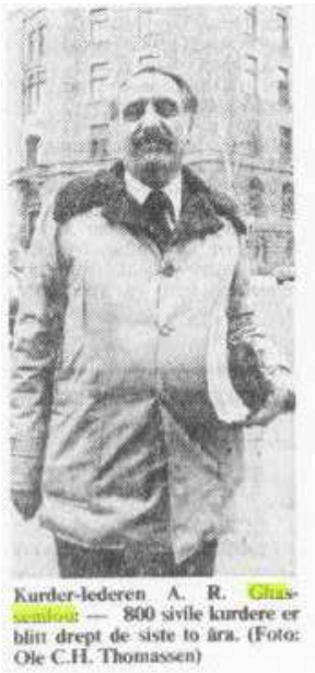
ئێرەوێ وێنە: رێبەری کورد عەبدولرەحمان قاسملوو - [۸۰۰] کوردی سڤیل لە دوو سالی دا کوژراون. (وێنە: ئۆلە سی. تیچ. توماسسن).

- قاسملوو دەلی کە ئیمە ئیستا تێدەکوشین کە بەرەیه کی هاوبەش لە گەڵ هیزەکانی دیموکراتیک و نیشتمانپەرور لە ئێران دا پیک بینن. دان و ستان بوو بەرەیه کی وەها لە گەڵ ریکخراوی ئازادبەخشی خەلک - موجهیدین - و نەتەوێیەکانی موسەدقی، بە خۆشیەوێ بە زوویی کوتایی پی دی. بەو شیوێیە ئیمە دەتوانین ئێران لە رێژی می سەدە ئیوێراستەکانی ئاخوندی رزگار بکەین و ئێرانیکی سەربەخوێ کۆماری دروست بکەین.