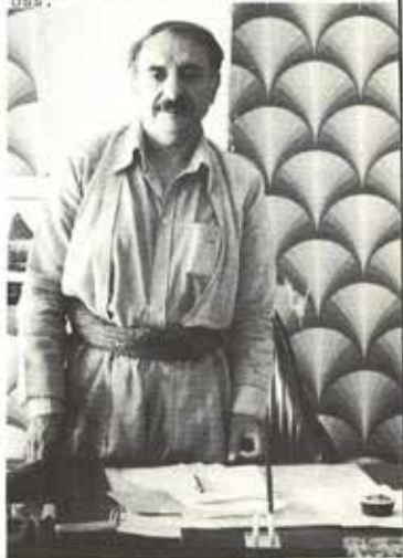
Abdul Rahman Ghassemlou, generalsekretær for iransk KDP. Bildet er tatt i Mahabad i juli 1979.

Et annet eksempel fra en palestinsk kilde. Vi har svært gode forbindelser med våre palestinske venner. De har blitt fortalt direkte av aythalløer at de vil bruke den politiske atmosfæren til å slå ned den kurdiske bevegelsen. Så det er ikke vår feil at de slåss mot oss.