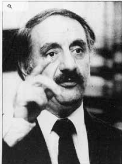
Generalmajor Ahmad Rahn Ghasssemlou i det forbudte Kurdistans demokratiske parti i Iran, Ahmad Rahn Ghasssemlou.

— Iran må være det eneste land i verden der presidenten er i opposisjon, sier Ahmad Rahn Ghasssemlou som er generalsekretær i Det kurdiske demokratiske parti og leder for de seks millioner kurdere i Iran.