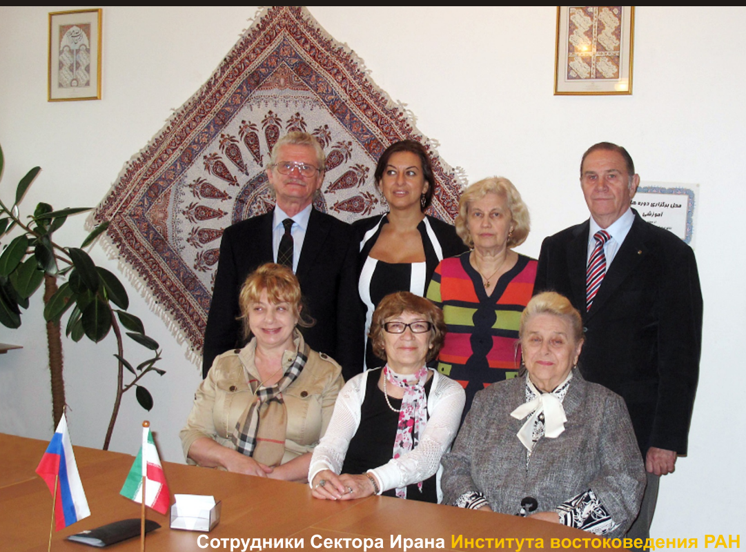
Сотрудники Сектора Ирана Института востоковедения РАН