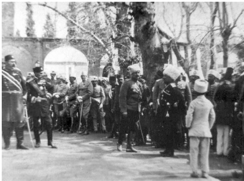
Генерал Н.Н. Баратов в черной черкесске и капитан К.Н. Смирнов в Тегеране, 1916 г.

Наибольший интерес представляют письма, отправленные за период с ноября 1915 г. по сентябрь 1916 г. из иранского сектора Кавказского фронта, где он заведовал разведкой и дипломатической частью штаба Экспедиционного кавалерийского корпуса генерала Н.Н. Баратова. Официально его статус звучал так: «Состоящий в распоряжении Главнокомандующего Кавказской Армией, числящийся по гвардейской легкой артиллерии капитан Смирнов» 3 .