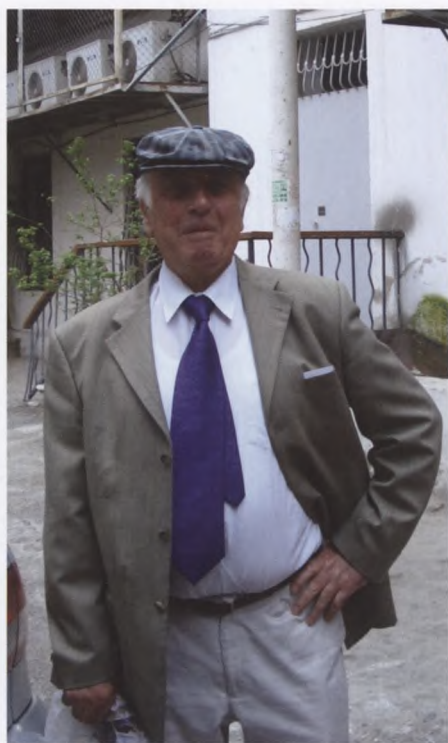
35. Баку, во дворе дома брата Гофига. 2004 г.