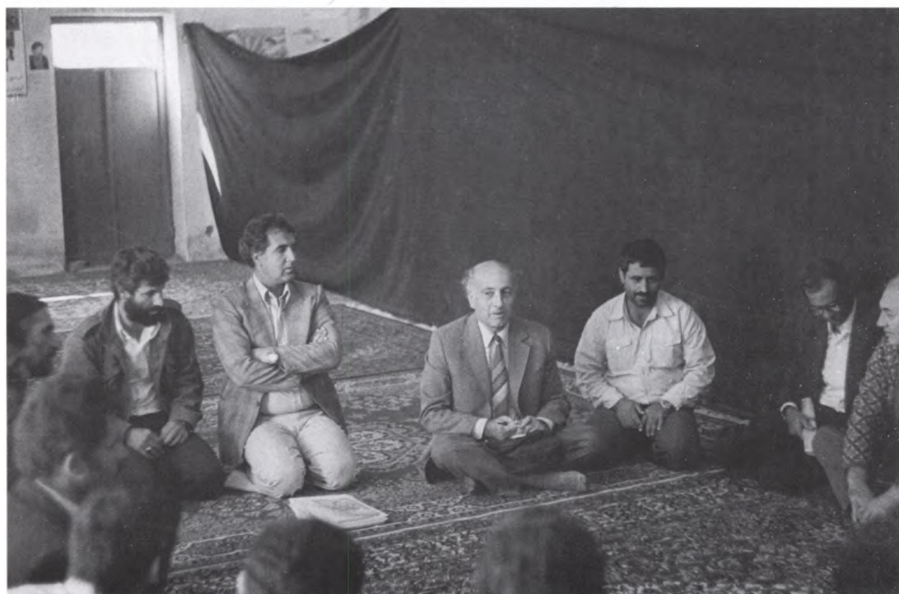
23. Говорить он любил, говорил страстно и умел увлечь любую аудиторию, от рабочих до академиков, от киргизских пастухов до лондонских журналистов. Лекция перед группой иранских ученых и деятелей. Иран, 1979 г.