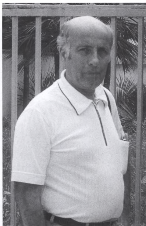
21. Грузия, 80-е гг.