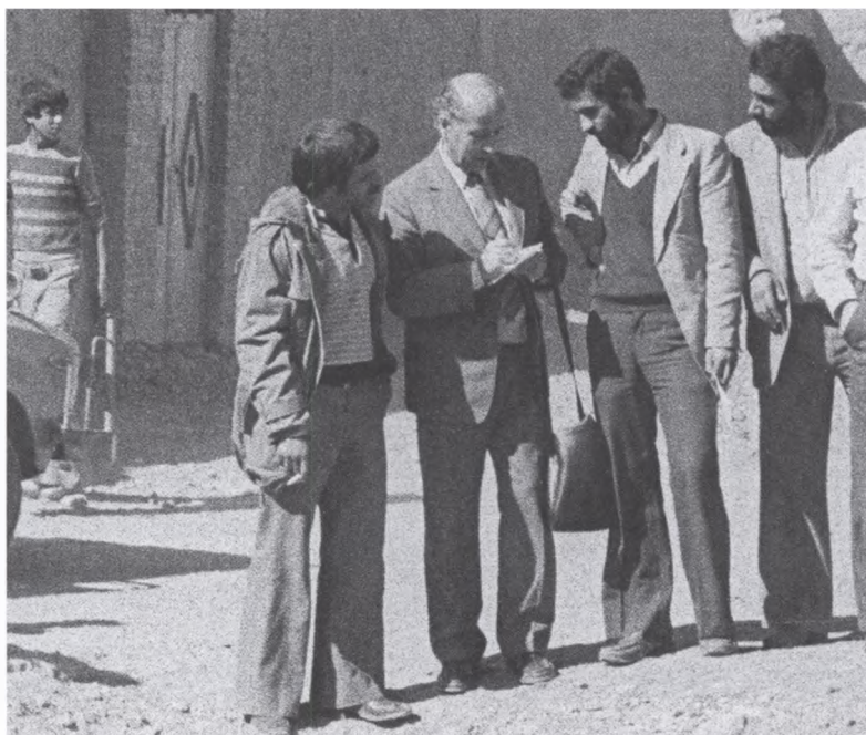
22. За любимым делом: рассказывает о проблемах истории и общества молодым иранцам. Иран, 1979 г.