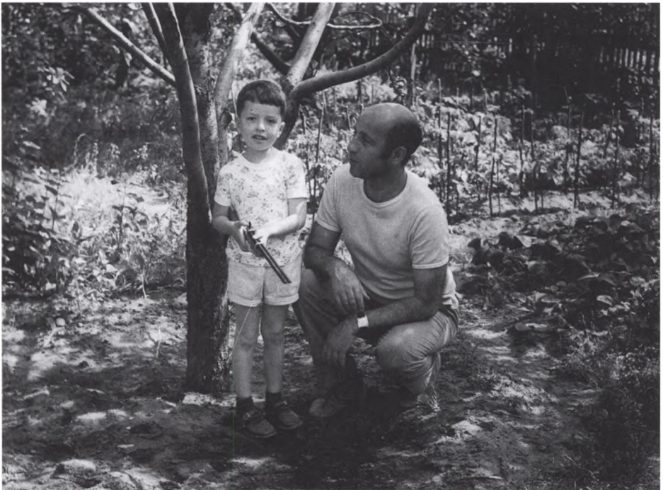
11. На даче в Овражках. Начало 70-х гг.