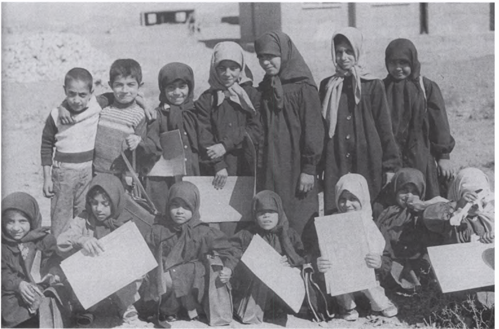
25. Иранские дети