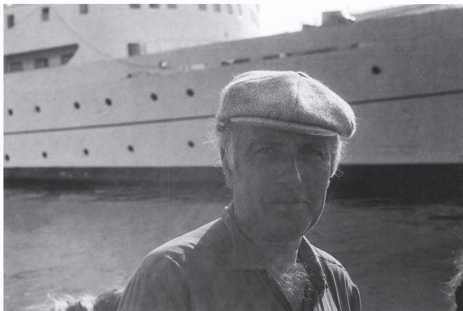
18. Море он любил всей душой и по морю всегда скучал. Черное море, начало 80-х