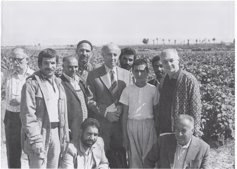
24. Иран со своей непростой историей был для него постоянным источником научного вдохновения. 1979 г., с группой ученых и местных жителей