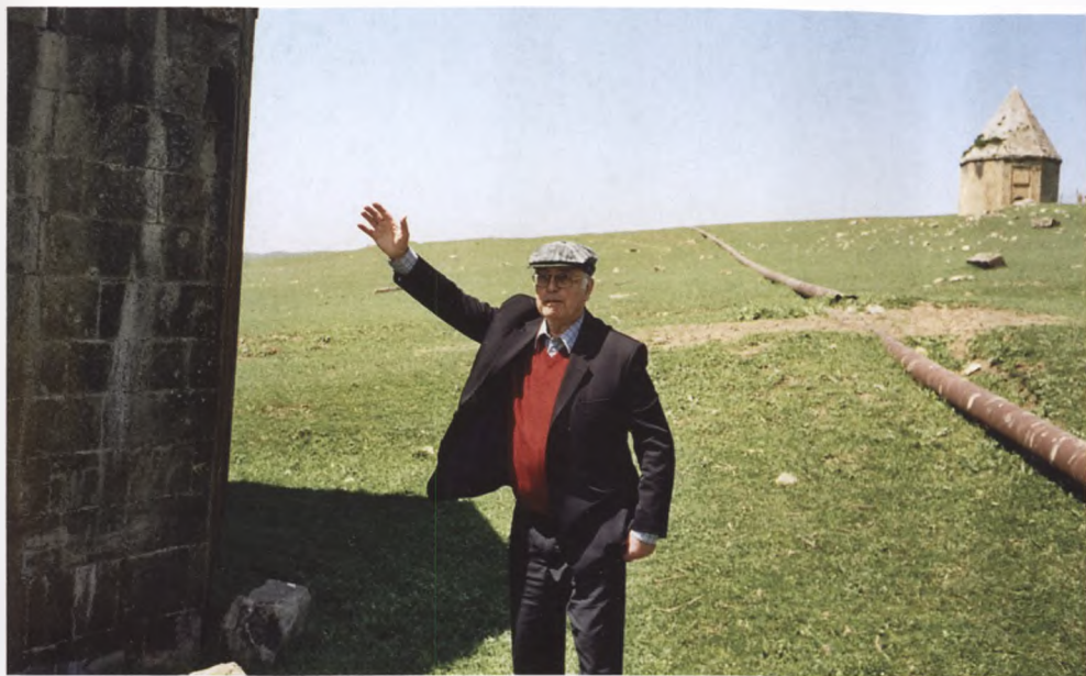
37. Всю жизнь он шел к тому, чтобы написать исторически достоверную книгу про азербайджанских тюрок. К сожалению, труд этот закончить он не успел. Азербайджан, древние религиозные сооружения по дороге в Шамахы, 2003 г.