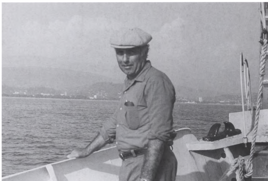
20. Черное море, начало 80-х