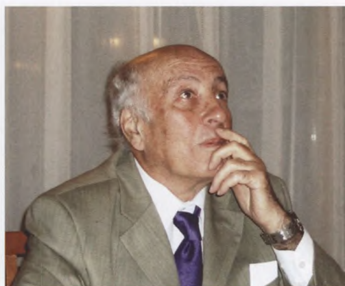
36. 2004 г.