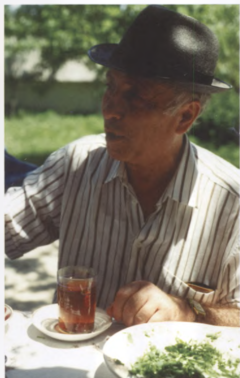
32. Как настоящий азербайджанец, любил чай и застольную беседу