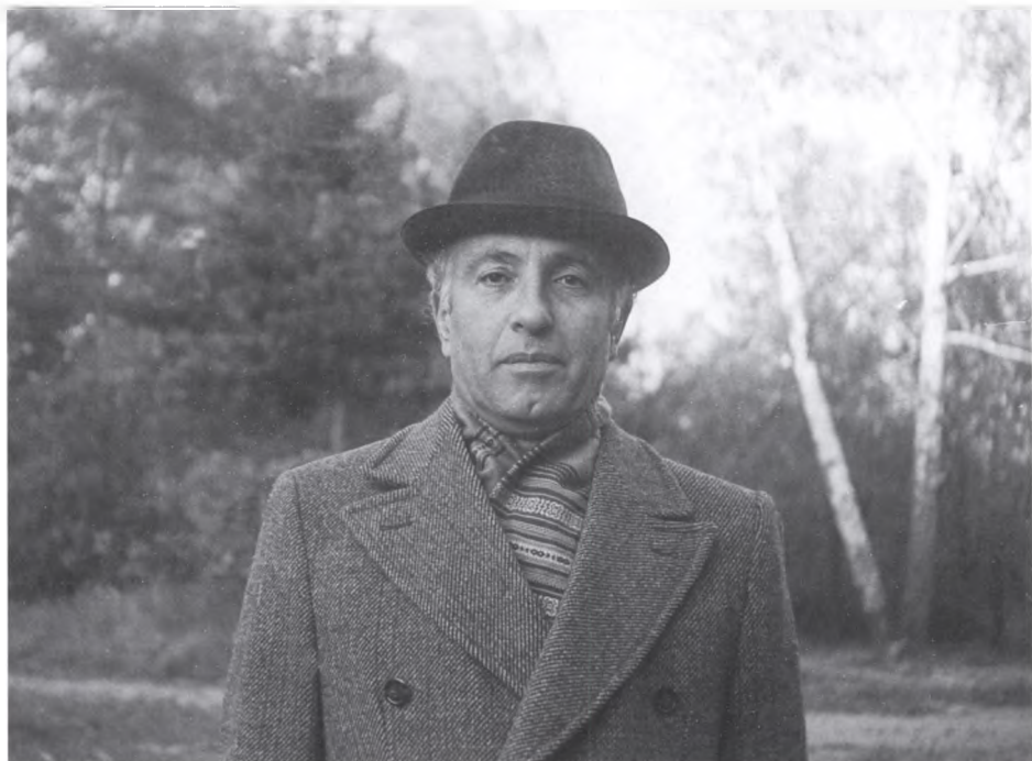
16. Конец 70-х — 80-е гг.