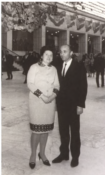
6. С молодой супругой в Кремлевском дворце съездов. Конец 50-х гг