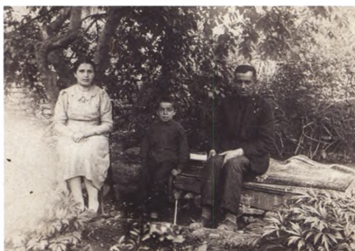
3. В родовом саду, Гянджа