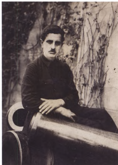
2. Папа, Мамед-киши