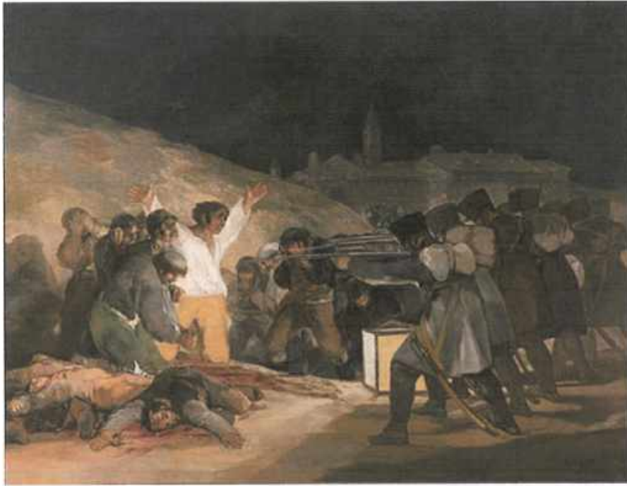
۳ی مایوی ۱۸۰۸ی ملارید

ناپلیون له دواييدا نيعتيرافي كرد كه گهوره ترين هلمه‌ي شهو بوو كه ئيسپانياي داگير كرد و، شهو كو تاييبي زور تر به هوي شهو هلمه‌ي شهو بوو، نهك شهو هيرش كردنه سهر روسيا .