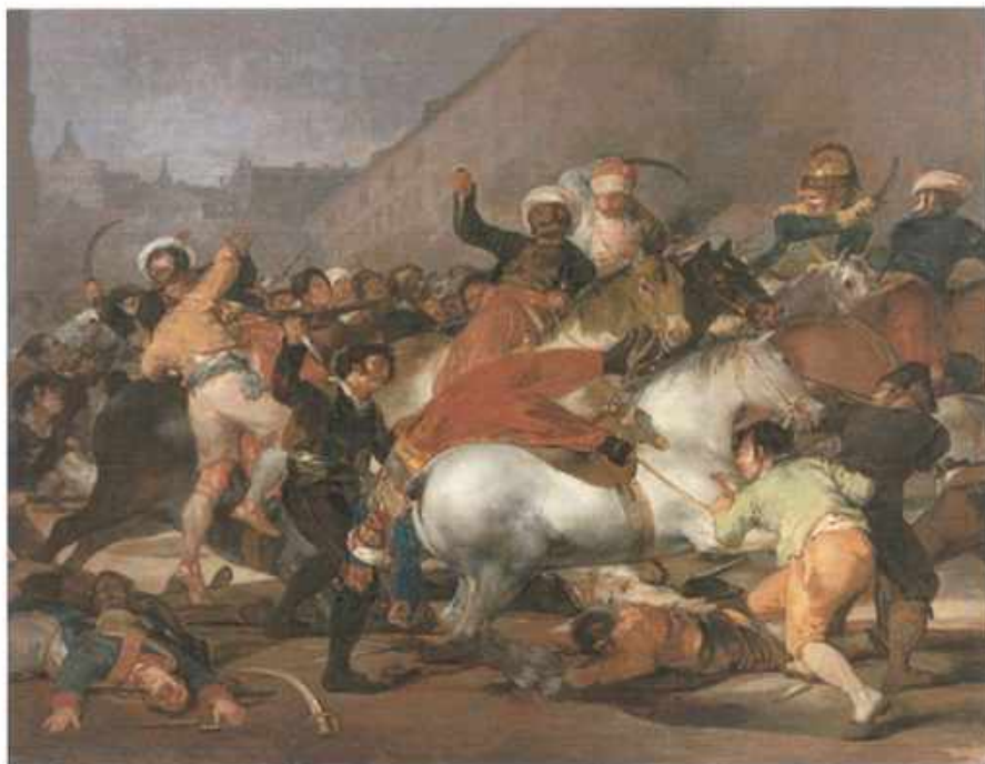
۲ ی مایوی ۱۸۰۸ ی مەدرید

ناپلیۆن بەشی زۆری نیسپانیای داگیر کرد، هیز ئیکی مەملووکە مسوڵمانەکانی میسریی لەشکرەکەیی، رۆژی ۲ ی مایوی ۱۸۰۸ چوونە مەدریدی پایتەخت .