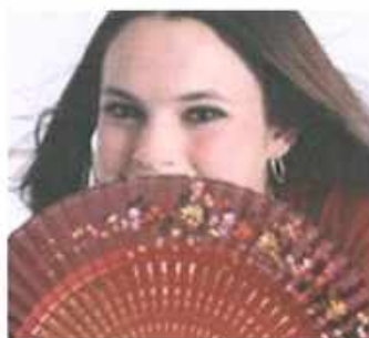
خانمیکى نیسپانی به زمانى باوشین دهلیت : بی هاوسر و بی دوستم