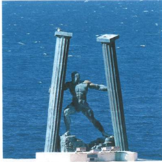
پهیکمريکی کولمکهکانی هرقل