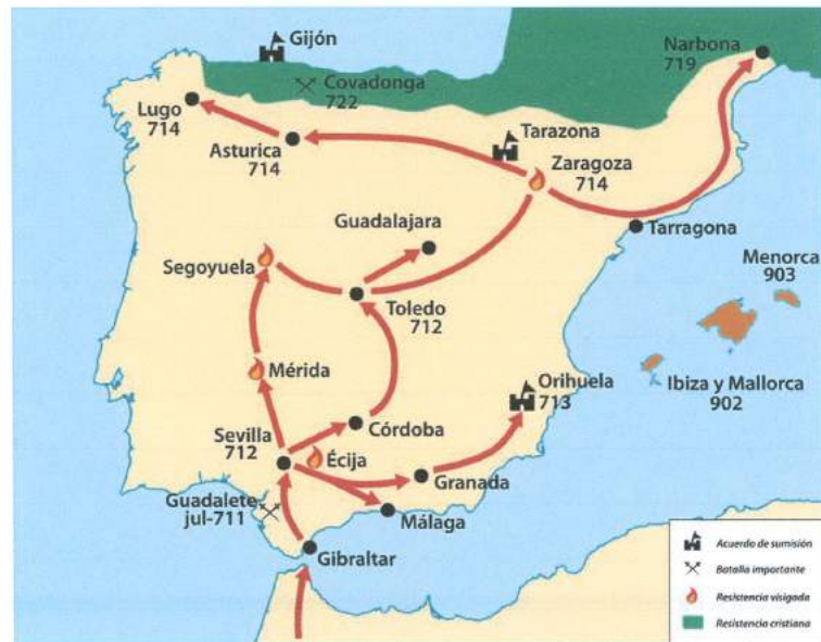
لشکری مسولمانان لهو سالانهدا نمو شوینانهیان گرت