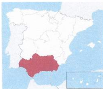
ستانی ناندالوثیا ( یا : ناندالوسیا) ی ئیسپانیا

که طارق و هیزیکهه له کهشتیهکان دهرچوون و چوونه سهه بهژی ئیسپانیا، طارق فهرمانی دا ههسوو کهشتیهکان سووتیندران، نهوجا طارق به لهشکرکهه گوت : البحر من ورائکم والعدو أمامکم ... (دهریا له پشتتانهوه و دوزمن له پشتتانهوه...)، بهوجۆره هانیان که شههه بکهه، چونکه به سووتاندنی کهشتیهکانیان ریگای گههانهههیان بۆ نهههیهوه، ههر سههههوتن یا کوژرانیان لهپیش بوو ... که نهفسانهههکی ههچووچه، نه نهسلئ ههیه و نه فسل .