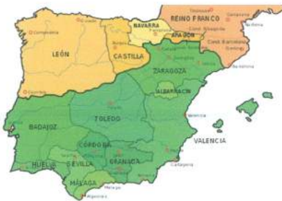
نپسپانیا سالی ۱۰۳۷، رنگه سهوزمکه : نههارته مسولمانهکانی ملوک الطوائف