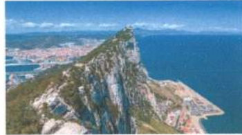
گیبرالتار ( جبل طارق )