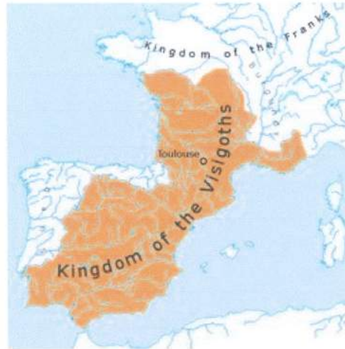
دولت پادشاهی فیسیگوتی (گوتی روثاوا)