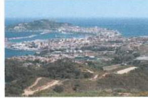
جبل موسی لای سبتہ