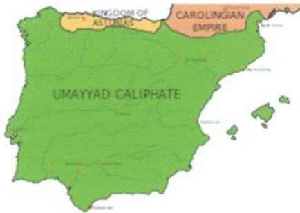
نپسپانیا سالی ۷۲۰، رنگه سهوزمکه : خیلافتهتی نپسلامییی نههوی

که مسولمان نپسپانیایان ففتح کرد (۷۱۱-۷۱۴)، نئتر هیچ دهولتهتیککی جگه لهوهی نهوان لهو ولاتهدها نهما . نهجییزاده له باکوور به شهر رووبهرووی مسولمانان دهبوونهوه، بهلام دهولتهتیکیان نهبوو، تا " پینلاخیوس" (دۆن پینلیۆ) سالی ۷۱۸ یهکهم دهولتهتی مسیحییی دواي نهمانی دهولتهتی فیسیگۆتی، له " ناستوریاس" راگیاند و، بوو به یهکهم پادشای ریکونکیستا و تا کوتایی ژبانی له ۷۳۷ هه پادشای بوو . نهوجا تا دههات قهلمهرووی گهوره دهبوو، تا بهشیککی گرنگی باکووری گرتهوه . ریکونکیستا بههوی کیشه و ههراي ناوخوی نهجییزادان زۆر خیرا نهدهرویشته بهلام بهراوردی نه دوو نهخشهیه بکه که له ۳۱۷ سالدای به چی گهیشته و چهند له قهلمهرووی ولاته له مسولمانان سهندر اوتهوه :