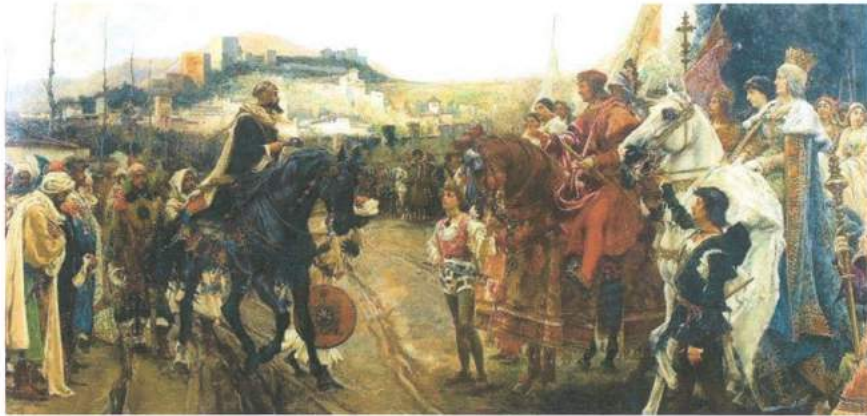
تابلویەکی سالی ۱۸۸۲ ی هونەر مەندی ئىسپانى پرادىيا

دواتر بۇ قەلئەمەرە مویى ئىمپراتورانىكى تری ئىسپانى و، له دواییشدا بۇ قەلئەمەرە مویى ئىمپراتوری ئینگلیس بەکار هینرا .