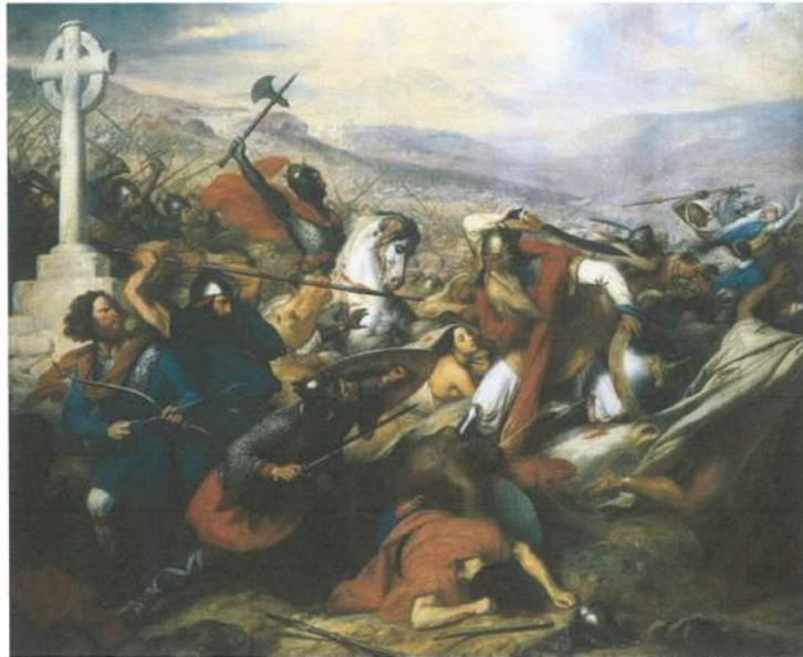
شهری توور یا پواتیهی نوکتوبری ۷۳۲

نامازیغییهکان لهسهه جیگرهوهیهکی ریکنهکهوتن، نیتز ههموو هیزمهکشایهوه " الأندلس " . نهمه پترین ههگشانی هیزی نهمهوییهکان بوو له نهوروپا .