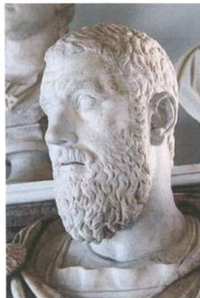
" ماکرینوس" لە مانیکی نامازیگی، نیمپراتۆری رۆما ۲۱۷-۲۱۸