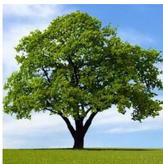
Dar kesk e

✚ Em baş li wêneyên li jêr temaşê bikin û taybetiyên wan vebêjin: