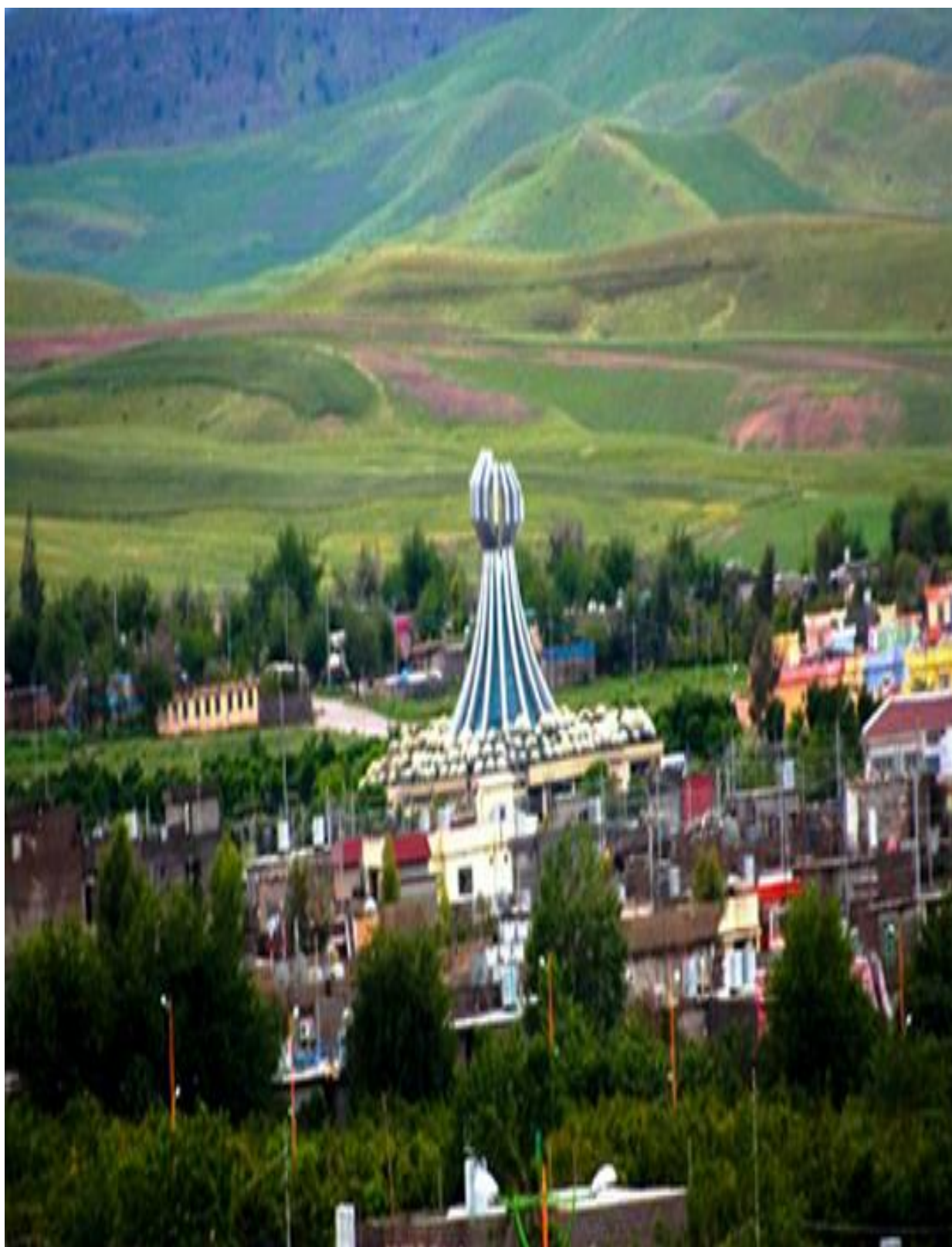
وینہی مزاره‌ک‌هی هه‌ئه‌بچه که‌ناوی (5)هه‌زار شه‌هیده‌ک‌هی تیانووسراوه

دووهم:دهسه‌لاتی جافه‌کان له‌هه‌ئه‌بچه‌دا