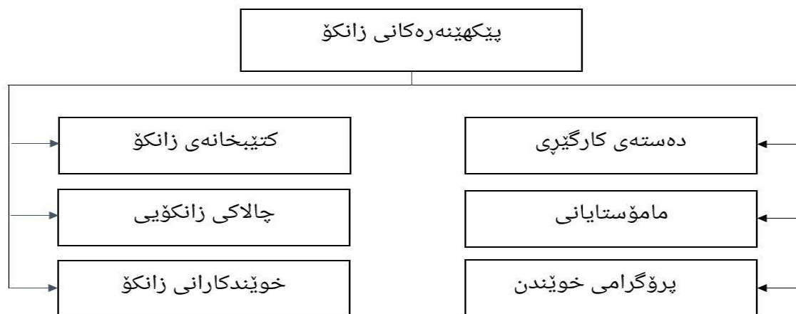
وینە ی (3) پیکهینه ره کانی زانکۆ (تویژەر دروستی کردووہ)

له خواره وه ئاماژه به رۆلی هه ریه که له و پیکهینه ره کانه ده که یه له په رده ان به به رپر سیاریتی کۆمه لایه تی لای خویندکارانی زانکۆ :