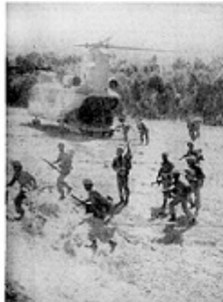
افکار نایب تهرانی در جریان نبرد خونین درسقز با هوایمان بنهر ان رسید

در پیام امام خمینی صلوات بر روحه مطهره استقامت هشدار رهبران انقلاب به منافقین ● اگر منافقین دست از شیطنت برنهند، نمانندیم ● فوجیان مسیح که انجام گرفته، انجام میدادیم