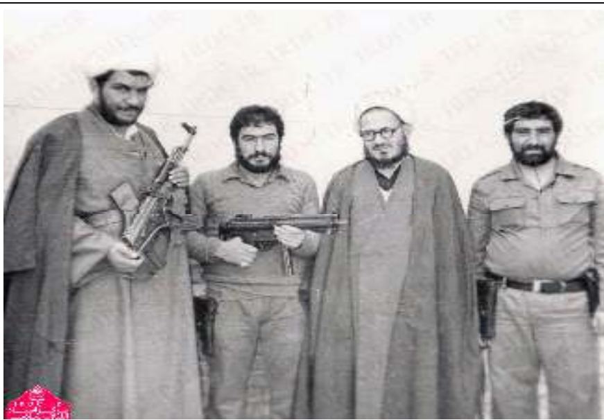
ویندی رنگه زپهرستی به ناویانگ مه لاجه سه نی ترکی نازهری، نه چه په وه یه که م که س، نوینهری خومه یینی نه پاریزگه ی ورمی، بکوژی سهدان کورد نه شاری نه غه ده و نه پاریزگه ی ورمی!