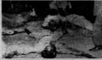
تشیع جنازه صدها هزار نفری

علامه مطهری و امروز پیام هفت فرستاد ستاد چمران کنترل مرزها را بر عهده گرفت