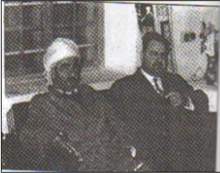
صورة تجمع بين ملا مصطفى البارزاني والاستاذ فؤاد عارف

من تاريخ العراق لضمان الحقوق القومية للکرد . ويبدو أن السعدي كان أكثر قادة الانقلاب حماساً لحل القضية الكردية حلاً سلمياً عندما أكد للوفد الكردي ما نصه: "أنكم أقرب الناس إلينا لأنكم تشكون الهمّ القومي الكردي، كما نشكو نحن الهم القومي العربي. نحن مجزأون بحكم الاستعمار وأنتم مجزأون أيضاً. ولا بد أن يكون كلُّ منا حليفاً للآخر تاريخياً ومصرياً. وما اتفقنا عليه الآن يجب أن يتفق مع الظروف الإقليمية والعربية والعراقية أما ما يمكن أن يتمخض عن وفاقنا في المستقبل فهو أكبر من ذلك بكثير" (١) .