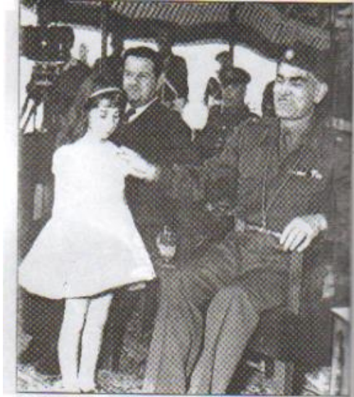
عبدالكريم قاسم ووزير الدولة فؤاد عارف في احتفال عيد الشجرة ٢١ آذار عام ١٩٥٩، يبدو في الصورة حافظ علقون مرافق عبدالكريم قاسم واللواء الركن علي غالب عزيز معاون رئيس أركان الجيش

وفي الواقع، أن النصوص الواردة في مواد الدستور المؤقت بخصوص الكرد ظلت نصوص مجردة لم تترجم فعلياً على أرض الواقع، وأن الكلمات الرنانة التي كان يرددها عبدالكريم قاسم بخصوص الكرد وحقوقهم القومية كانت مجرد فقاعات في الهواء، لأن توثيق وتعميق الصلات بين الشعبين العربي والكرد لا يتم بتشريع القوانين فقط بل يتجاوز إلى الإجراءات الفعلية في المجالات السياسية والاقتصادية والاجتماعية كافة، لأن تجارب الحياة تبين أن التنظير مهم، لكن التطبيق هو الأهم، والأخير لا تكتمل أبعاده، ولا يحقق أغراضه ألا إذا كان تطبيقاً صحيحاً فعلاً.