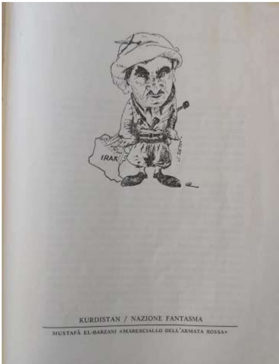
کەریکاتیریکی لەسەر مەلا مستەفا بارزانی "مارشالی سوپای سور".