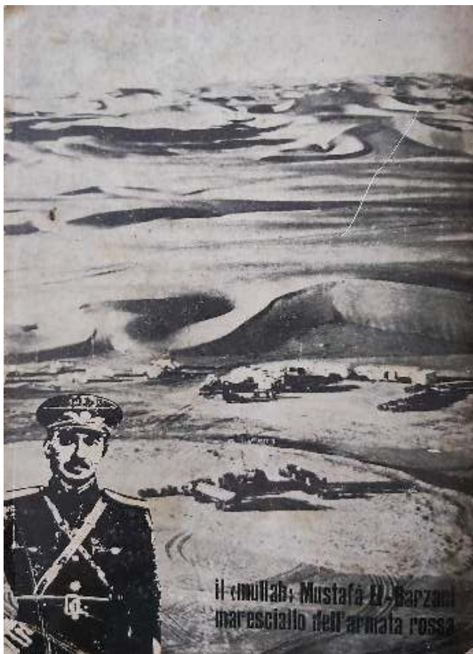
وینەى بەرگی دواوہى کتیبەکە