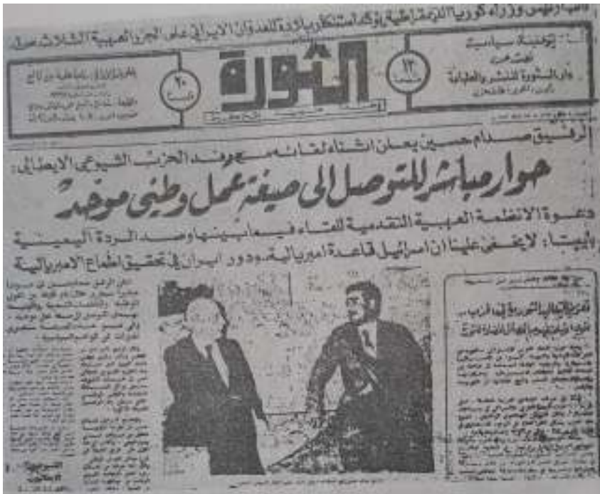
دیداری سه‌دام حوسین و جان کارلۆ په‌بیته، له‌روژنامه‌ی سه‌وره‌ی به‌غدا، له ۲۷ شووباتی ۱۹۷۳

به دهست گه‌یشت، له به‌غدا، سه‌بارهت به شکستی سه‌ردانه‌که، په‌بیته دهلی "له سه‌رهتا بیرمان له‌وه کردبووه‌وه زیاره‌ته‌کی بارزانی، له چیاکان، بکه‌یه‌ن به‌لام به‌داخه‌وه ئه‌و ده‌رفه‌ته‌مان بۆ نه‌په‌خسا....." ۵۲ .