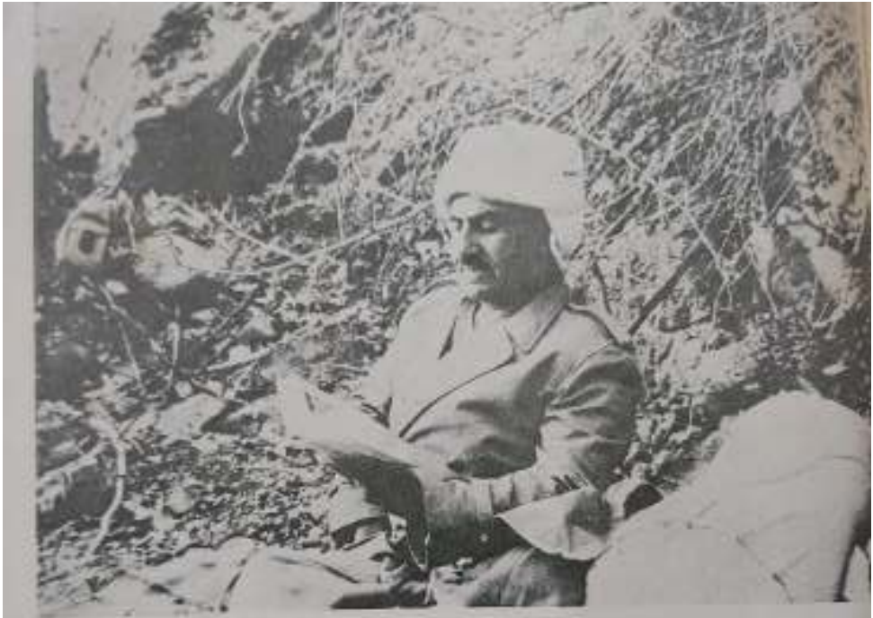
Mustafâ El-Barzani, in posa un po' eccentrica, nel suo covo sulle montagne kurde.