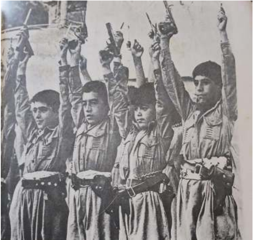
منالانی کورد، به دهسته‌کانیان سومبلی خه‌بات به‌رزده‌که‌نه‌وه: قه‌له‌م و ده‌مانچه