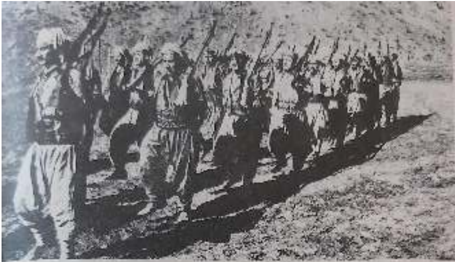
Guerriglieri kurdî in marcia. (In Avana) - La attendamento kurdî.