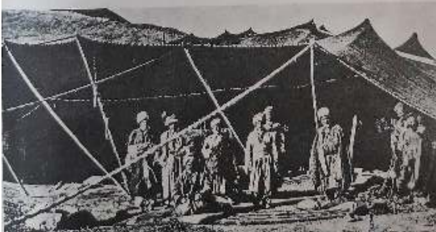
جهنگاوهره كوردهكان له سه ره وهو له خواره وهش ده وار نشينه كان