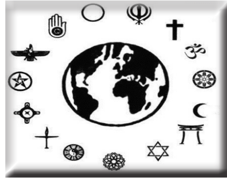
Hin simbolên ol û rêolan

Li pirsgirêkên olî yên di nava gelan de, pirsgirêkên rêolan (mezheb) jî zêde bûne. Sozên olan, ên ku ji bo biratî, hevgirtin û aştiyê, li hemberî berjewendiyên şênberî didan, xwedîbandoreke sînordar bûn. Çîneyetiya ku di nava civakê de bi pêş ketbû, ji mêj ve, heman gel veguharandibû komeke pirsgirêk û pevçûnan.