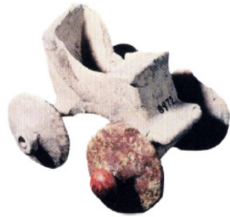
Maşîneyeke 2000 B.Z. li Mezopotamyayê hatiye dîtin

Weke ku em di têkîliya saziyên civakî de jî dibînin, pêvajoyên çandî ku pergal û saziyên civakî li gorî xweseriya xwe sererast dike, heynên liberçav, çand e. Saziyên civakî, bi hev re di nava têkiliyan de ne. Di encama van têkiliyan de hevbandoorkirin û jihevbandorbûn, pergal û pêkhatiyên civakî, pêk tînin.