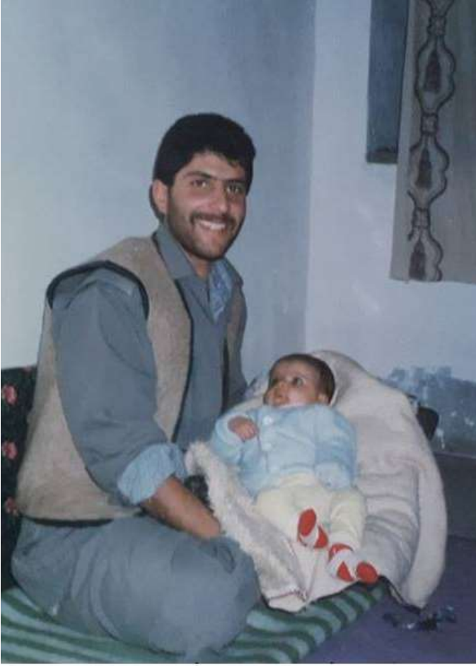
شه هيد سه لاج ره زايی و چيمهن کچی شه هيد جه واد موسه وی