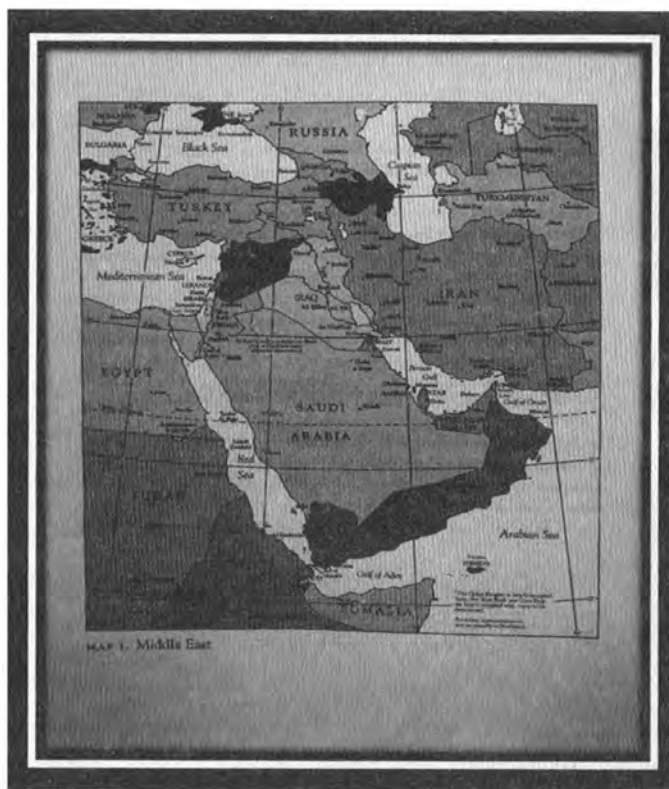
نخشه‌ی ژماره (۱): پژوه‌لانی ناوه‌راست