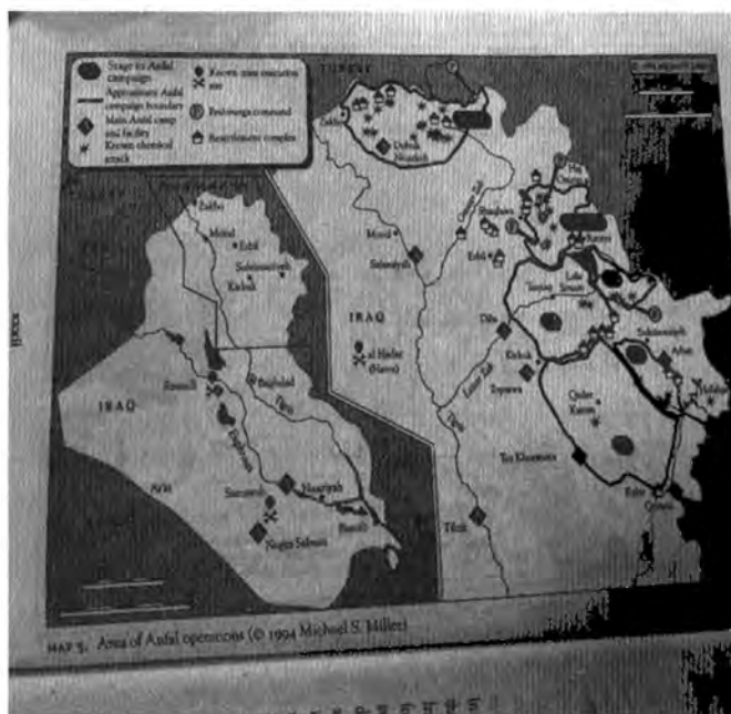
نەخشەى ژمارە (۵): ناوچەکانى ئۆپەراسىيۆنى ئەفغال (مايكل ميلەر)