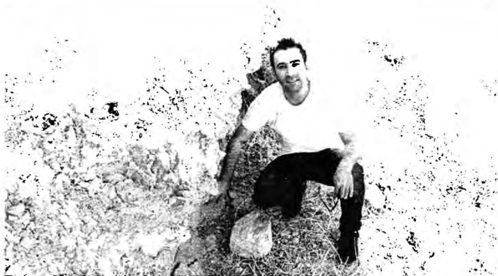
گه شتی مهیدانی توێژهر/ پاشماوهی قه لایه کی کۆنی شوپینه واری له ناوهندی ناحیهی خه له کان