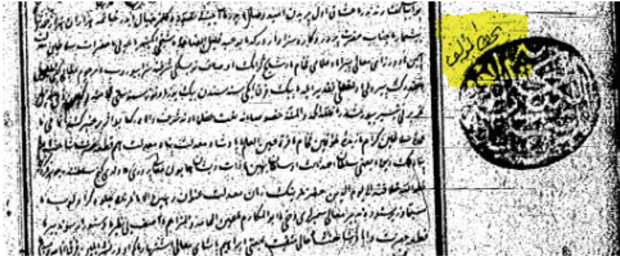
Resim 3: Şeyhî Mehmed Efendi, Vekâyi'ü'l-Fuzalâ , Mısır Milli Kütüphane Tarihî Türkî nu. 170, vr. 623b.

Her şeyden evvel MM nüshasındaki yazı stili ile yukarıda Şeyhî'ye âidiyeti kesinleşmiş olan yazı stili farklıdır. Üstelik yazmanın “müellif hattı” olduğu bilgisi derkenâra farklı bir kalemle yazılmıştır. (bkz. Resim 3)