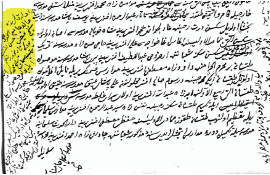
Resim 2: Uşşâkîzâde İbrahim Hasîb, Târîh , Süleymaniye Kütüphanesi Esad Efendi 2438, vr. 273b.

Müsvedde nüshadaki hattın dahi yazara âdiyetini sorgulayıp başka çalışmalarda Şeyhî Mehmed Efendi'nin yazısı olup olmadığını araştırırken yeni bilgilere rastladık. Uşşâkîzâde İbrahim Hasîb'in 1106-1124 (1694/95-1712/13) yılları arasındaki hâdisâtı anlattığı Târîh 'inin günümüze sadece müsvedde müellif hattı nüshası ulaşmıştır. Yazar Medine kadılığına tayin edilince, eser yarım kalmış ve 1118-1119 (1706/07-1707/08) yıllarının vekâyi'i başka biri tarafından yazılmıştır. 1 Esere ilavelerde bulunan başka bir şahıs da, kendi ismini doğrudan zikretmeden babasının adının Şeyh Feyzî Hasan Efendi olduğunu belirtmiştir. 2 (Bkz. Resim 2):