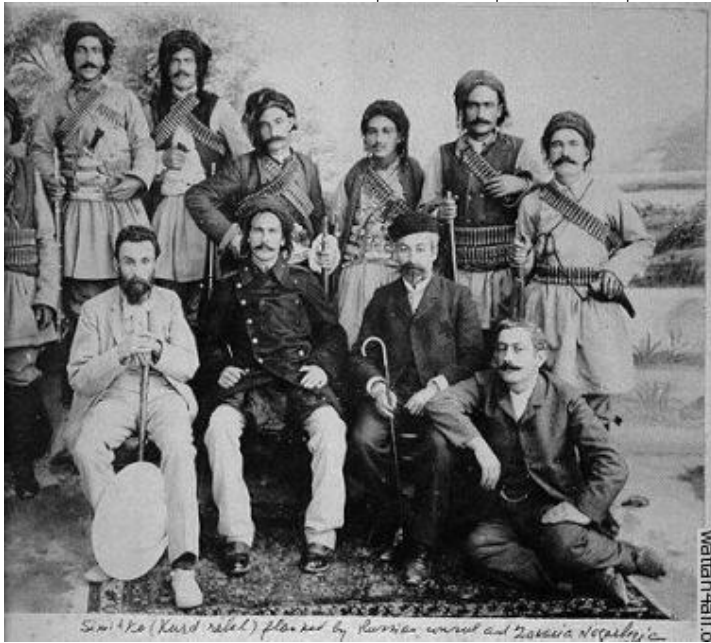
الزعيم الكوردي اسماعيل آغا شكاك، يجلس في الوسط بين رجاله.

اللهم أهدي شعبنا الكوردي إلى إختيار قيادة كوردية تؤمن بحريته وإستقلال وطنه كوردستان. تلك القيادة التي أقصدها التي تعامل الاصدقاء والأعداء بالضبط كما تعامل الدول التي تحتل كوردستان الشعب الكوردي وليس كما تعامل أحزابهم وعشائريهم وأقاليمهم.