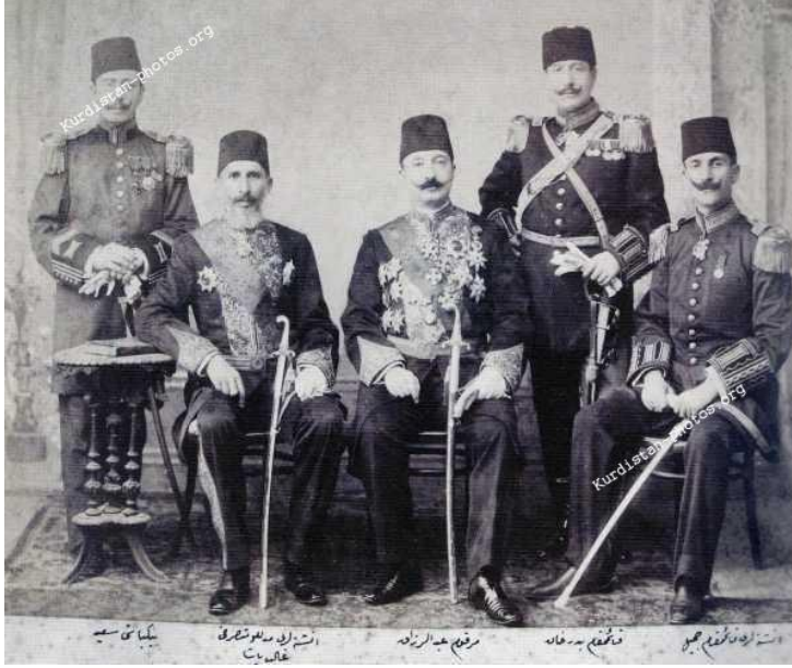
الامير عبد الرزاق بدرخان يجلس في الوسط مع بعض الامراء الكورد * * * * *

أسئلة تراودني وكل يوم اعيشها في يقظتي ومنامي لماذا يعيش الكوردي بلا أمل ليحكم نفسه بنفسه في وطنه كوردستان؟ لماذا يبقى ابن الفقير فقيرا وابن الغني غنيا وابن المسؤول مسؤولا؟ لماذا لا يتم تعيين أبناء الفقراء بأي وظيفة إلا بتقارير القبول من أمن الدولة وغيرهم يتم تعيينهم عند ولادتهم؟ لماذا يتم سجن وقتل كل معارض لأي نظام فاسد مستبد محتل، يصوره الاعلام ان المقتول والمسجون إرهابي ابن إرهابي؟ لماذا يتم إلغاء اللغة الكوردية واجبار أطفال الكورد في تعلم اللغة العربية والتركية والفارسية؟ لماذا يقوم البعض بإشعال الفتنة والإختلاف كلما حصل الشعب الكوردي على فرصة للحصول على حريته؟ لماذا يعتبرون الكوردي الذي خلقه الله كورديا بأنه سوري أو تركي أو عراقي أو إيراني؟ لماذا يصرخ الكوردي من ألم الظلم ولا يسمعه أحد؟