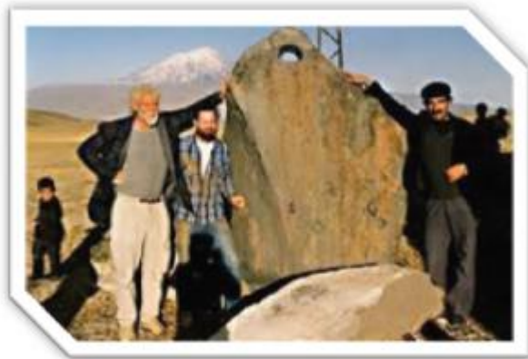
(۹) پاشماوه‌ی گه‌شتیی نوح