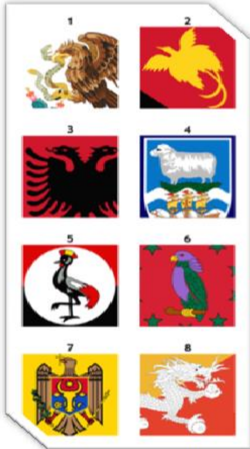
(۱۲) گماندار له سهر خاډا