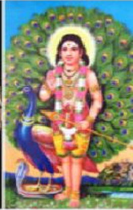
(۱۴) تاووس په رستى لای ( هیئتدوس و ئیزیدی )

Hindu God, Shiva , Subrahmanya's (Murug, vehicle is a peacock