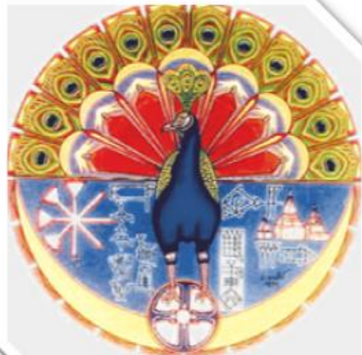
Tawuse Melek (Melek Taus), the Peacock Anjel