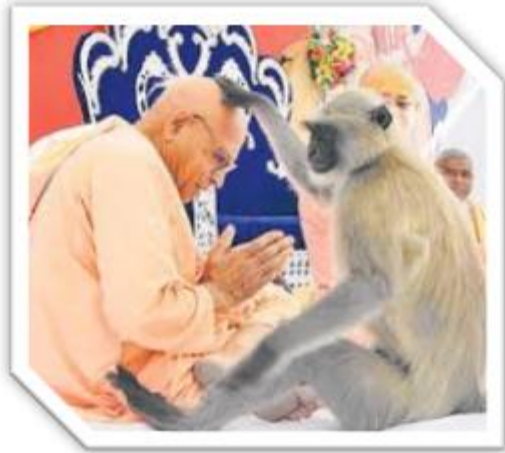
(٤) مہیہون پہرستی