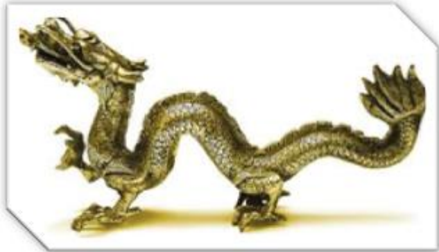
(۲) نهژدیهما په‌رستی