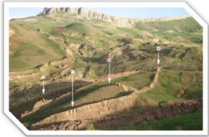
(۸) کینوی جودی