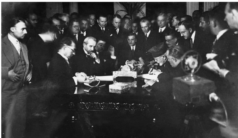
ئاماده‌کردنی پیماننامه‌ی لوزان له‌لایهن شاندى هیزه‌کانی هاوپه‌یمانان و تورکیا