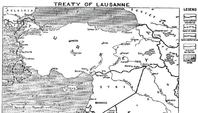
FIGURE 14 TURKEY IN 1923