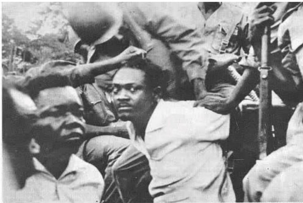
عکس تاریخی از پاتریس لومومبا پیش از مرگ

ولی کسی بنام ژیرار سوت Gerard Soete بعدها گفت: که او برای یادگاری دو دندان لومومبا را پیش خود نگه داشته و بعد دور انداخته، بیش از سه ماه قبل (که معلوم شد آن را دور نه انداخته) دندانها به کنگو بازگردانده شد و طی مراسمی تدفین شد.