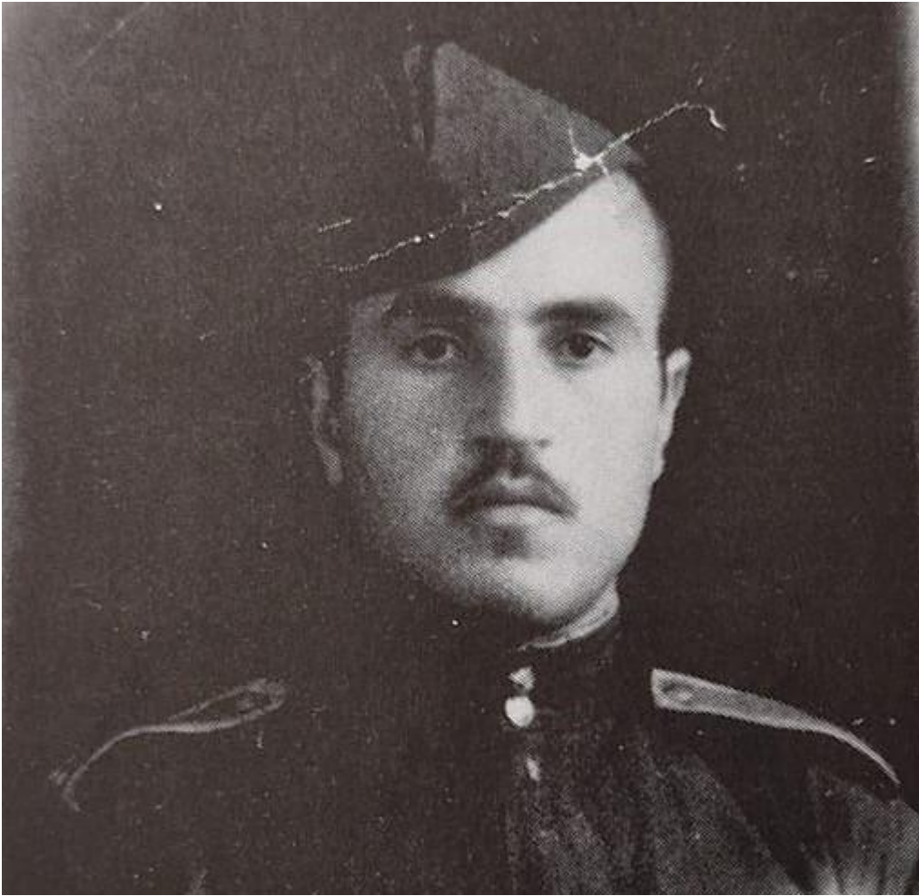
كاك غهني بلوريان له زانكوي ئه فسهرى باكۆ