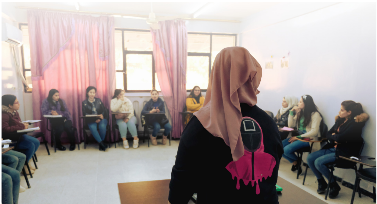
محاضرة علم المرأة (جينولوجي) في جامعة روج آفا في ربيع عام ٢٠٢٢

ما يقارب من ٢,٦٥٣ طالباً يدرسون في جامعات الإدارة الذاتية لشمال شرق سوريا، ولا يزال نظام التعليم العالي المحلي الناشئ في شمال شرق سوريا يتفوق عليه من قبل نظام الحكومة المركزية، على الأقل في أرقام الحضور، ففي مدينة الحسكة وحدها، يحضر أكثر من ٣٠ ألف طالب جامعة الفرات التي تديرها الحكومة، وفقاً لإدارة الفرات. وبحسب مركز روج آفا للدراسات الإستراتيجية أن هناك حوالي ٥٠,٠٠٠ طالب من شمال شرق سوريا مسجلين في كل من الجامعات العامة والخاصة. ومع ذلك، يتزايد التسجيل في جامعات الإدارة الذاتية في شمال شرق سوريا بشكل كبير عاماً بعد عام. كانت جامعة عفرين أول جامعة في شمال شرق سوريا، حيث كان عدد طلابها ٢٢٢ في عام ٢٠١٥ وارتفع إلى ١٢٠٠ قبل أن تضطر إلى الإغلاق بسبب غزو تركيا للمنطقة في عام ٢٠١٨، ونمت جامعة روج آفا بشكل مماثل من ٢٥٢ طالباً في البداية في عام ٢٠١٦ إلى ١٨٠٠ هذا العام، حيث تم قبول ٧٠٠ متقدم هذا العام، وفي الخريف الماضي تخرج ١٦٠ طالباً. نما عدد الطلاب في جامعة كوباني ثمانية أضعاف تقريباً من ٦٥ متواضعاً في عام ٢٠١٧ إلى ٤٩٨ للعام الدراسي ٢٠٢١/٢٠٢٢. تخرج ٣٢ طالباً آخر من جامعة كوباني في أكتوبر ٢٠٢١