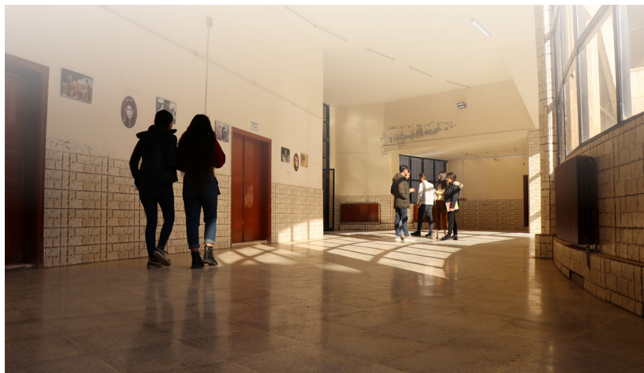
طلاب يمشون في أروقة جامعة روج آفا، ربيع 2022، قامشلي

يمكن أن يكون للمعرفة المنقولة إلى الطلاب تأثير حاسم وفوري على قدرة شمال شرق سوريا على تطوير مجتمعها واقتصادها من الداخل. ومع ذلك، فإن الدرجات الأخرى لن تستحق الورق الذي تطبع عليه دون اعتراف دولي. بالنسبة إلى الإدارة الذاتية لشمال شرق سوريا، أن بناء علاقات محددة وطويلة الأمد مع الجامعات الخارجية، من أجل اعتماد شهادات شمال شرق سوريا في الخارج، أمر في غاية الأهمية إذا كان للمشروع أن ينجح وقد تلقت الجامعات شمال شرق سوريا بالفعل الكثير من الاهتمام الدولي. من الأهمية بمكان أن يتحول هذا الدعم الصوتي إلى شيء ملموس