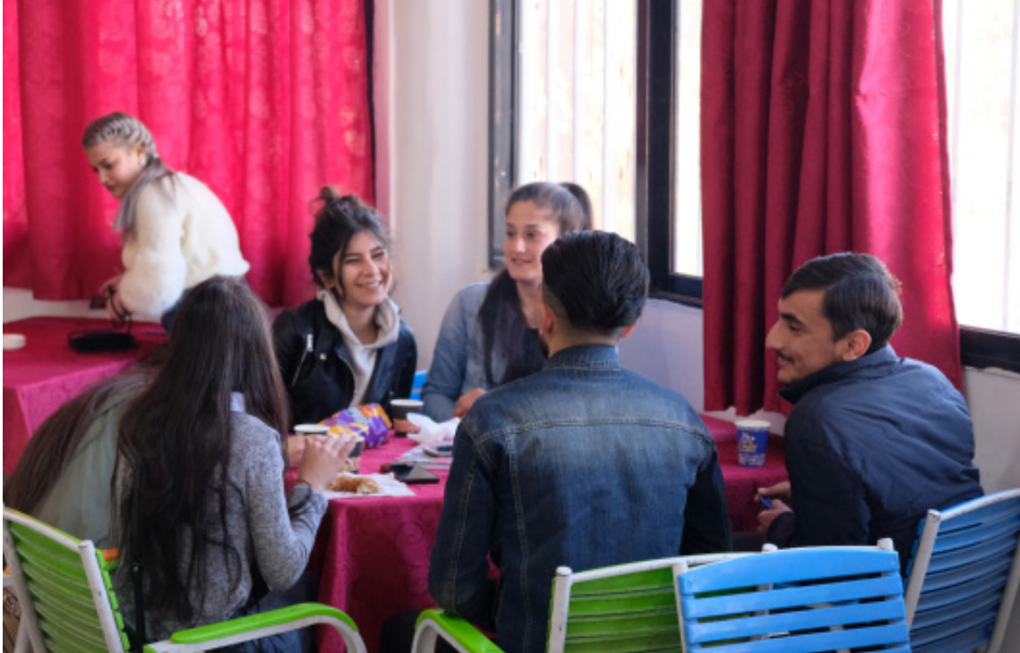
يستمتع الطلاب بالقهوة في كافيتريا جامعة روج آفا

جامعات شمال شرق سوريا مفتوحة لجميع الناس الذين يعيشون في مناطق شمال شرق سوريا يتعين على الطلاب الراغبين في التقدم من خلال قسم التعليم وسيتم دعوتهم لإجراء اختبار موحد بناءً على درجاتهم في الثانوية، والتي تحدد الأقسام الدراسية المفتوحة لهم. يمكن إجراء امتحان القبول - الذي يستمر حوالي 3 ساعات - في جميع جامعات الإدارة الذاتية، وأيضاً هناك مركز اختبار في الشهباء، والتي تقع في شمال حلب التابعة لإدارة الذاتية لشمال وشرق سوريا. الامتحان هو إما امتحان العلوم العامة أو امتحان العلوم الإنسانية، حسب اختيارات مقدم للطلب، ويتم تقديم أسئلة الامتحان باللغتين الكردية والعربية، ويتم النظر في الإجابات بأي من اللغتين. تحدد نتائج الاختبار ما إذا كان يتم قبول المتقدمين في الدورات التي يرغبون فيها، وبالنسبة للترجمة الإنجليزية، من الضروري إجراء اختبار إضافي لإجادة اللغة الإنجليزية. 1. بمجرد قبول الطالب في نظام جامعة شمال شرق سوريا، يمكنهم الاختيار بحرية أي من الجامعات الثلاث التي يرغبون في الدراسة فيها يتم توفير السكن الطلابي في قامشلو وكوباني والرققة مجاناً لجميع الطلاب. في قامشلو يوجد حوالي ستة مباني سكن للطلاب في جميع أنحاء المدينة، وأكثرهم للطالبات. في كل سكن يتشارك 3-8 طلاب غرف النوم ويشكلون "الكومين"، والتي يتعين عليهم أداء مهام جماعية معينة، مثل تنظيف وغيرها، ويتم توفير المواصلات من وإلى الأقسام الدراسية من قبل الجامعة مجاناً