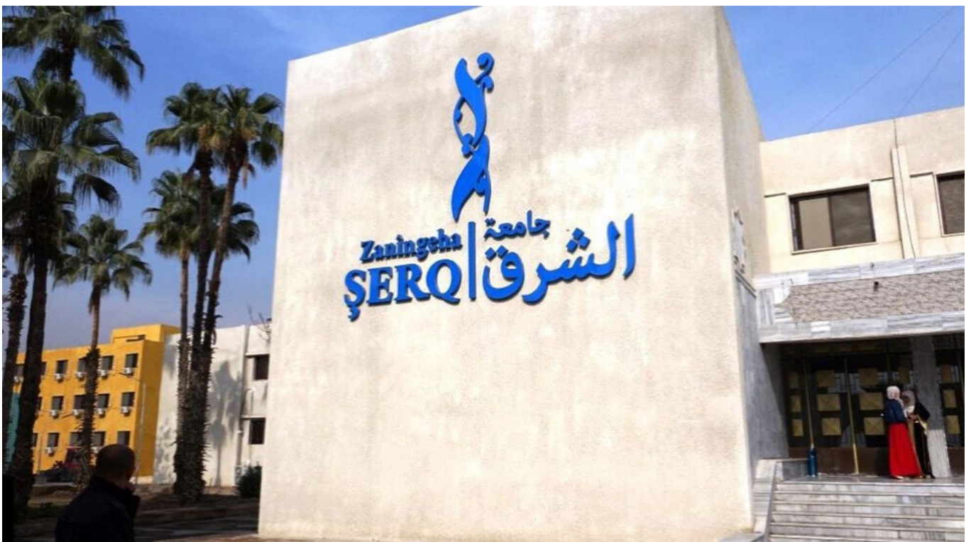
مدخل جامعة الشرق في الرقة، يظهر سكن الطلاب في خلفية الجامعة

نقطة الخلاف الرئيسية هي أجور الأساتذة، والتي يجب أن تظل مرتفعة من أجل جذب مهنيي التعليم العالي والمؤهلين. هذا صحيح بشكل خاص في الرقة، حيث يكون اختيار إلقاء محاضرة في جامعات الحكومة السورية أو الجامعات الخاصة الأخرى أكثر إغراءً بسبب القرب الجغرافي واللغوي من بقية سوريا، وتدفع جامعة الشرق، التي تقدم أعلى رواتب بين الجامعات الثلاث، للأساتذة (بالدولار) 200 دولار (أو حوالي 800 ألف ليرة سورية اعتباراً من يوليو 2022) في المتوسط شهرياً. ” يقول الدكتور حسن لـ لمرکزنا، ” يجب أن يتم توظيفهم بشكل خاص“ مقابل مبلغ يصل إلى 1,000,000 ليرة سورية (أو 250 دولاراً أمريكياً) بالإضافة إلى نفقات السكن. يمكن أن تكون هذه الأجور مغرية في منطقة يبلغ فيها متوسط راتب موظف الخدمة المدنية 300 ألف ليرة سورية (75 دولاراً أمريكياً) ونحو نصف ذلك في مناطق حكومة سورية ومع ذلك، تقول إدارات الجامعات إنها بحاجة إلى مزيد من التمويل من الإدارة الذاتية لشمال شرق سوريا، ويقول الدكتور حسن من جامعة الشرق ” نريد أساتذة جيدين يأتون ويدرسون؛ بعضهم يأتون من أماكن بعيدة