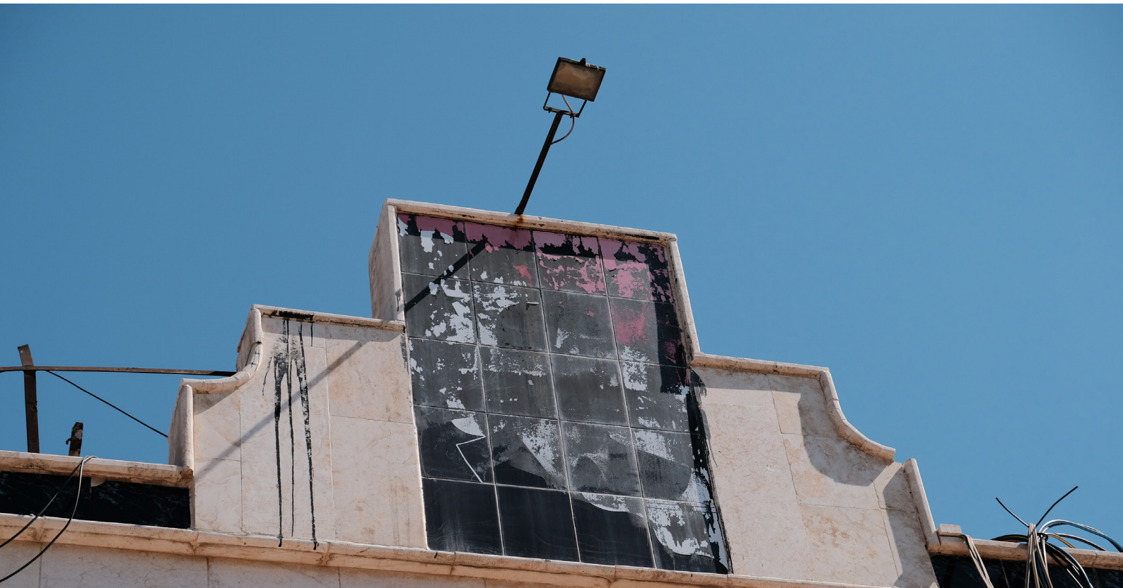
صورة للرئيس بشار الأسد تمت إزالتها فوق حرم جامعة روج آفا القامشلي، في السابق كان المبنى معهد زراعي للحكومة السورية

لهذا السبب، لا تركز جامعة روج آفا على الخبرة العلمية فحسب، بل تركز أيضاً على الجوانب الفلسفية للتعليم كجزء أساسي من جودته الأكاديمية، على سبيل المثال لا يتم إعطاء أي تفضيل أو تمييز للطلاب بسبب عرقهم أو لغتهم الأم أو معتقدتهم الديني، "بينما يحق لكل طالب الدراسة بلغته المفضلة". في الوقت الحالي، يمكن للطلاب في جامعة روج آفا الدراسة باللغة العربية والكردية، حسب تفضيلاتهم، و"الأبواب مفتوحة للأصدقاء الآشوريين إذا أرادوا فتح قسم للغة والأدب"، وفقاً لإدارة الجامعة مثل باقي مجتمع شمال شرق سوريا، يتم تنظيم الجامعة من خلال المجالس واللجان، كما توجد مجالس نسائية مستقلة إلى جانب مجالس الطلاب وممثلي الطلاب من كل قسم، الذين يجلسون في المجالس جنباً إلى جنب مع الأساتذة، وتقول كولستان سيدو، مسؤولة العلاقات الخارجية بجامعة روجافا، خلال تصريحها لمركز معلومات روج آفا في عام 2020: "نعتقد أنه من الضروري إعطاء أهمية لدور [الطلاب] في عملية صنع القرار"