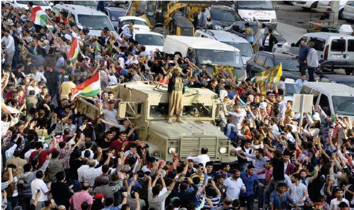
پیشواوی ئاپۆرای هاوڵاتیانی باکووری کوردستان (تورکیا) له هێزی پیشمه‌رگه‌ی کوردستان