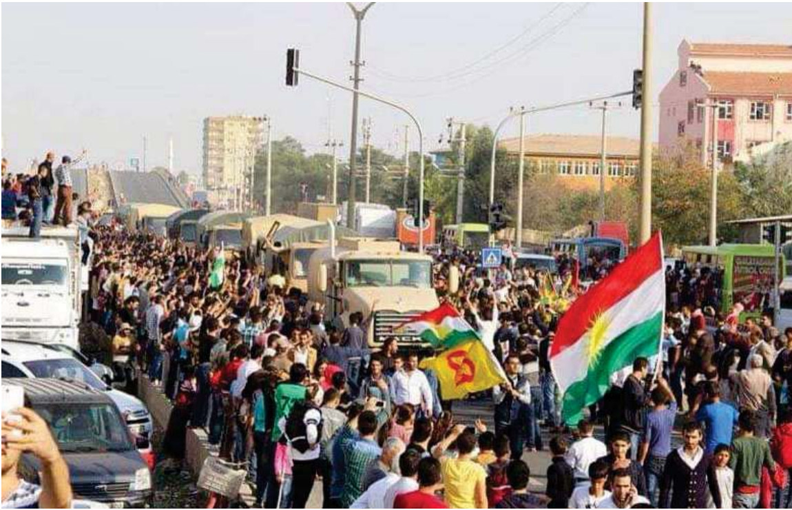
پیشواوی ئاپۆرای هاوڵاتیانی باکووری کوردستان (تورکیا) له هیزی پیشمه‌رگه‌ی کوردستان