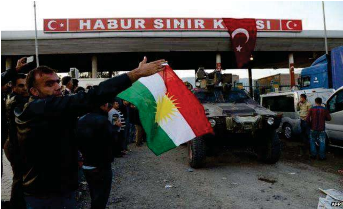
پەڕینهووی هیژی پێشمەرگە ی کوردستان لە سنووری ولاتی تورکیا