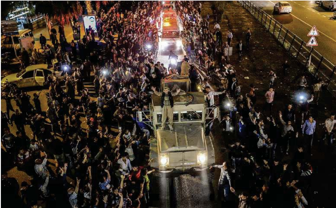
پیشواوی ئاپۆرای هاوڵاتیانی باکووری کوردستان (تورکیا) له هێزی پیشمه‌رگه‌ی کوردستان