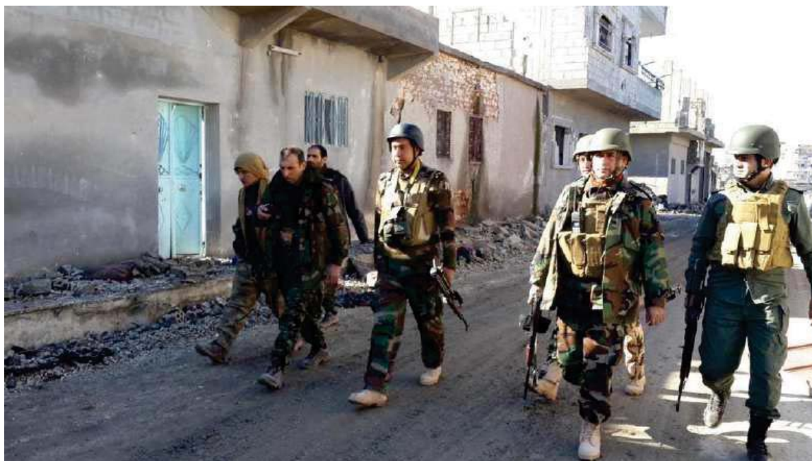
به‌رگری و به‌رخودانی هی‌زی پیشمه‌رگه‌ی کوردستان له کۆبانن