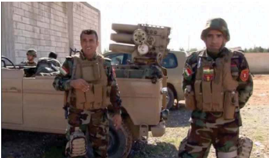
به‌رگری و به‌رخودانی هیژی پێشمه‌رگه‌ی کوردستان له کۆبانێ