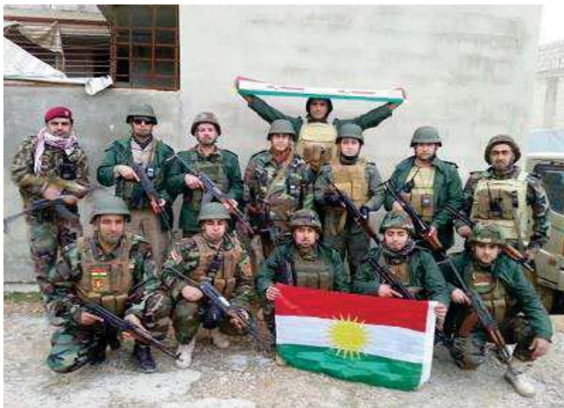
هيژى پيشمه رگه ي كوردستان دواى نازادكردنى شارى كو بانى