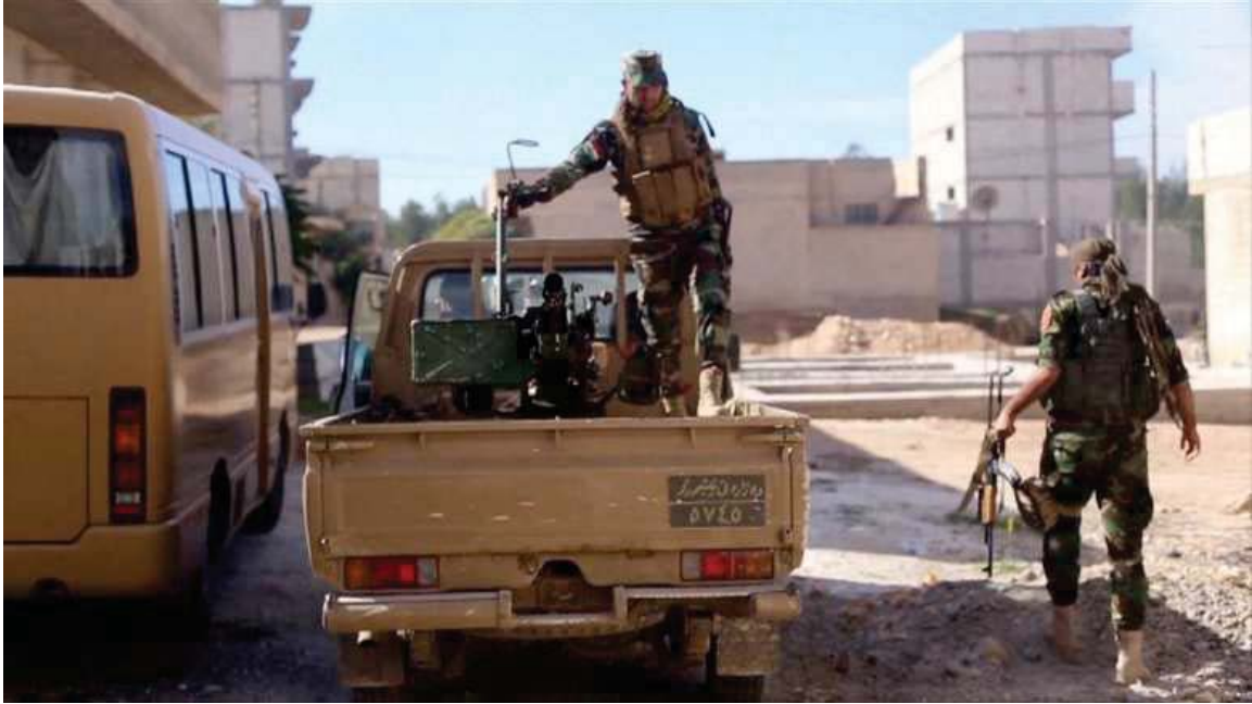
هیزی پیشمه رگه ی کوردستان دوای نازادکردنی شاری كوۆبانی