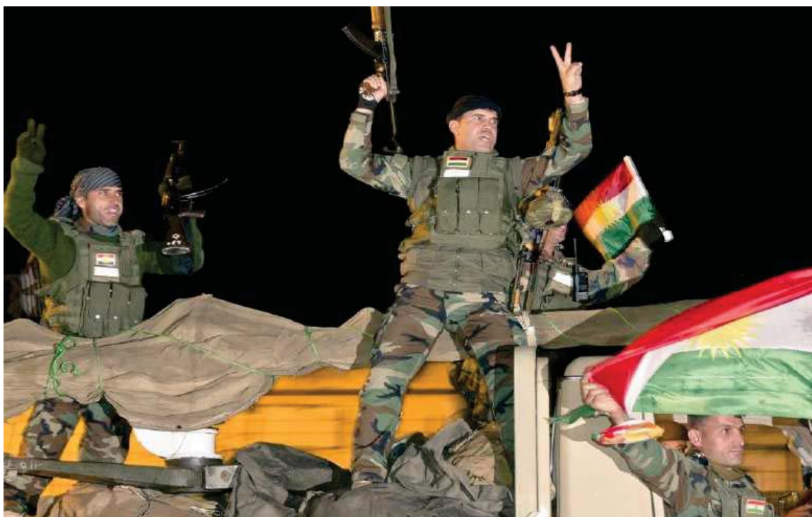
پیشواوی هاوڵاتیانی باکووری کوردستان (تورکیا) له هیزی پیشمه‌رگه‌ی کوردستان