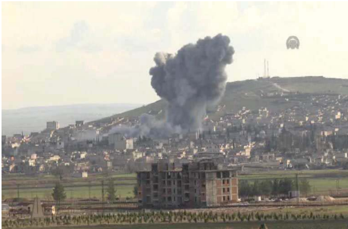
بۆردومانى شارى كۆبانى