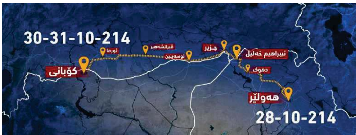
پێره‌وی هیزی پێشمه‌رگه‌ی کوردستان له‌ هه‌ولێره‌وه‌ تا کوبانی وه‌رگیراو له‌ تۆری هه‌والی (پووداو)