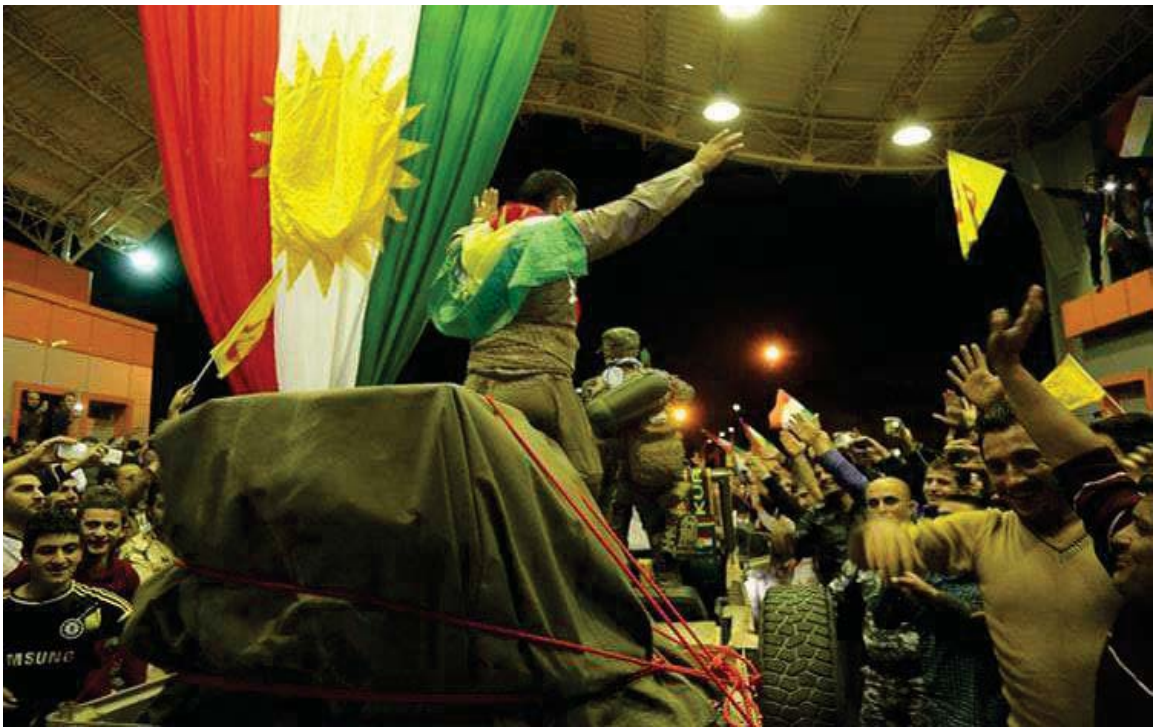
پیشواوی ئاپۆرای هاوڵاتیانی باکووری کوردستان (تورکیا) له هی‌زی پیشمه‌رگی کوردستان