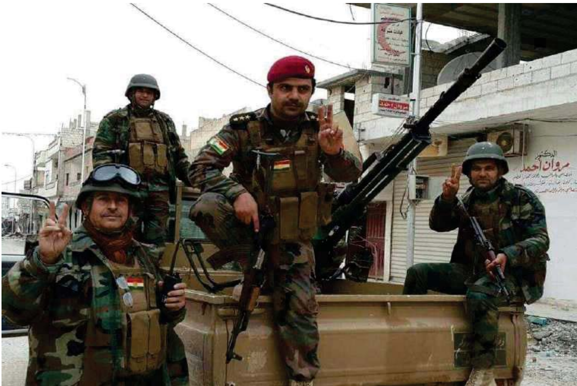
بهرگری و بهرخودانی هیزی پیشمه‌رگه‌ی کوردستان له کۆبانێ