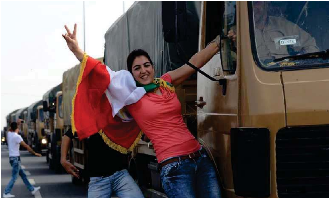
پیشواوی هاوڵاتیانی باکووری کوردستان (تورکیا) له هیزی پیشمه‌رگه‌ی کوردستان