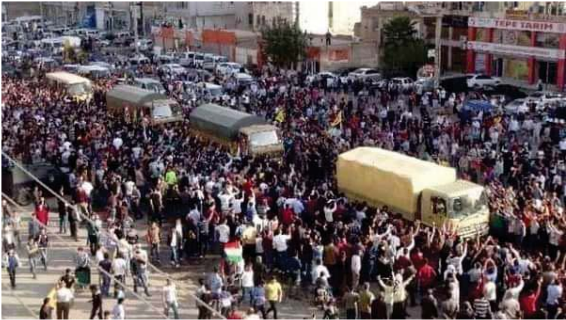
پیشواوی ئاپۆرای هاوڵاتیانی باکووری کوردستان (تورکیا) له هێزی پیشمه‌رگه‌ی کوردستان