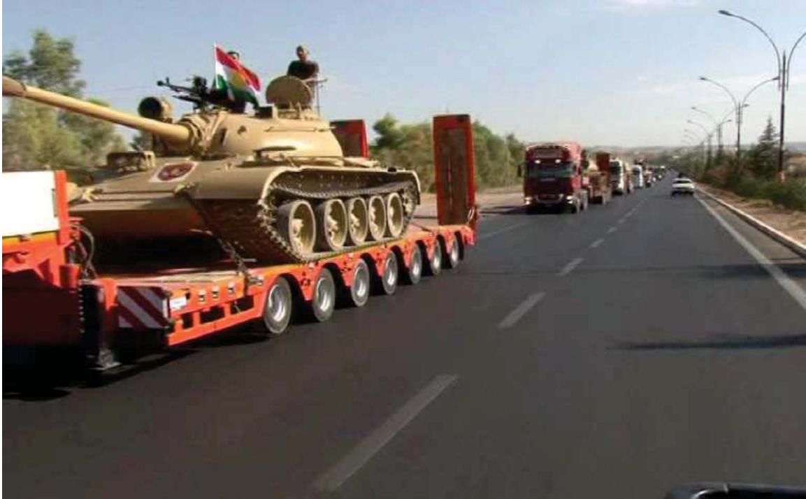
به‌رێکه‌وتنی هیژی پێشمه‌رگه‌ی کوردستان به‌ره‌و کۆبانێ