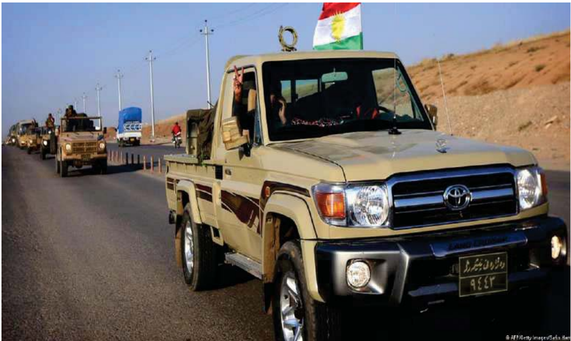
به‌رێکه‌وتنی هیژی پێشمه‌رگه‌ی کوردستان به‌ره‌و کۆبانێ