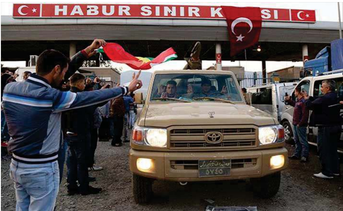
پەڕینهووی هیژی پێشمەرگە ی کوردستان لە سنووری ولاتی تورکیا