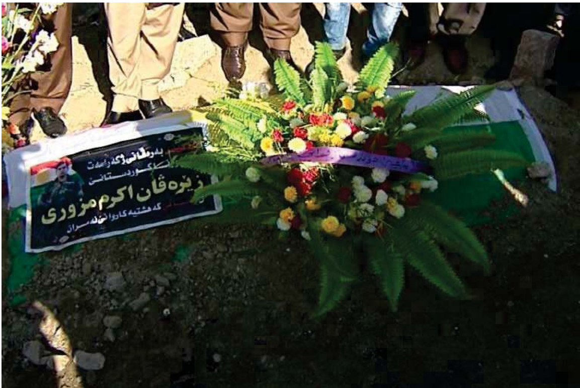
ئارامگه ی شه هید زینره قان نه کره م مزووری، یه که م شه هیدی پیشمه رگه له شه ری نازادکردنی كوۆبانی