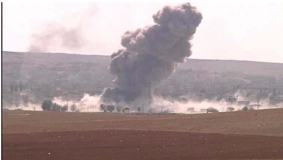
بۆردومانى شارى كۆبانى