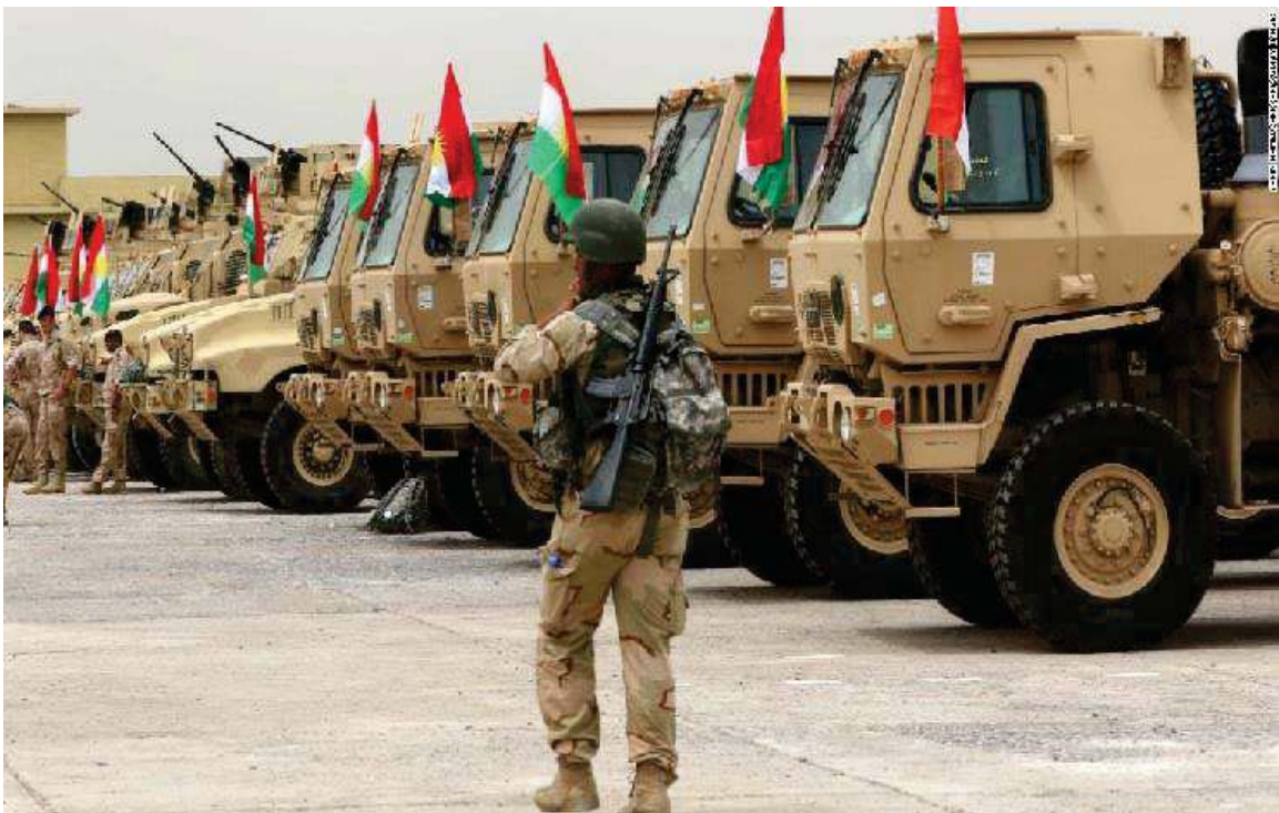
ئامادەکاری هێزی پێشمەرگە ی کوردستان، پێش بەرێکەوتن بەرەو کۆبانێ