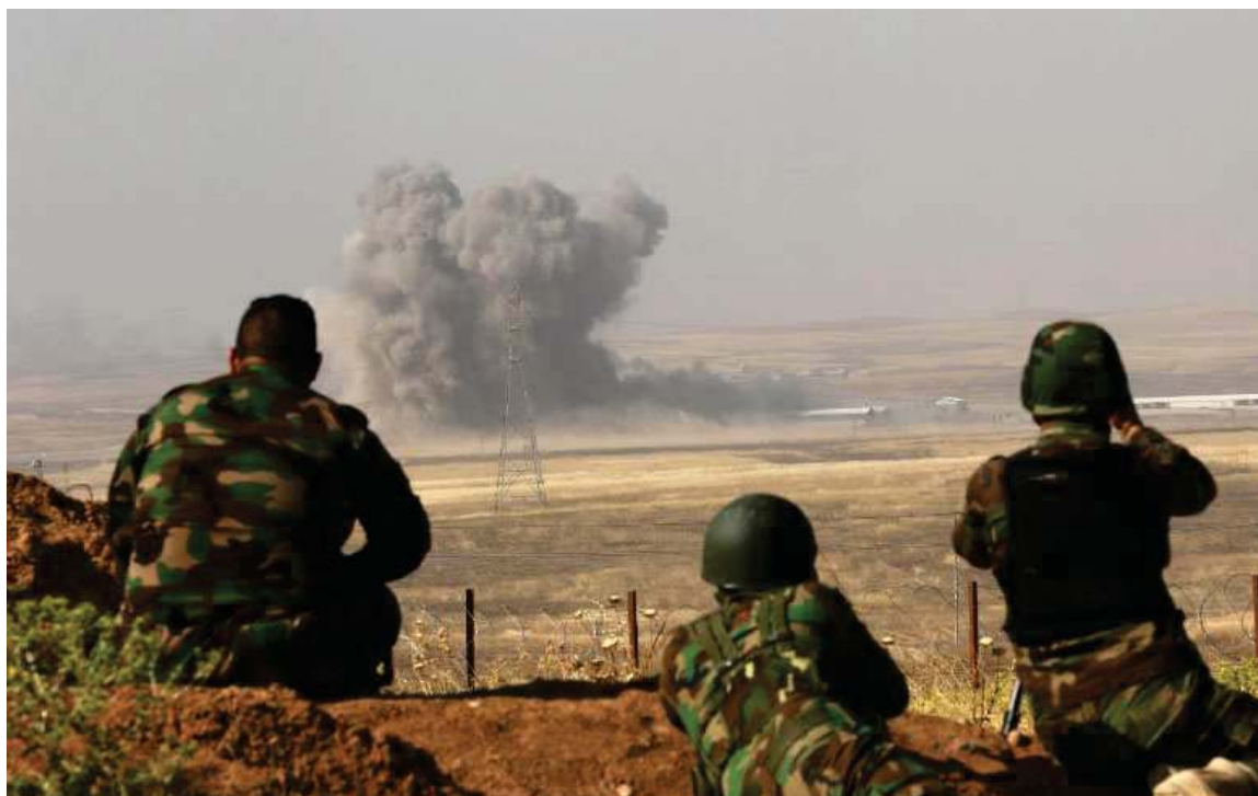
به‌رگری و به‌رخودانی هی‌زی پیشمه‌رگه‌ی کوردستان له کۆبانن