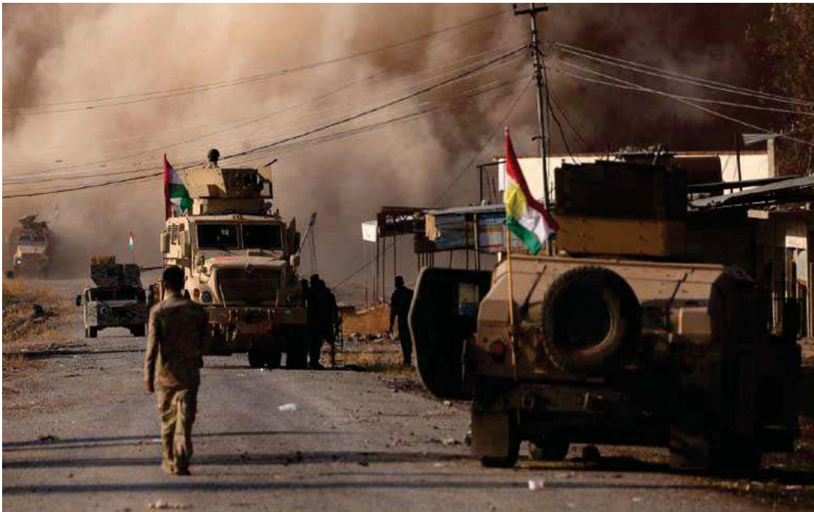
بهرگری و بهرخودانی هیزی پیشمه‌رگه‌ی کوردستان له کۆبانئ