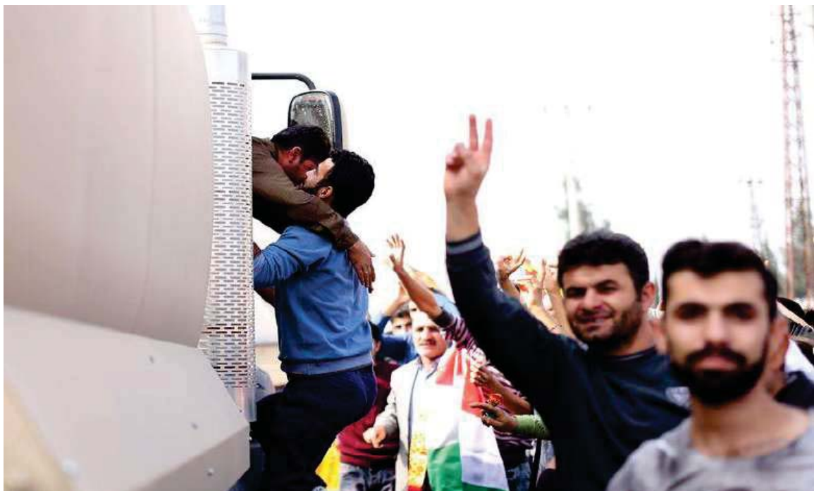
پیشواوی هاوڵاتیانی باکووری کوردستان (تورکیا) له هیزی پیشمه‌رگه‌ی کوردستان