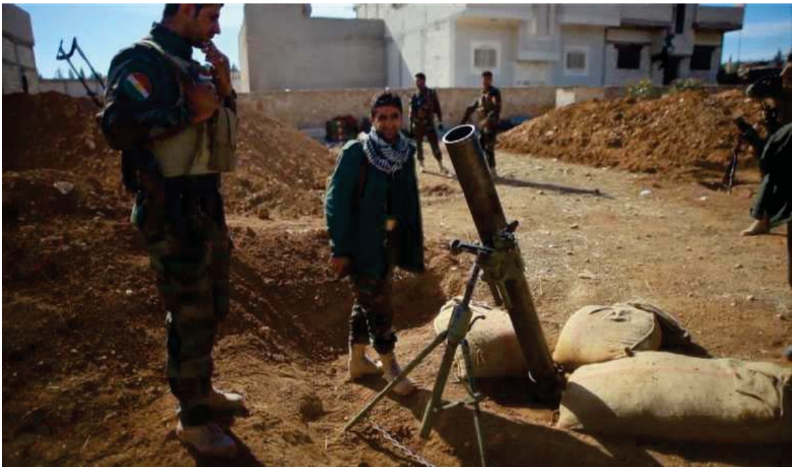
بەرگرى و بەرخودانى ھىزى پېشمەرگەى كوردستان لە كۆبانى