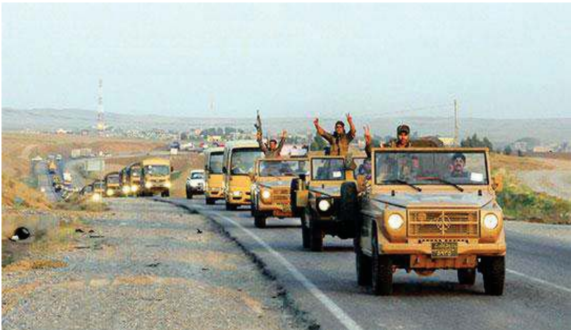
پێکردنی هیزی پێشمه‌رگه‌ی کوردستان به‌نیو خاکی وڵاتی تورکیادا