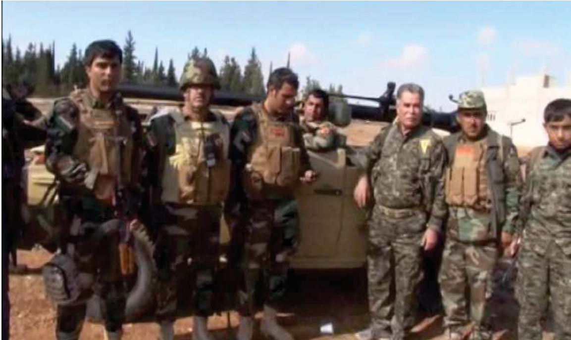
بەرگرى و بەرخودانى ھىزى پېشمەرگەى كوردستان لە كۆبانى