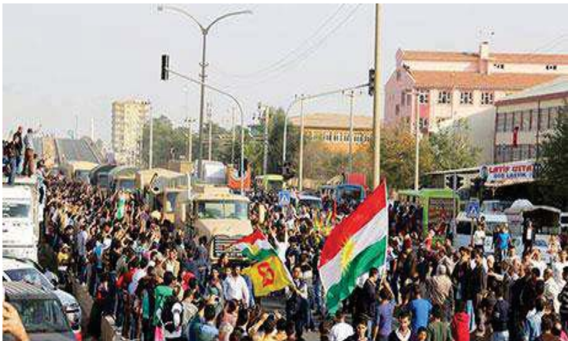
پیشواوی ئاپۆرای هاوڵاتیانی باکووری کوردستان (تورکیا) له هیژی پیشمه‌رگه‌ی کوردستان