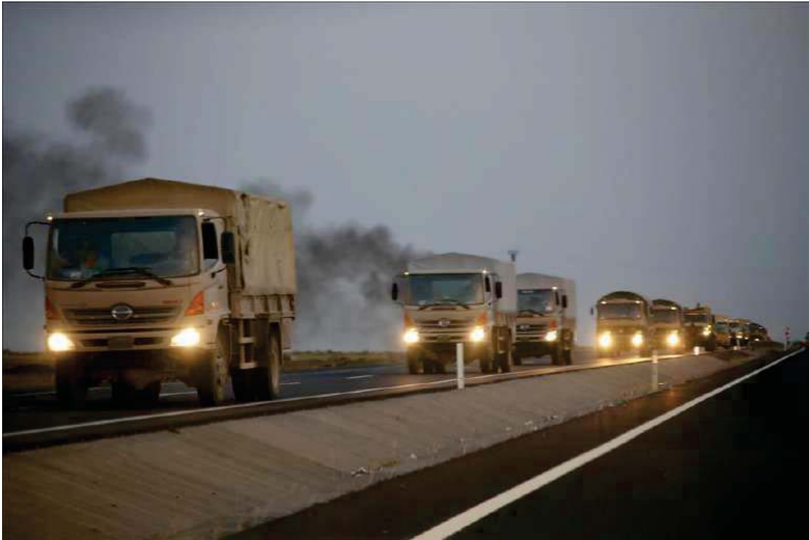
پێکردنی هیزی پێشمه‌رگه‌ی کوردستان به‌نیو خاکی وڵاتی تورکیادا