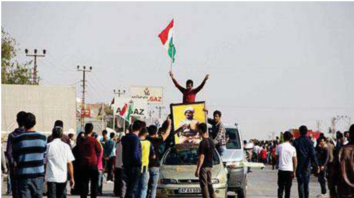
پیشواوی ئاپۆرای هاوڵاتیانی باکووری کوردستان (تورکیا) له هێزی پیشمه‌رگه‌ی کوردستان