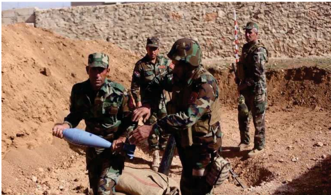
به‌رگری و به‌رخودانی هیژی پیشمه‌رگه‌ی کوردستان له‌ کۆبانئ