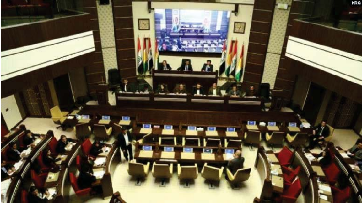
کۆبونهوهی رێکهوتی ۲۲ی تشرینی یهکهمی ۲۰۱۴ی په‌رله‌مانی کوردستان