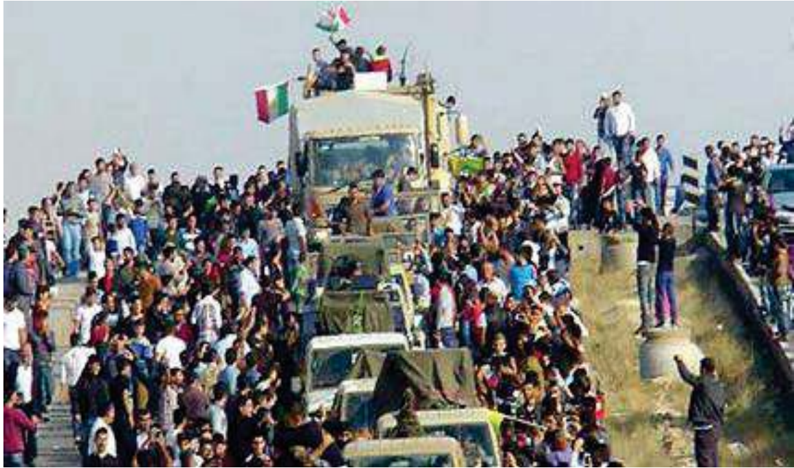
پیشواوی ئاپۆرای هاوڵاتیانی باکووری کوردستان (تورکیا) له هیژی پیشمه‌رگه‌ی کوردستان