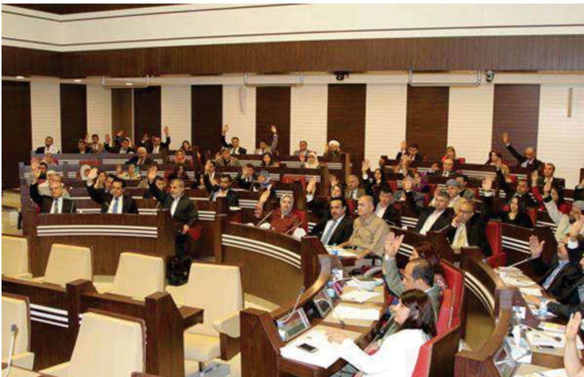
په‌سه‌ندکردنی بریاری ناردنی هیزی پێشمه‌رگه‌ی هه‌ریمی کوردستان بۆ کۆبانێ