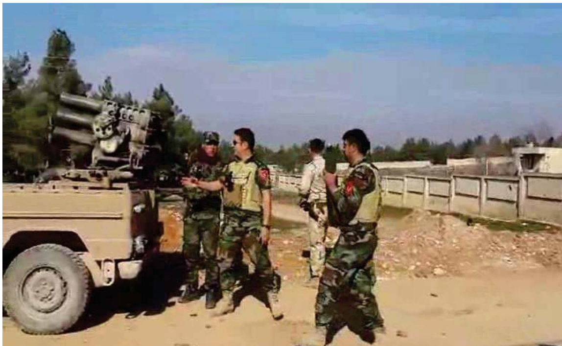
به‌رگری و به‌رخودانی هیژی پێشمه‌رگه‌ی کوردستان له کۆبانێ