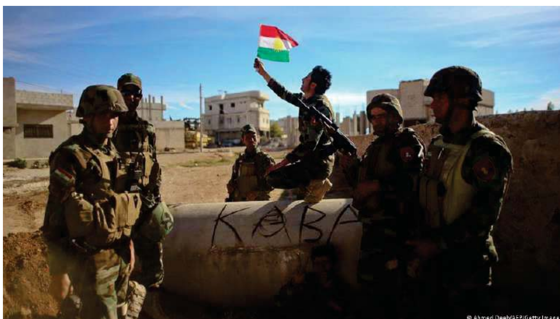
هيژى پيشمه رگه ي كوردستان دواى نازادكردنى شارى كو بانى