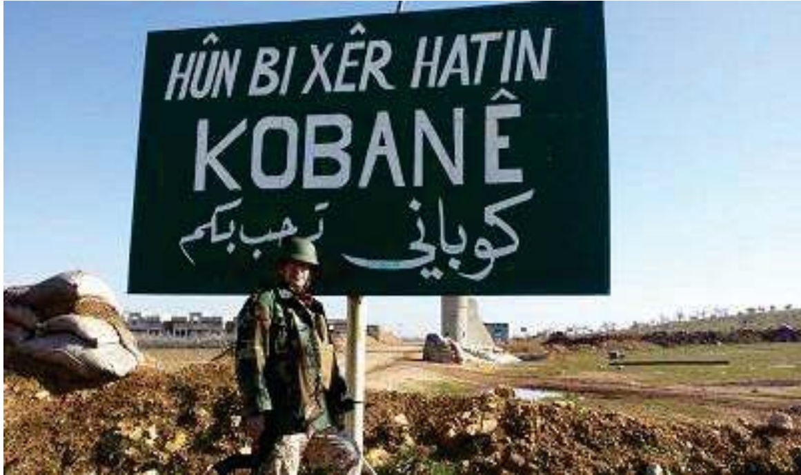
گه‌یشتنی هیزی پێشمه‌رگه‌ی کوردستان به‌ ده‌روازه‌ی شاری کوبانی کوردستانی پوژئاوا (سوریا)