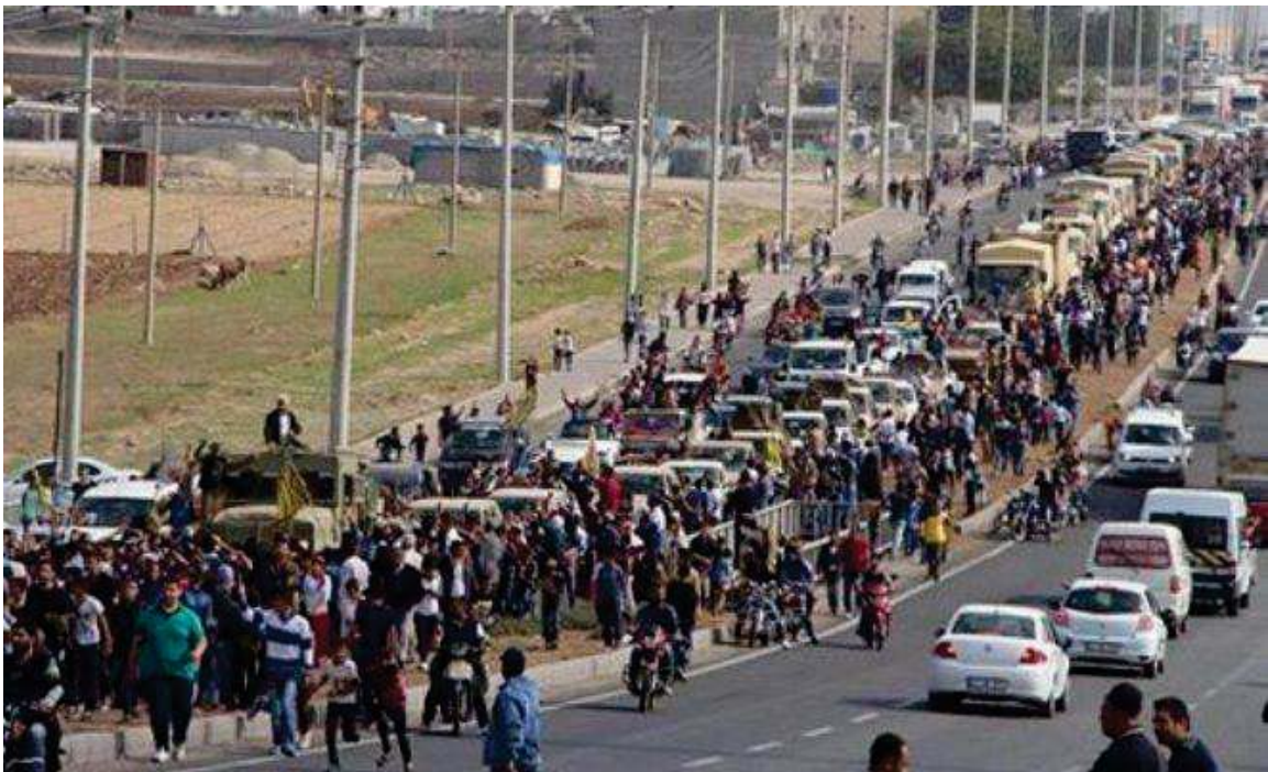
پیشواوی ئاپۆرای هاوڵاتیانی باکووری کوردستان (تورکیا) له هێزی پیشمه‌رگه‌ی کوردستان