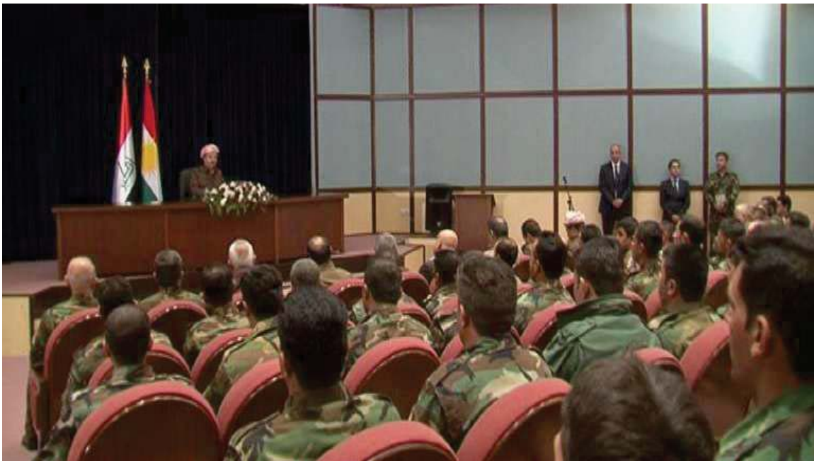
ديدار و پيشوازي سهروك مهسعود بارزاني، سهروكي ههريمي كوردستان، له هيژى پيشمهركه كوردستان، دواي گهپانهوهيان له شهري نازادكردى كوبانى