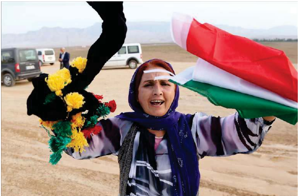
هاولاتیانی باکووری کوردستان (تورکیا) له چاوهروانی پیشوازی هیژی پیشمه‌رگه‌ی کوردستان