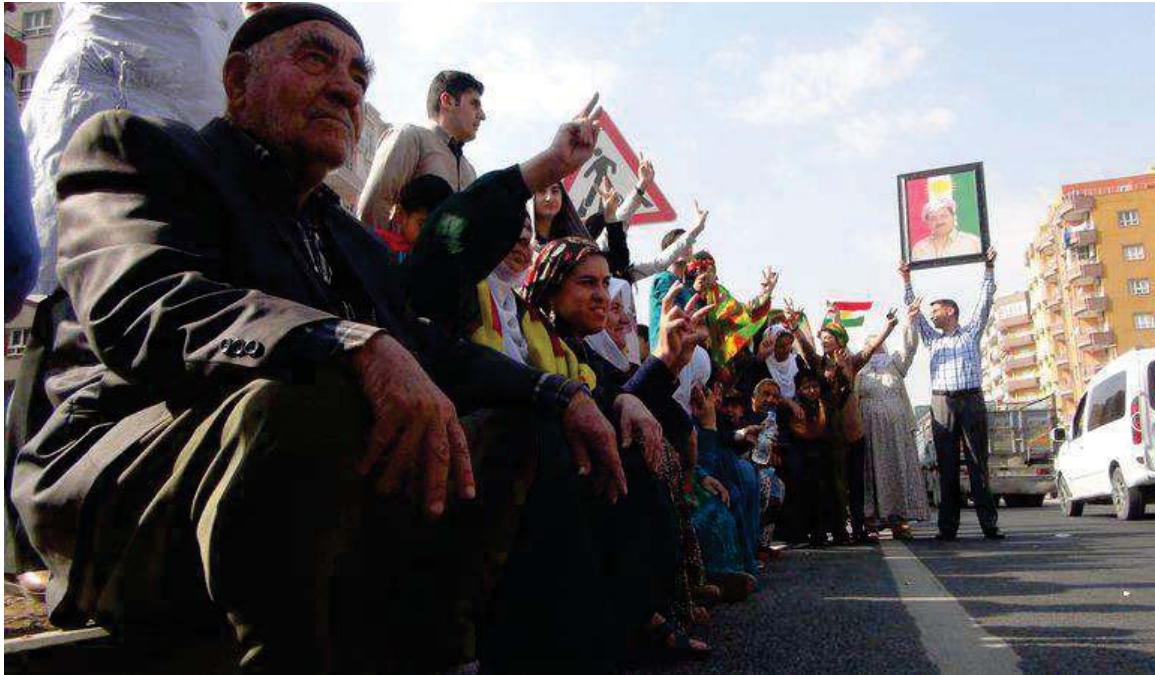
هاولاتیانی باکووری کوردستان (تورکیا) له چاوهروانی پیشوازی هیژی پیشمه‌رگه‌ی کوردستان