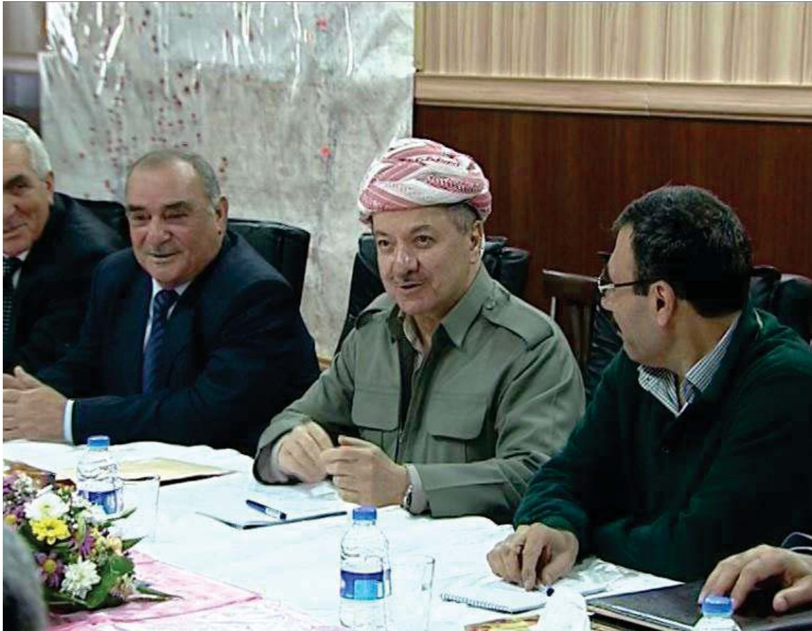
كۆبوونەوہى سەرۆك مەسعود بارزانى-سەرۆكى ھەرئىمى كوردستان و حزبە كوردىيەكانى سورىا لە بارەى ناردنى ھىزى پىشمەرگەى كوردستان بۆ كۆبانى