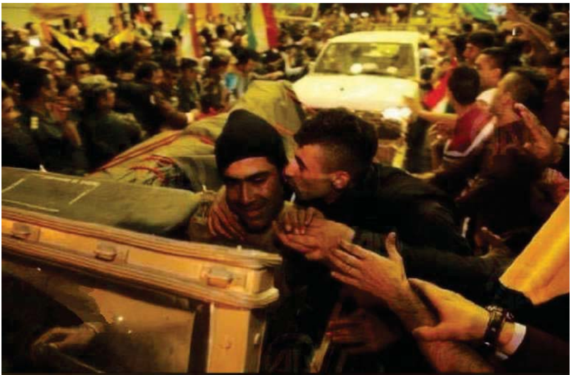
پیشواوی ئاپۆرای هاوڵاتیانی باکووری کوردستان (تورکیا) له هی‌زی پیشمه‌رگی کوردستان