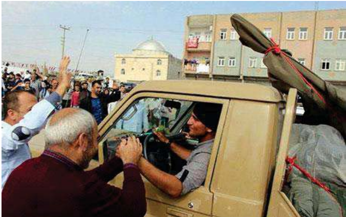
پیشواوی هاوڵاتیانی باکووری کوردستان (تورکیا) له هیزی پیشمه‌رگه‌ی کوردستان