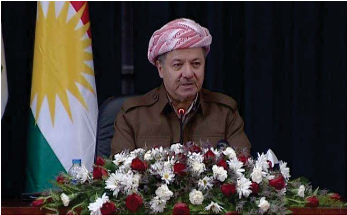
ديدار و پيشوازي سهروك مهسعود بارزاني، سهروكي ههريمي كوردستان، له هيژى پيشمهركه كوردستان، دواي گهپانهوهيان له شهري نازادكردى كوبانى