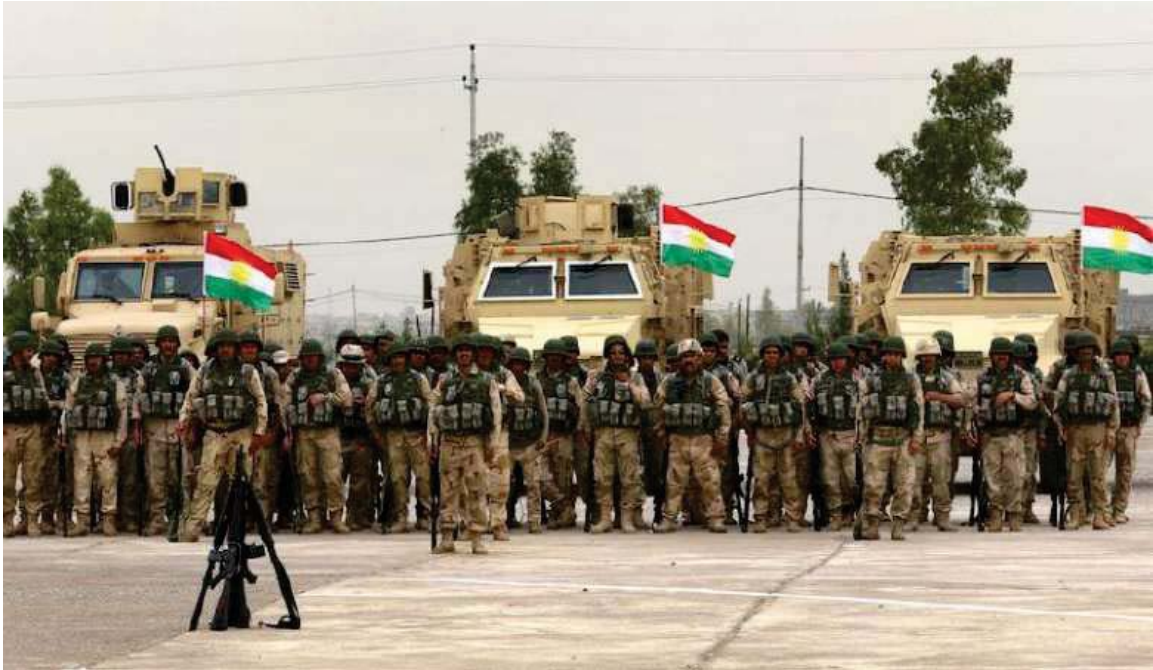
ئامادەکاری هێزی پێشمەرگە ی کوردستان، پێش بەرێکەوتن بەرەو کۆبانێ