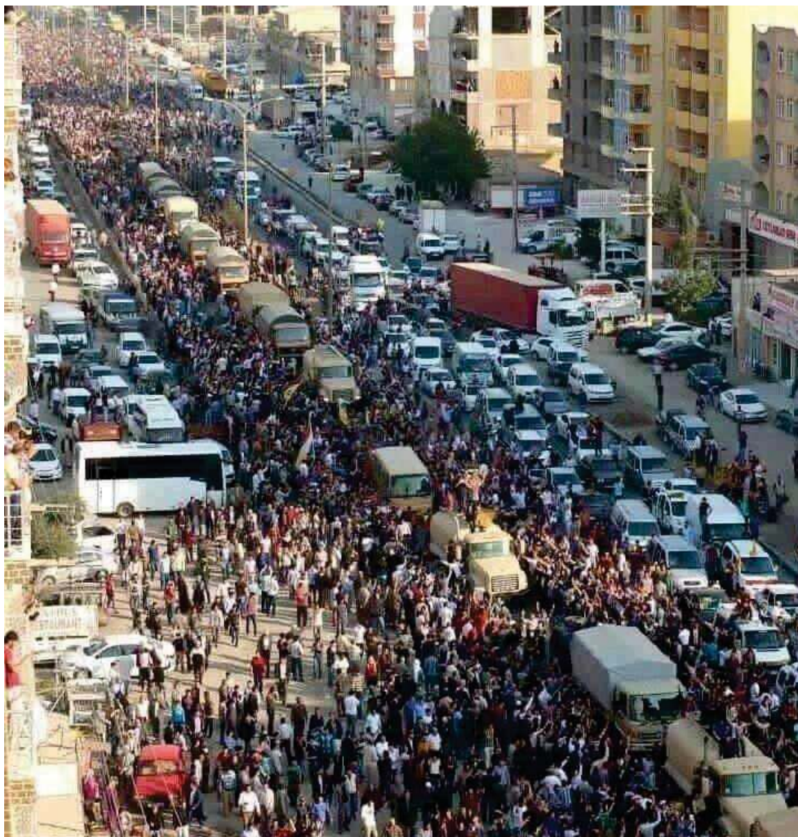
پیشواوی ئاپۆرای هاوڵاتیانی باکووری کوردستان (تورکیا) له هیڤزی پیشمه‌رگه‌ی کوردستان