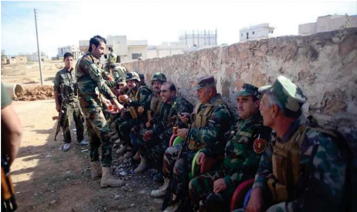
بهرگری و بهرخودانی هیزی پیشمه‌رگه‌ی کوردستان له کۆبانێ