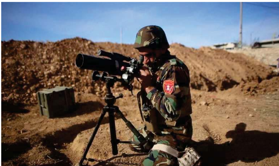
به‌رگری و به‌رخودانی هیژی پیشمه‌رگه‌ی کوردستان له‌ کۆبانئ