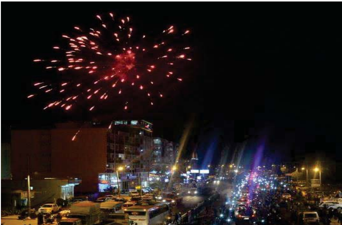
پیشواوی ئاپۆرای هاوڵاتیانی باکووری کوردستان (تورکیا) له هێزی پیشمه‌رگه‌ی کوردستان