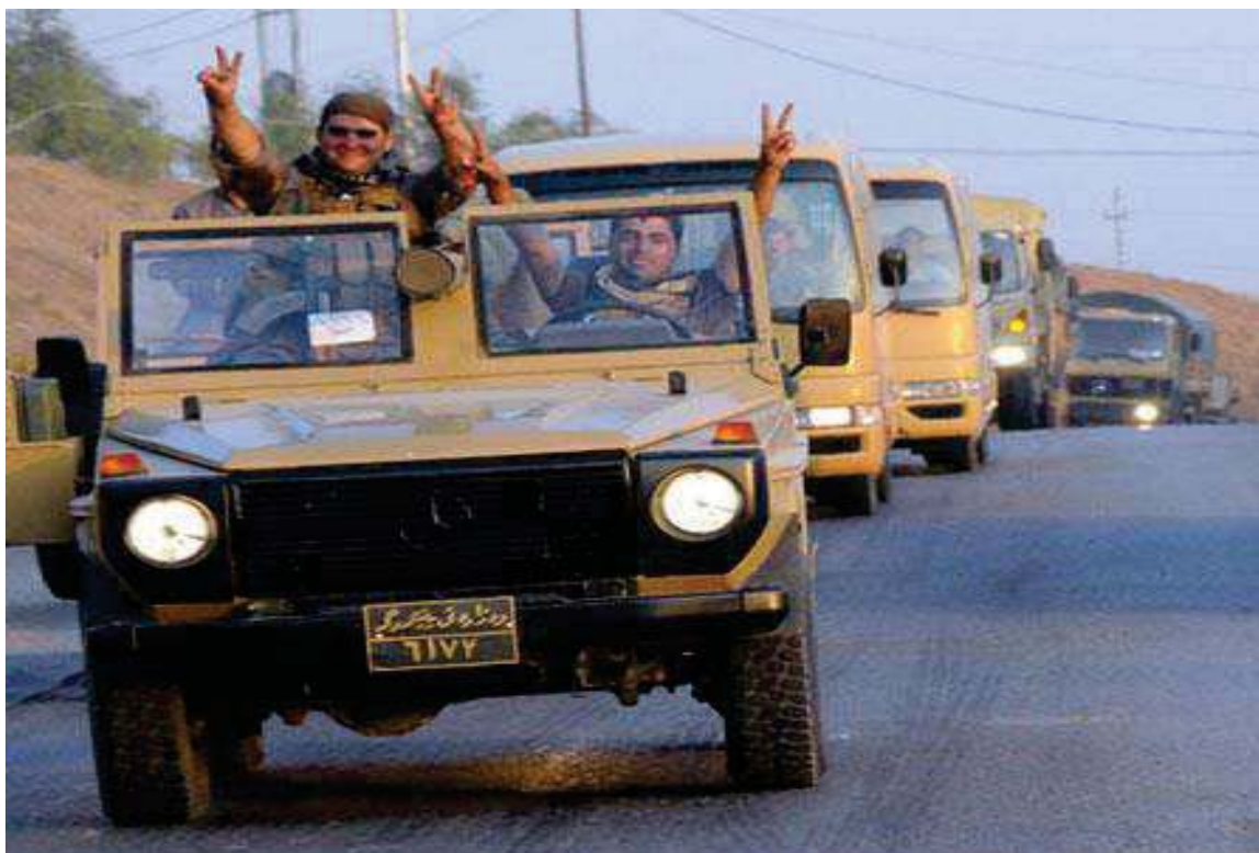
پیشواوی هاوڵاتیانی باکووری کوردستان (تورکیا) له هیزی پیشمه‌رگه‌ی کوردستان