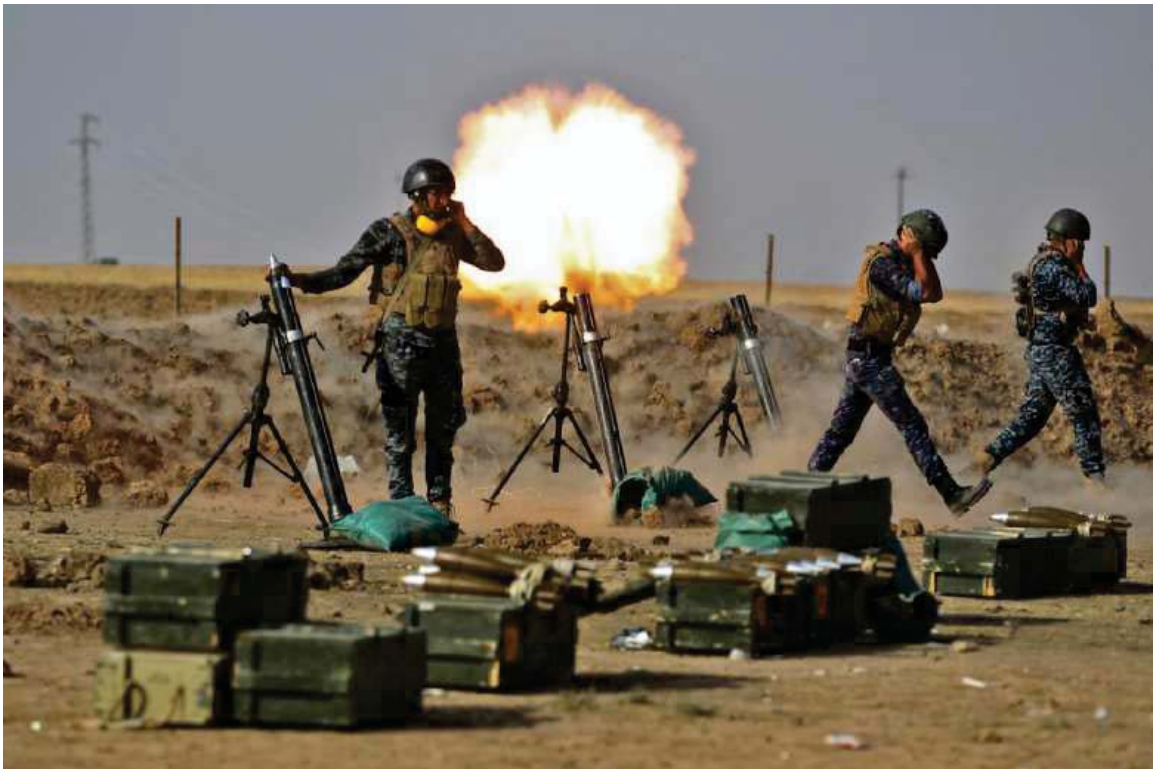
بهرگری و بهرخودانی هیزی پیشمه‌رگه‌ی کوردستان له کۆبانئ