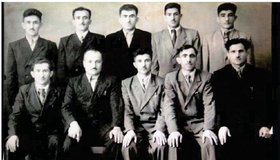
به‌شیک له هه‌فالانی بارزانی نه‌مر له سوڤیه‌تی جارانی له‌کاتی خویندندا