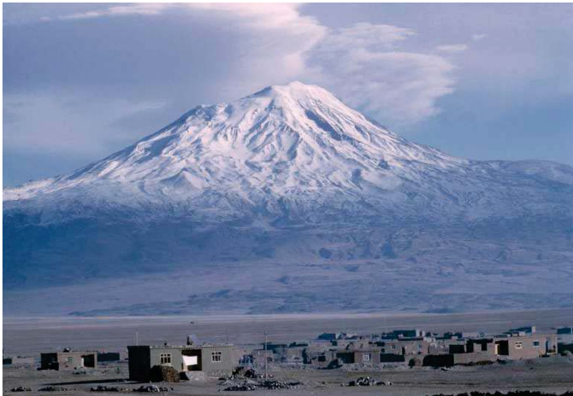
چیا ی ئارارات