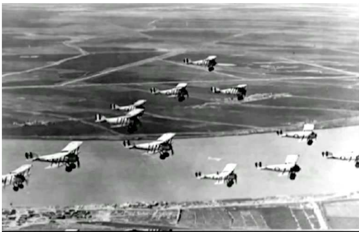
هێرشێ فرۆکەیی به‌ریتانی بۆ سه‌ر بارزان ۱۹۳۲