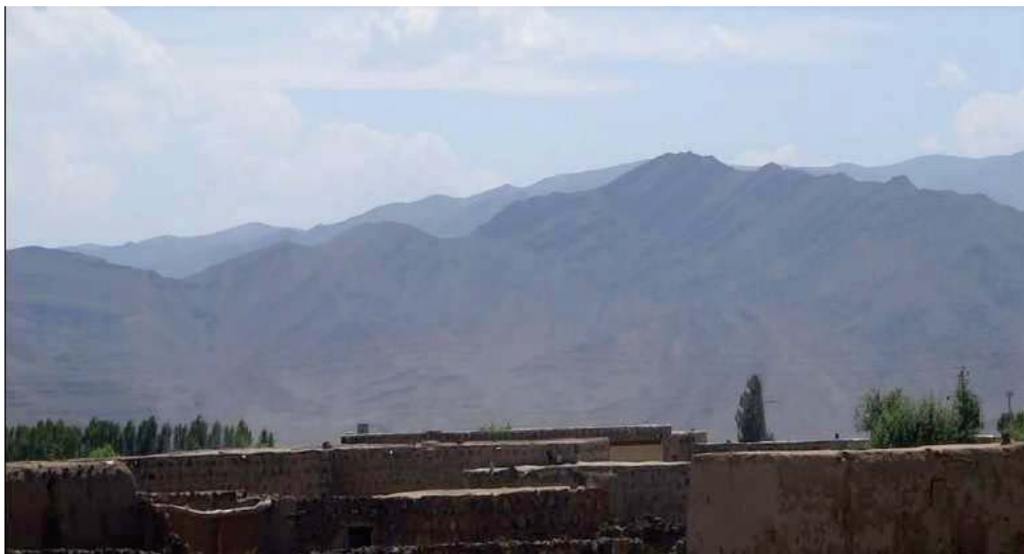
ئهو گوندهی سهر لیواری پروباری ئاراس که بارزانی نهر پیدایا تیپه ری بو یه کیتی سوڤیه تی جاران