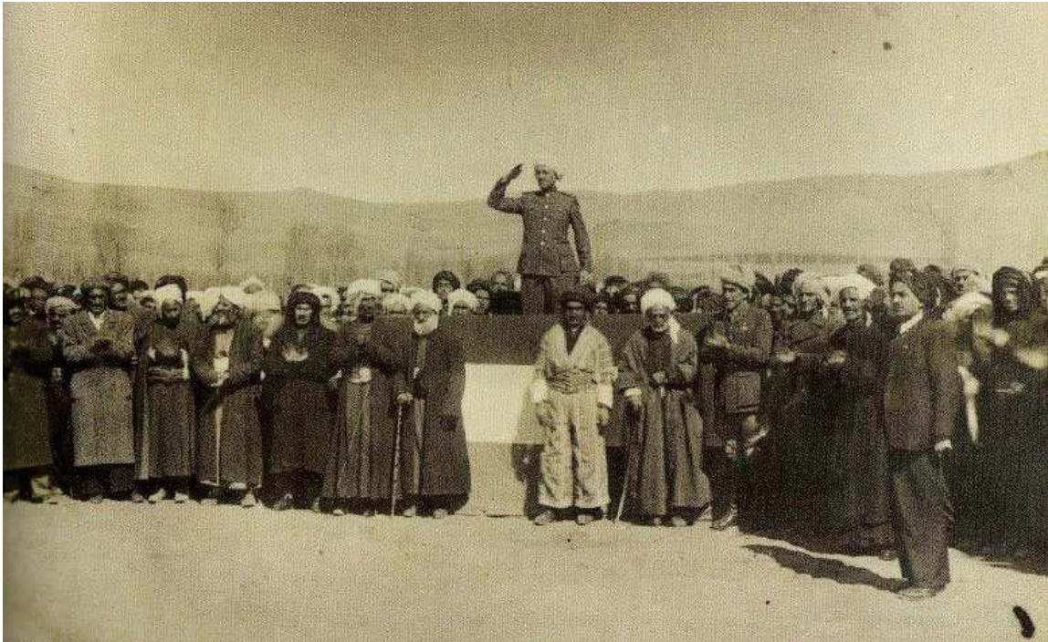
پوژی راگه یانددنی کوماری کوردستان له مهاباد