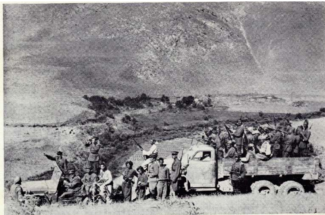
له شکرى بارزان له کۆمارى کوردستان ۱۹۴۶