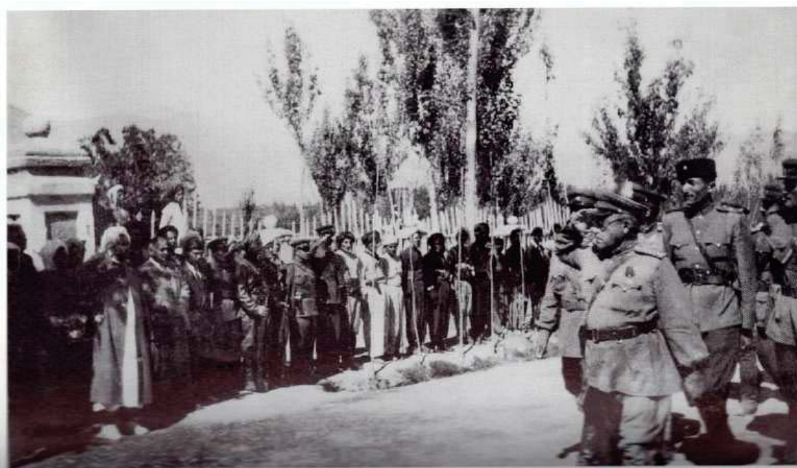
رئوپه‌سمى پژهى پيشمه‌رگه له به‌رده‌م پيشه‌وا قازى ۱۹۴۶