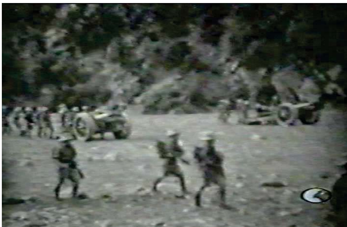
هێرشى سوپای ئینگلیز و سوپای عێراق و بۆردومانی گوندی بارزان ١٩٣٢