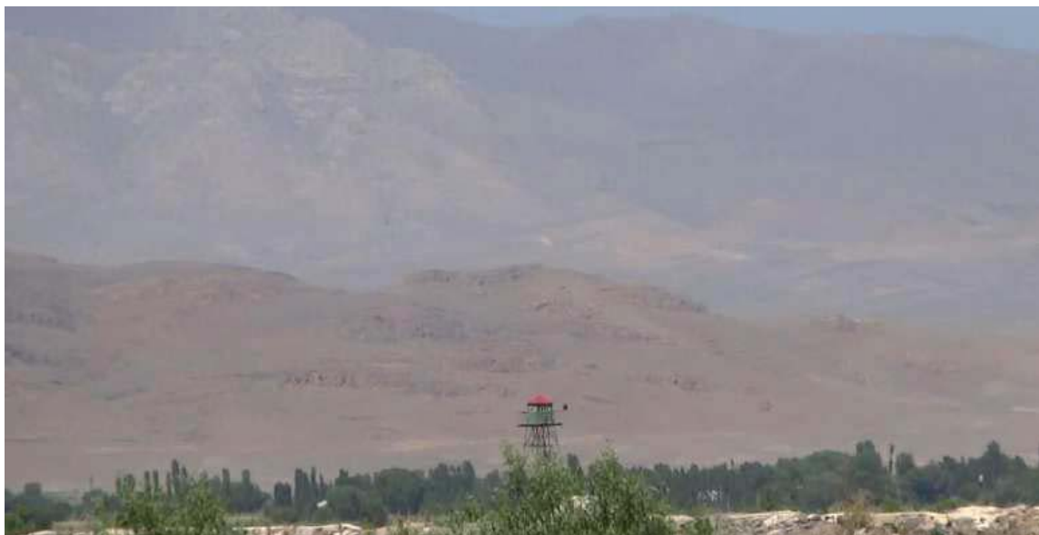
تاوه ری پاسه وانی سووپای سوڤیه ت تا کو ته پرۆش له شوینی خوئی ماوه