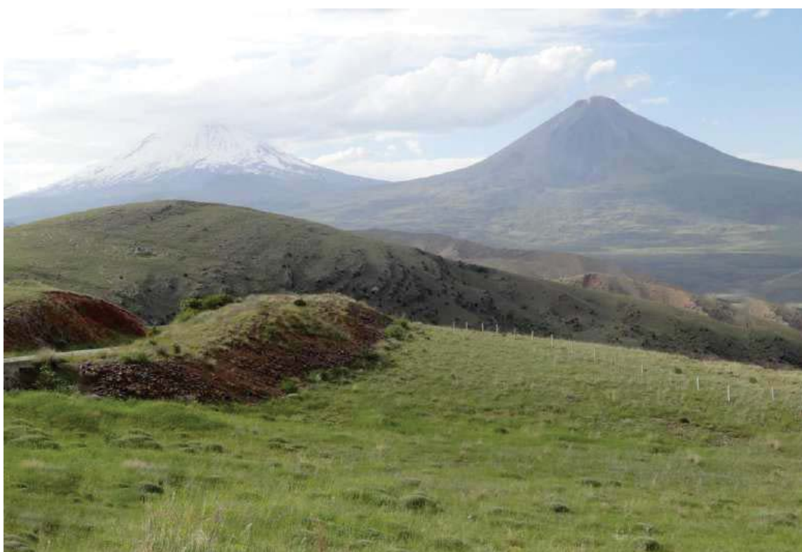
ریگای دهشتی هاسوون