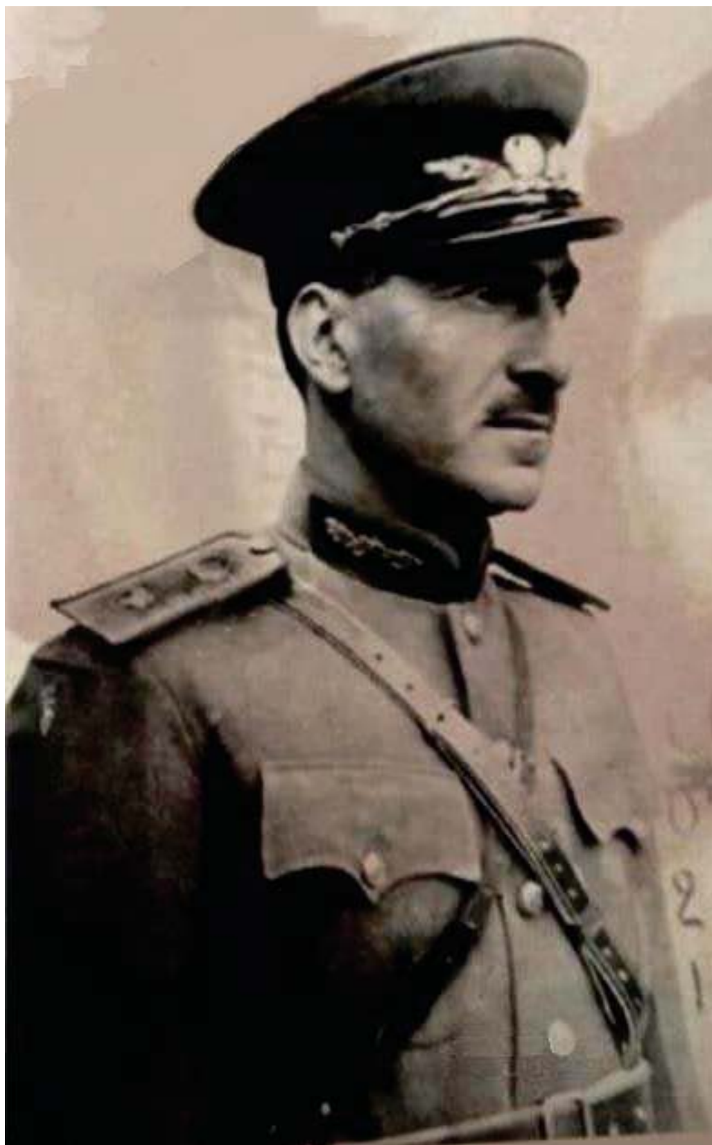
جهنه پال بارزانی