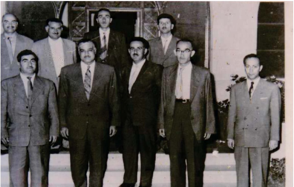
بارزانی نه مر و جه مال عه بدولناسر - قاهره ۱۹۵۸

ریزی پیشه وه (بارزانی نه مر - جه مال عه بدولناسر - نوری ئه حمده تها - صالح به گ میران - پراویژکاریکی عه بدولناسر)