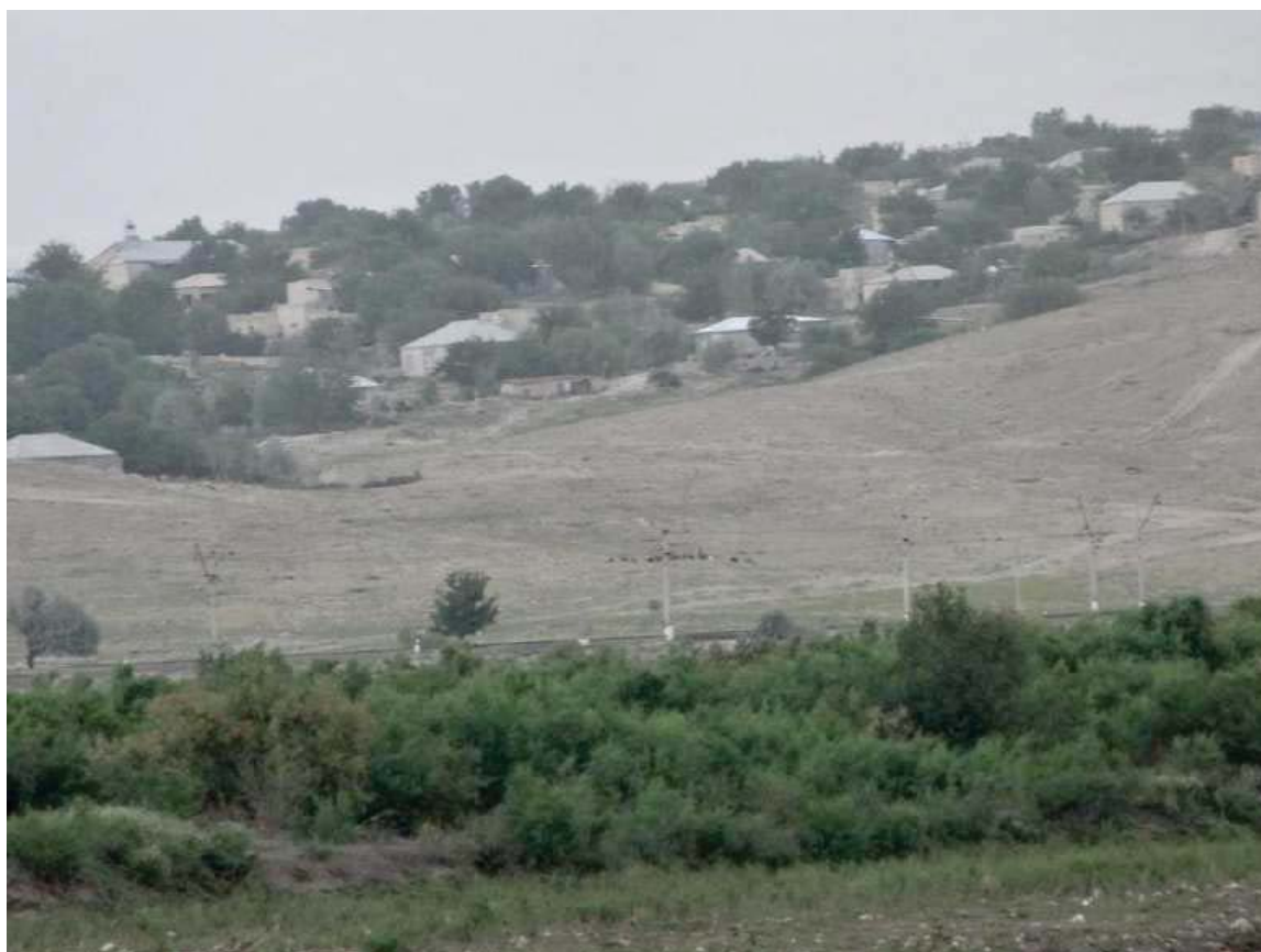
نه خچه وان