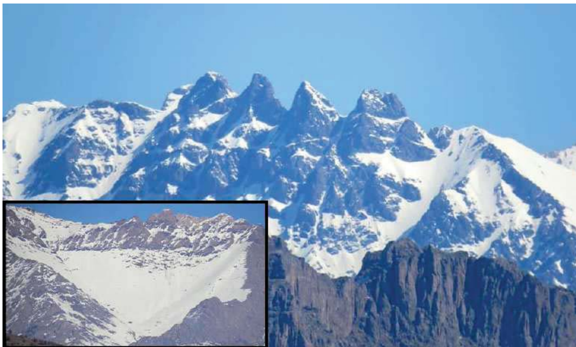
ته‌شتی بیداو و چوارچه‌لی هه رکیان