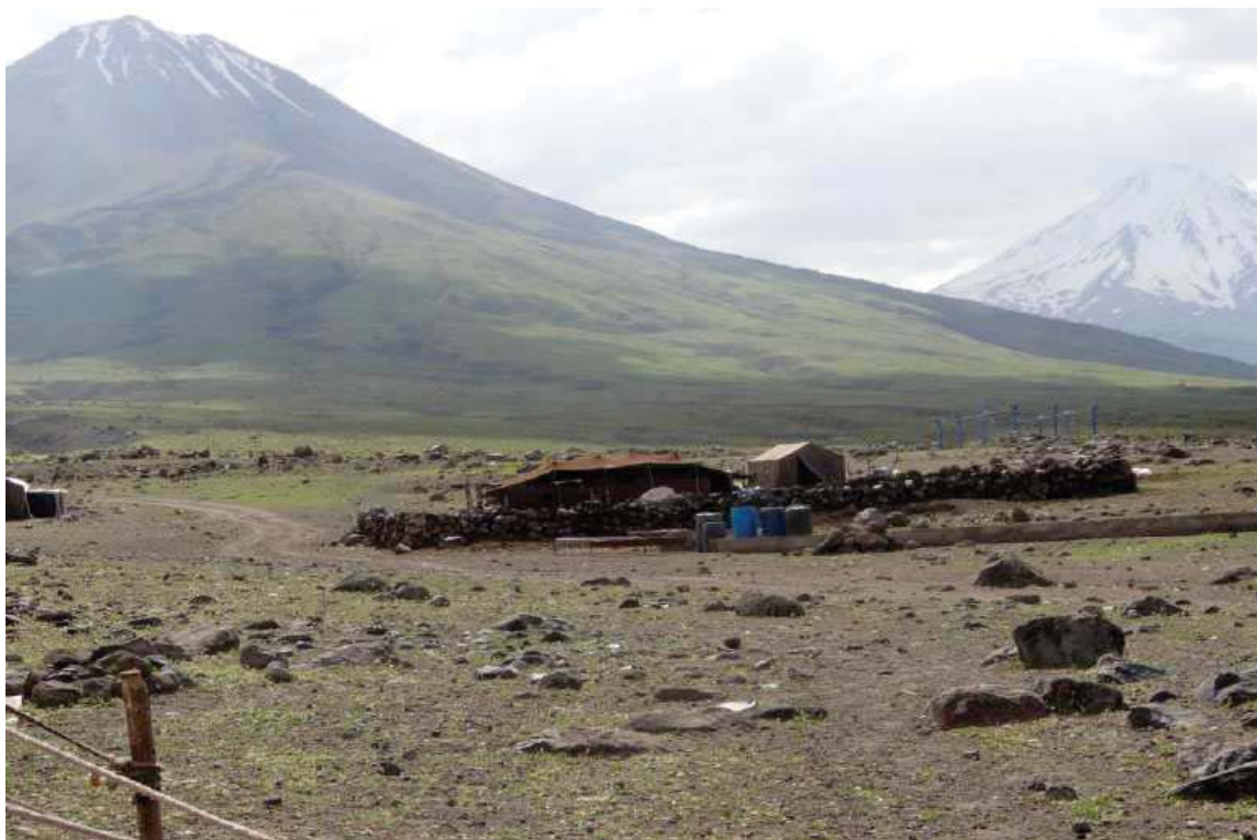
سیگۆشه‌ی سنوری ئیران و تورکیا و ئهرمه‌نستان