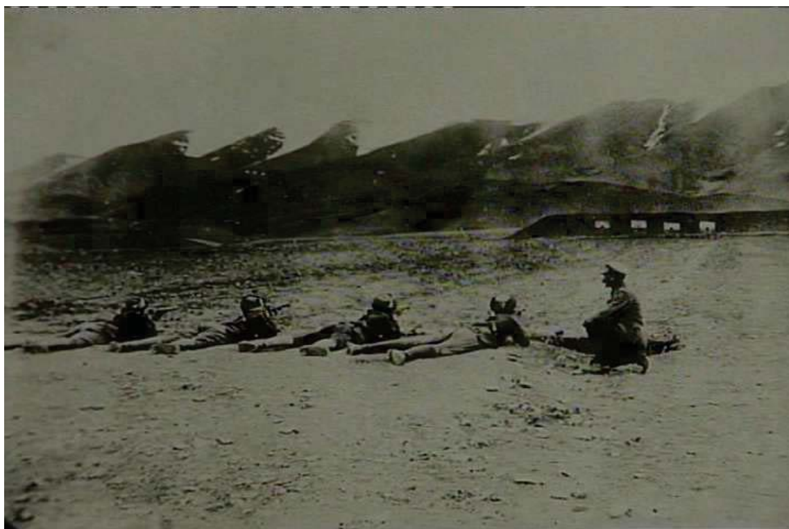
هێرشى سوپای ئینگلیز و سوپای عێراق بۆسه‌ر گوندی بارزان ١٩٣٢