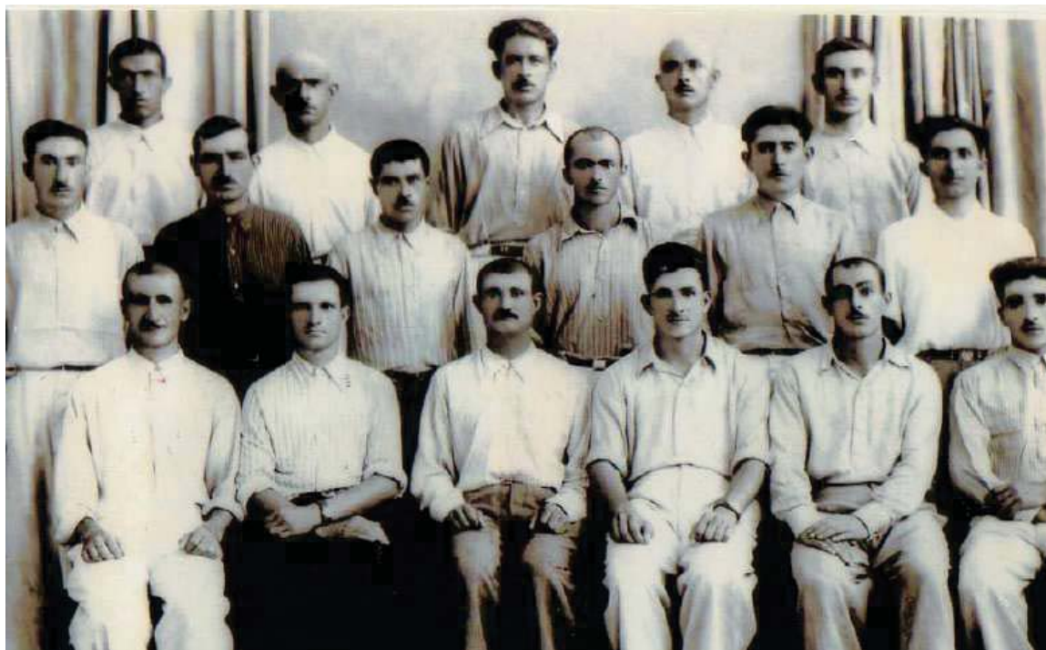
به‌شیک له هه‌فالانی بارزانی نه‌مر له سوڤیه‌تی جارانی له‌کاتی خویندندا