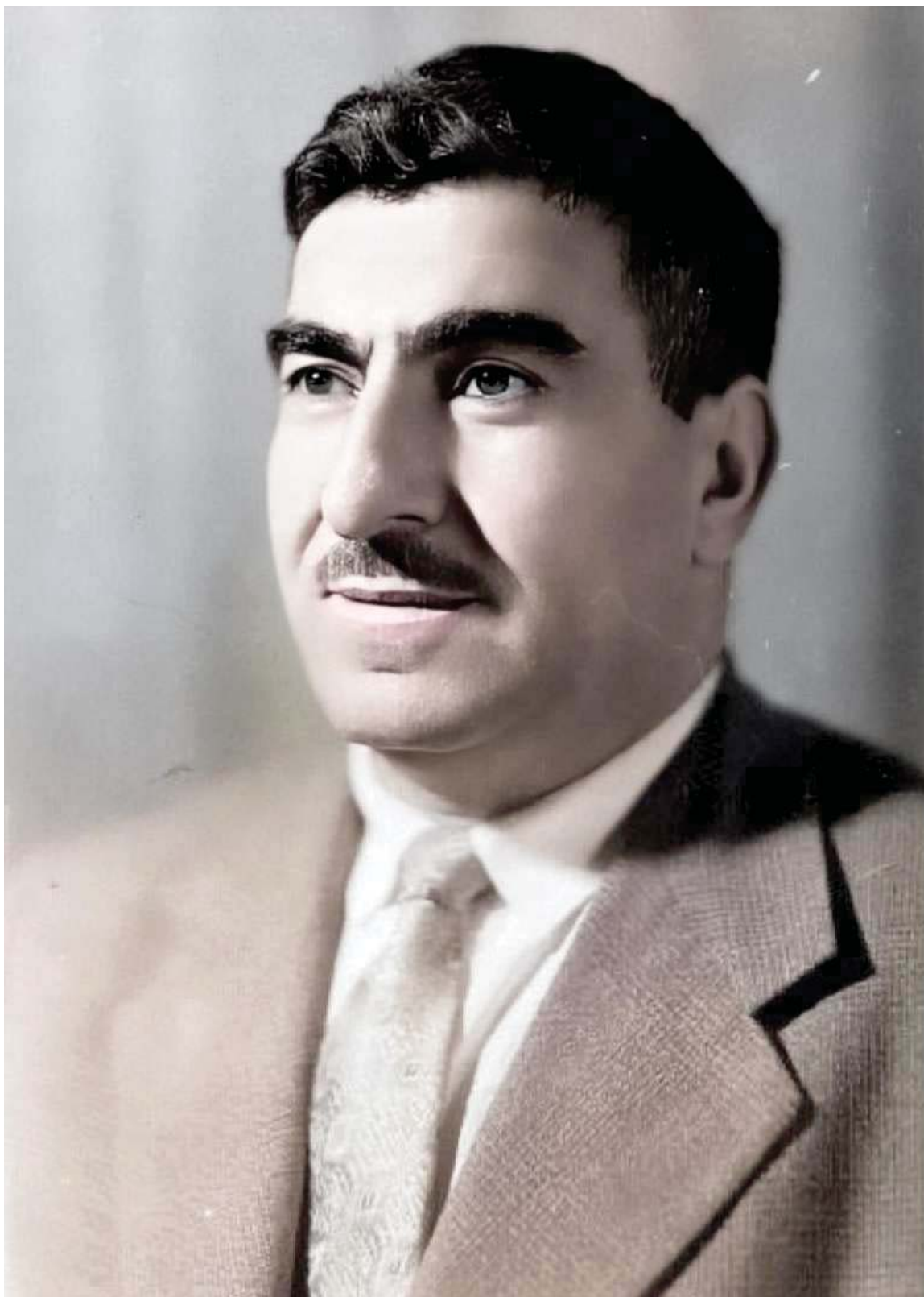
بارزانی نهمر له سوؤقیهت