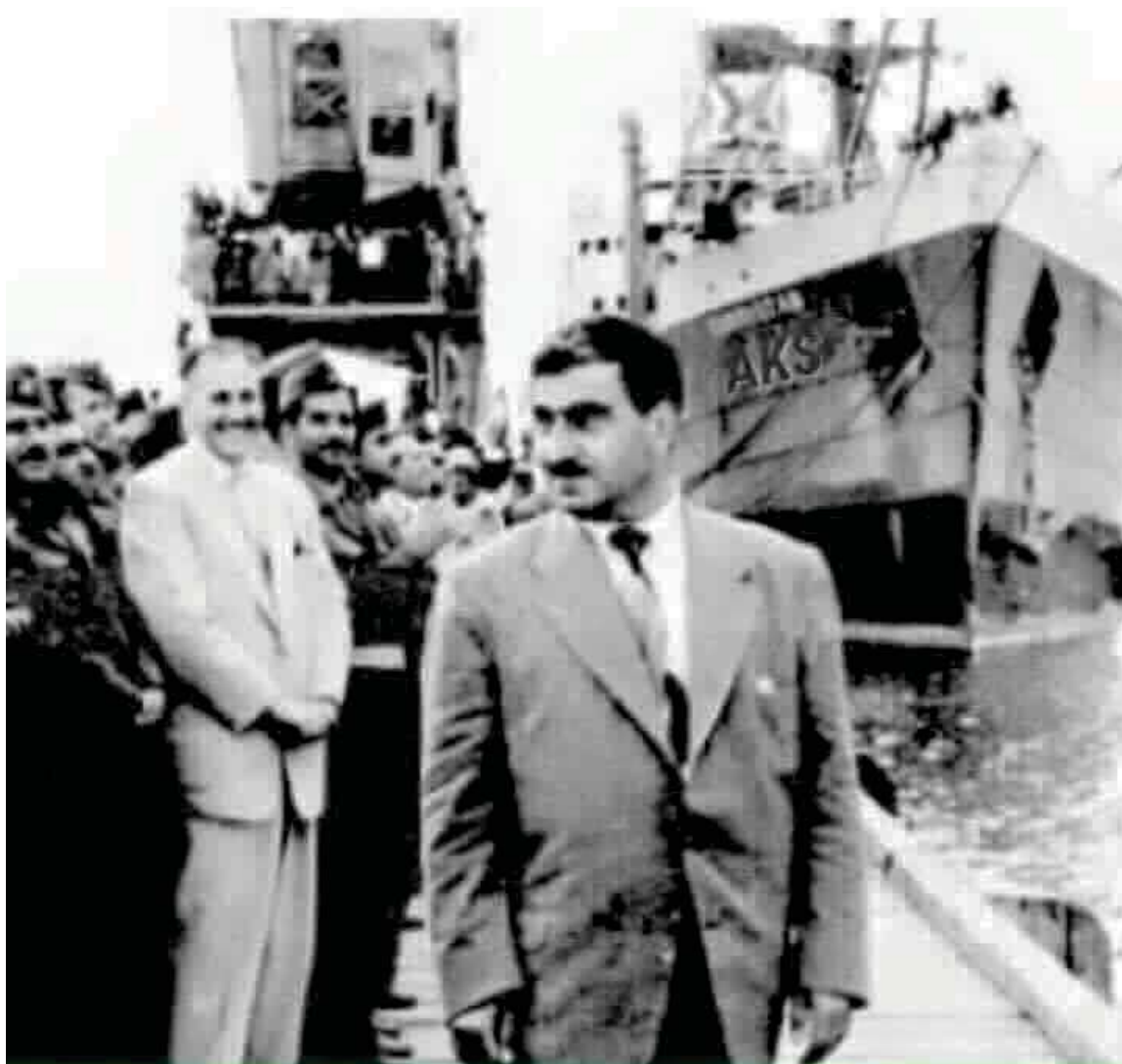
پیشوازی بارزانی نهمر له هه‌فآل و خیزانه‌کانیان له به‌سپرا