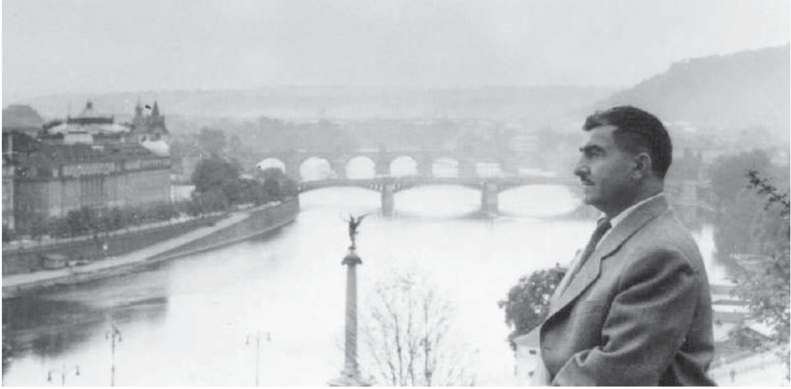
بارزانی نه مر له یه کیتی سوڤیه ت