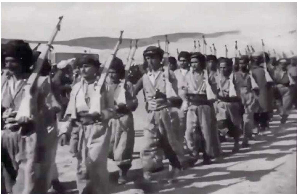
مه‌شقی له شکرپیه‌کانی کوردستان له مه‌باد ۱۹۴۶