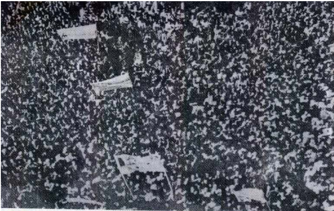
که‌رنه‌فالی پیشوازی پیکهاته‌کانی عیراق له بارزانی نهمر - ۱۹۵۸