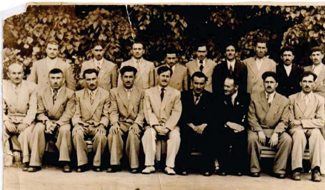
به شیک له هه فالانی بارزانی نهر له سوڤیه تی جارن له کاتی خویندندا