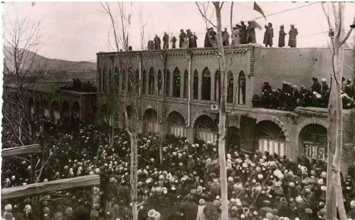
پوژی دامه‌زاندنی کۆماری کوردستان - مه‌باد ۱۹۴۶