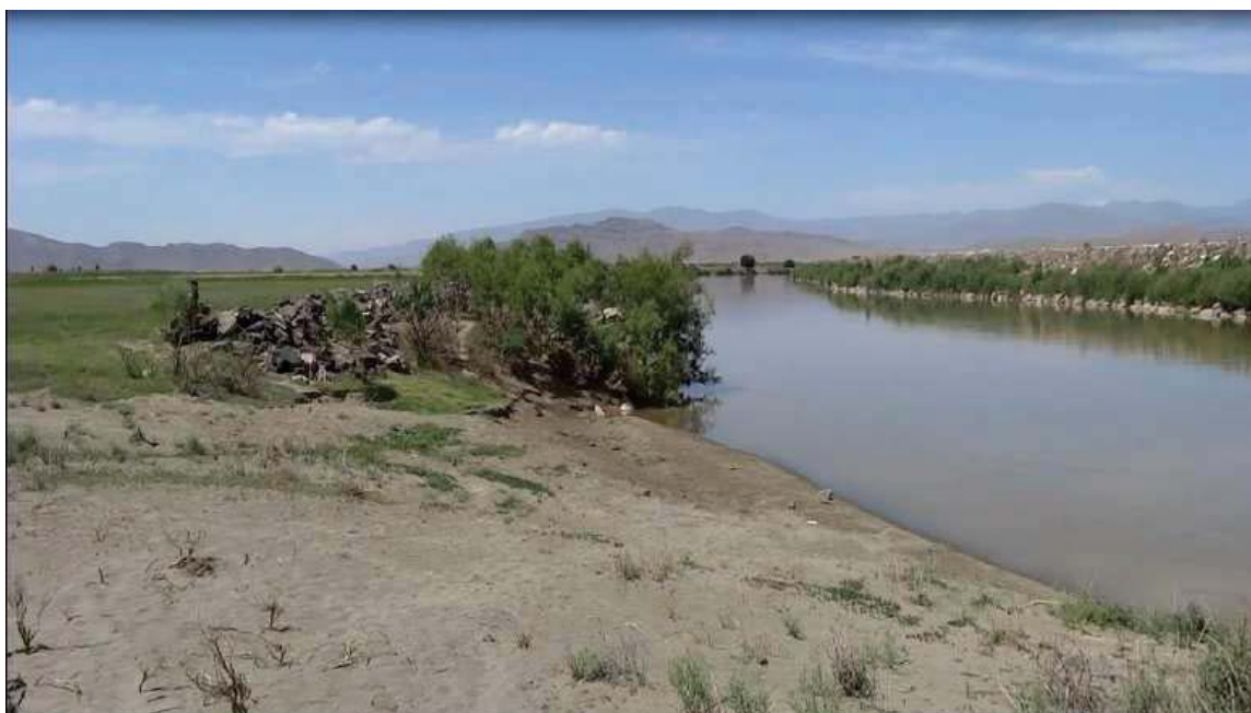
لیواری پرووباری ئاراس - شوینی په‌پینه‌وه‌ی بارزانی نه‌مر و یاوه‌رانی بۆ