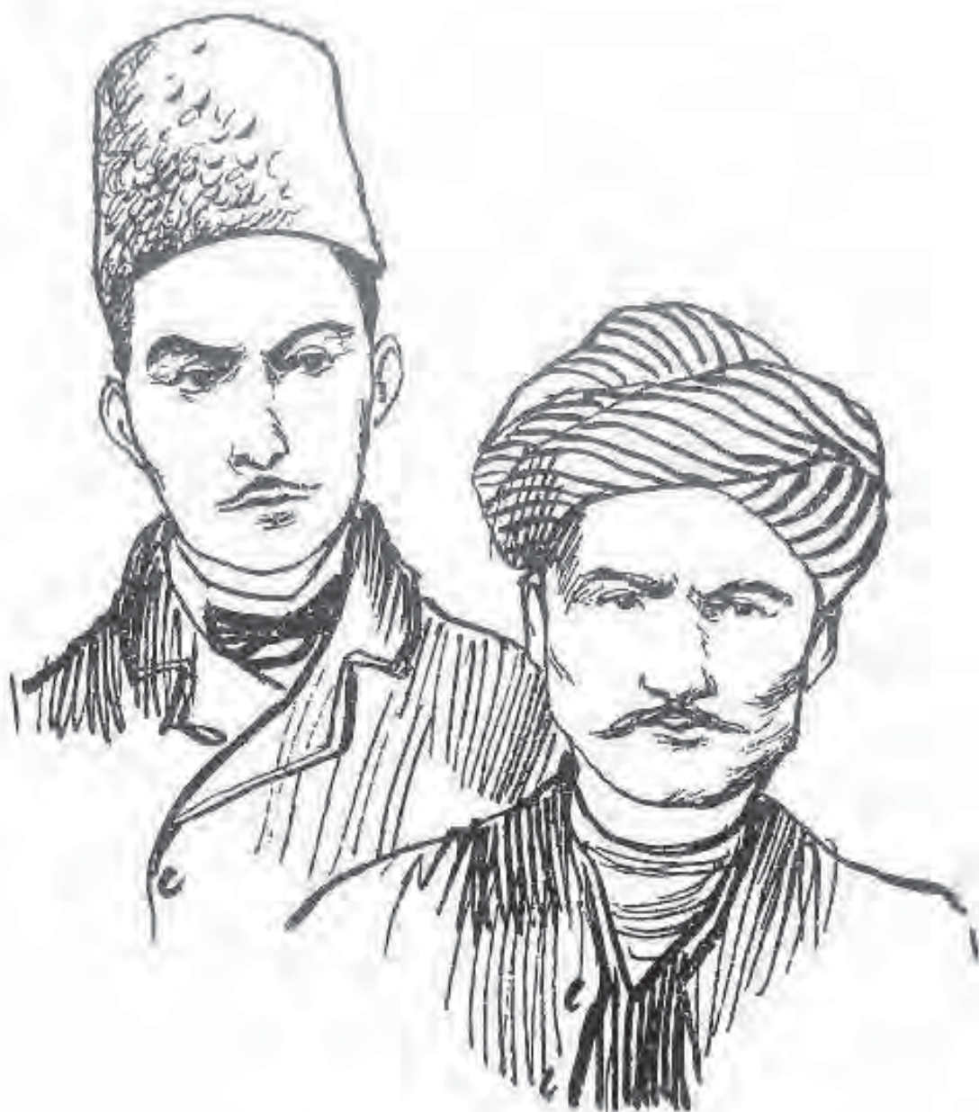
دوکتور سه‌عی و کاکه‌ی برای

هه‌رچه‌نده کاکه زۆر مه‌یلی هه‌بوو به‌لای مه‌سیحی یه‌تا، به‌لام زۆر گران بوو بۆ ئه‌و، باوه‌ر بکات که پیاویتیکی وه‌ک باوکی به‌و هه‌موو ریز و چاکیه‌وه رینگای هه‌له‌ی گرتبیت.