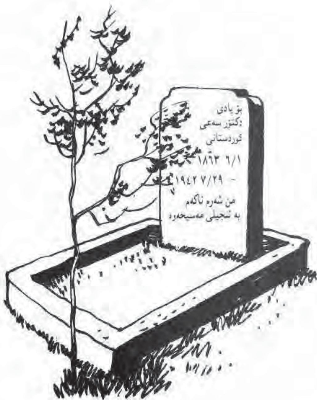
گوری دوکتور سععی له همه‌دان