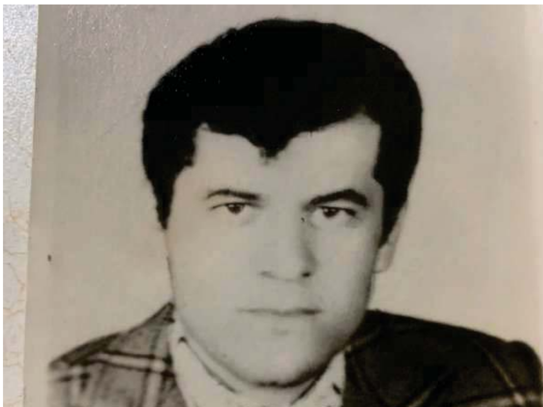
نه حمه د به داغ - خوره م ئاباد لورستان - ئيران - ساللا ۱۹۷۶ ئى