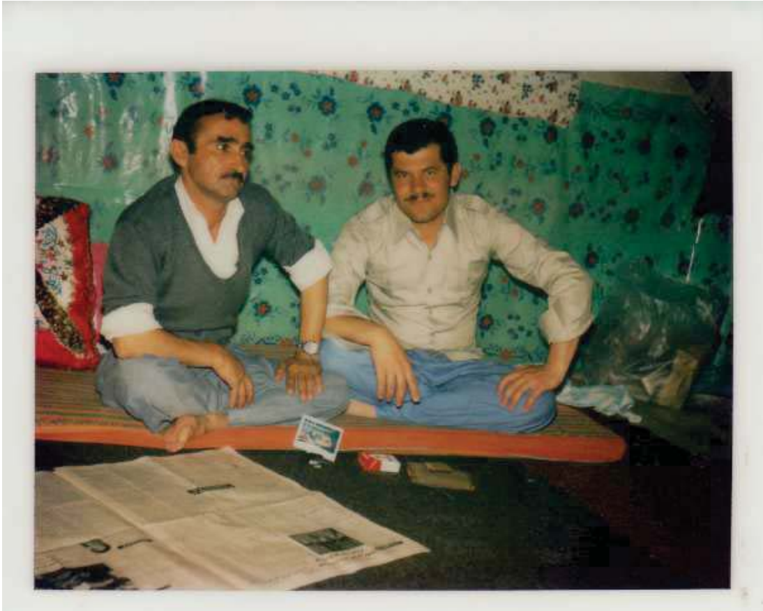
ئەز و ھەقال سلىمان ئەترىشى - خورەم ئاباد لۆرستان - ئىران سالأ ۱۹۷۷ئى