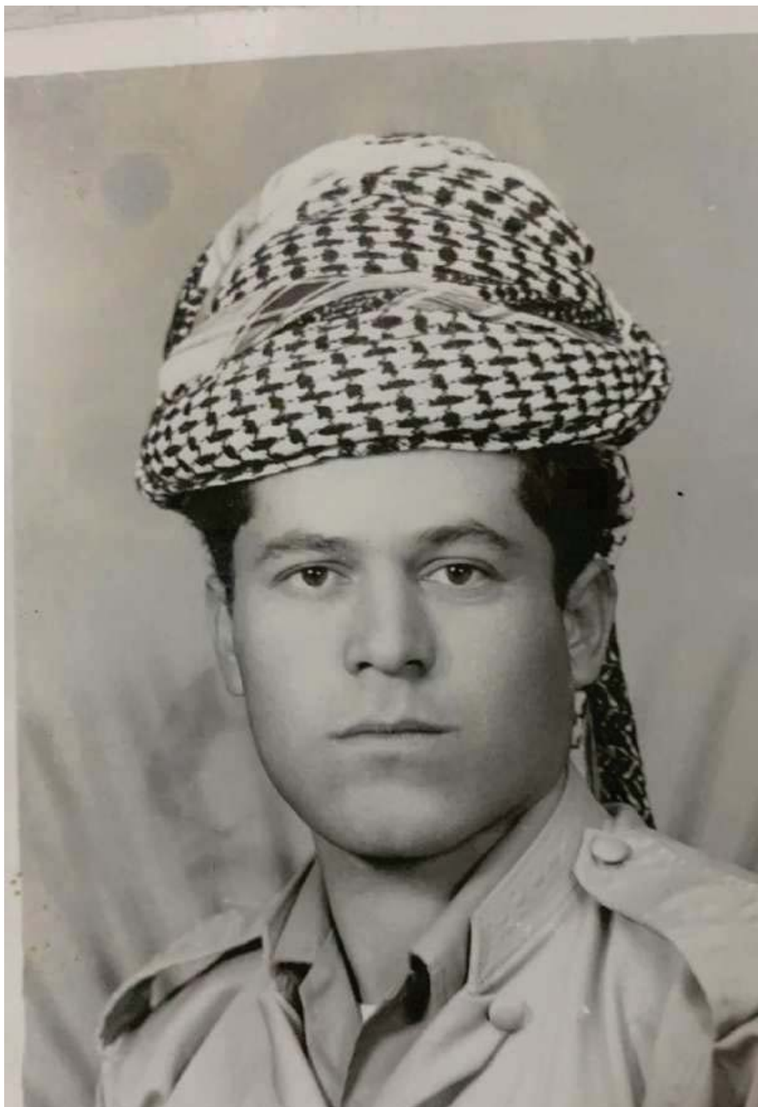
سالآ ۱۹۷۱ - ئه حمههه به داغ