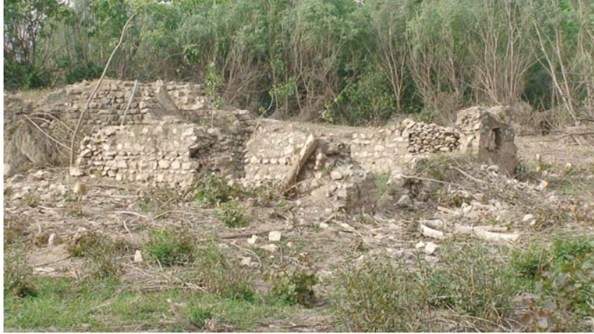
بیمه‌نی ئاشی خەرگه رهش به روخاوی

أ. ئاش و ئاش وهستاو ئاشهوان، دیاره ئاشی ئاو له بهردهم ئاوئیکی زۆردا که ئاوه که له بهرزیدایه خانویهک دروست کراوه ئیتر له ههرجۆره مادهیهکی دروست کردنی بوئی زیاتر له قسل و جارو بووه ههرهکۆنهکان جارو بووه که وهک له سه ره وه له باسی بهربهندی یاسین تهپه و سی ئاشه و بهربهندی سه تره که دا باسمان کردوه، بهلام ئهوانه ی دواتر له قسل دروست کراوه، ئاش ئه گهر ئاوه که ی زۆری دوو بهرداشی بو دادهنری و گهرنا یهک بهرداش، ئاش سی ژوور یان دوو ژووره، تهویله بو بهرزه وولاخ و گوی دریژ و ههرچی باره بهرکهانه، ژووری هارین، له ته نیشتی ژووری هارینه وه له سه سه کویهک جیگایهک جیا کراوه ته وه بو حهوانه وه ی ئاشهوان و باراش هارهکان، لی ره دا نامانه وی باسی ئاش به دریژی بکهین، بهلام شته