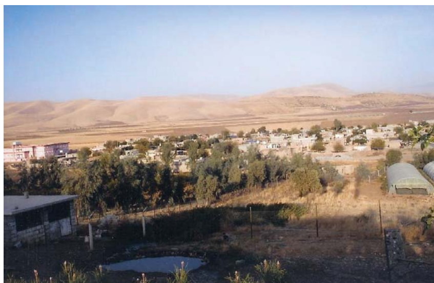
دیمه نیک له گوندی بیستانسور

موفتی و شیخی زاهید و موریدووه گوندی بیستانسور له دیر زهمانهوه خاوهنی ئەو شتانهی سهرهوه بووه و میژوویهکی قول و بهرچاوی له پرووی ئاینی و پۆشنیرییهوه ههبووه بو به لگه ی راستی ئەو مه بهسته ی له ده سنوسی کدا که به چهند دیریکی زانیه ک و چامه یه کی شیعری شاعیریکی دهیان سال له مه و بهر له بنه ماله ی شیخی نیرگزه چار له لای (ماموستا شیخ حسین شیخ عوسمان) نیرگزه چاری دهستمکه وت ئەو راستیانه ده سه لمینن ئەمه ش هونراوه و نوسراوه که یه . له که شکۆله که دا به م شیوه هاتووه :