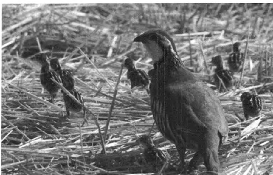
( کهویکی جوان له گهر فخرخه کانی له ناو پهریزئی )