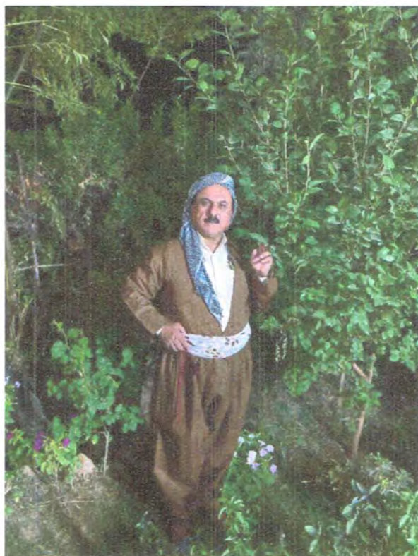
ويته‌ی (نوسهر) :