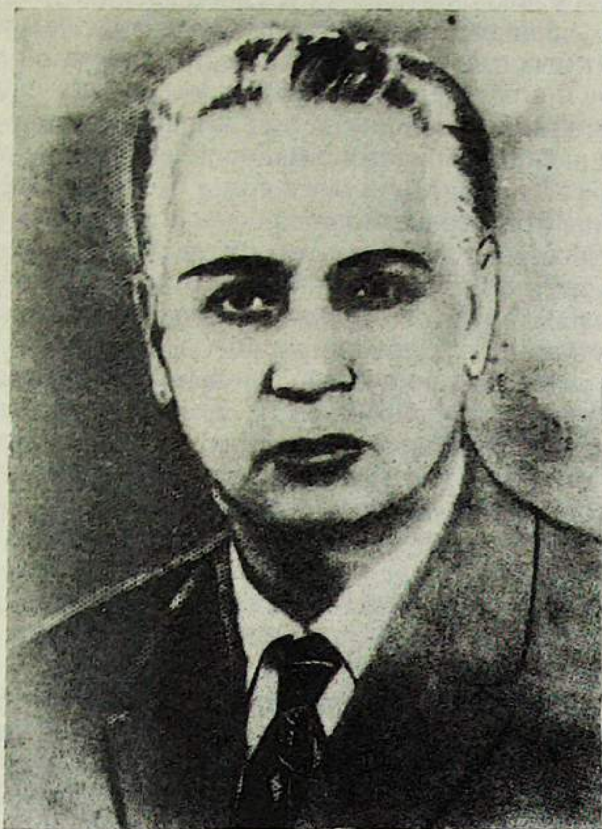
Рис. 2. Гусейн Керимович Алиев

тальной хирургии Азербайджанского государственного медицинского института. В 1939 г. профессор Г. К. Алиев был по конкурсу избран заведующим кафедрой общей хирургии Азербайджанского государственного института