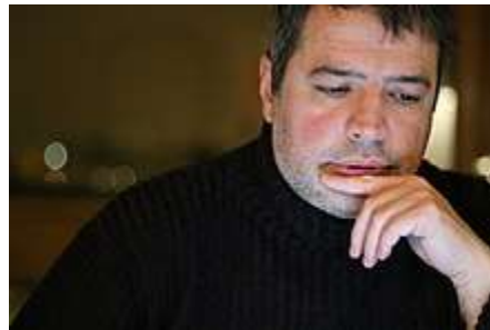
تینوش نەم جو

بەو پێیە پێشەکە ترم رۆژنامەنووسە لە رادیۆی فەرەنسی، بۆ نووسینی شائونامەکانم زیاتر لە شەو و پشووەکانم بەکار دەھێنم. نووسینی شائونامە بۆ من ھەندیک داب و نەریتی ھەیە. کاتیک شائونامە دەنووسم، ھەرگیز لە کوالیتیەکە دنیایا نەم. شائونامە لەگەڵ چەند ھاوڕیہکی نزیک فەرەنسی دەخویننەو، بەشە باشەکانی دەھێننەو، نەووی تر فری دەدەین. ھەندیک جار پێم دەلێن نەو بەشەنە کە سەیرن بێھێلەرەو. نەم ھاوڕی فەرەنسییە نزیکانەم دوا فلتەری نووسینەکانم. ھەرگیز ناتوانم بێنم سەد لە سەد کۆنترۆلی نەو شتەنە ھەیە کە بە فەرەنسی دەنووسم. وە پێم وایە گەرەترین فەزێلەتەکانی شائونامەکانم نەمە یە.