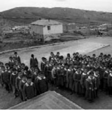
Kars'taki bir Kürt köyünde bayrak töreni için sıraya dizilmiş çocuklar.