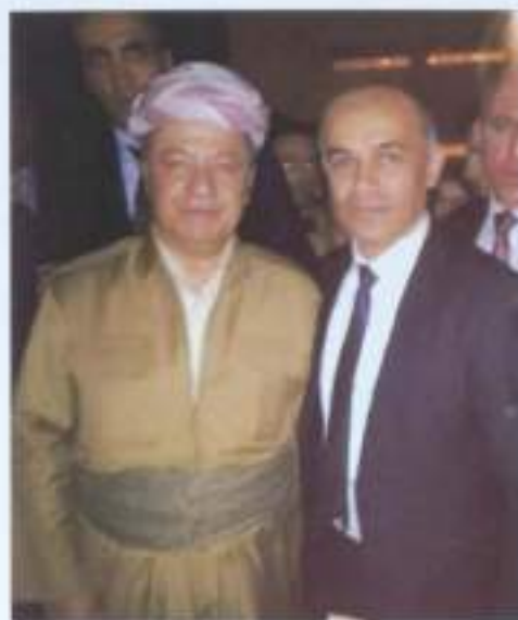
Վահրամ Պետրոսյանը Քուրդիստանի նախագահ Մատուդ Բարզանու հետ (2018)