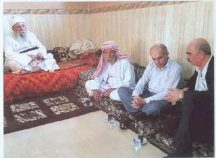
Հանդիպում եզդիների հոգևոր առաջնորդ Բաբաշեխի հետ (2018)