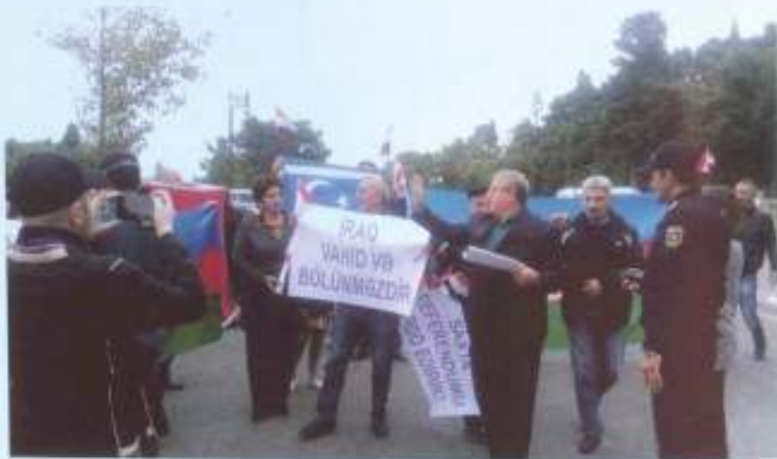
Քուրդիստանի անկախության հանրաքվեի օրը Աղբրեջանում կազմակերպված բողոքի ցույցերն Իրաքի թուրքոմանների մասնակցությամբ (25.09.2017)