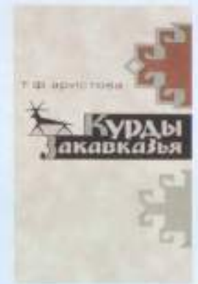
Ադրբեջանի քրդերին նվիրված մի շարք աշխատություններ