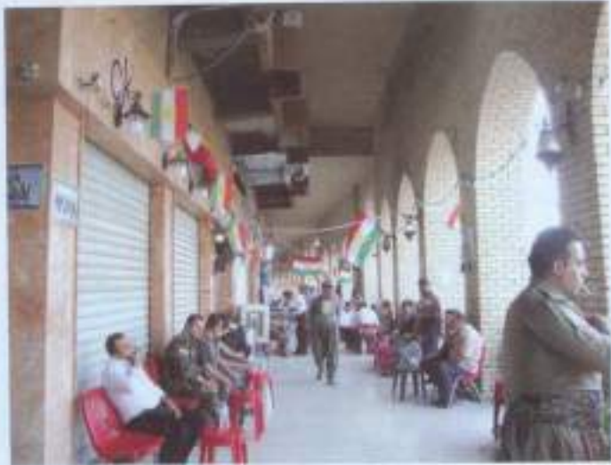
Քուրդիստանի անկախության հանրաքվեի օրը (Էրբիլ, 25.09.2017)