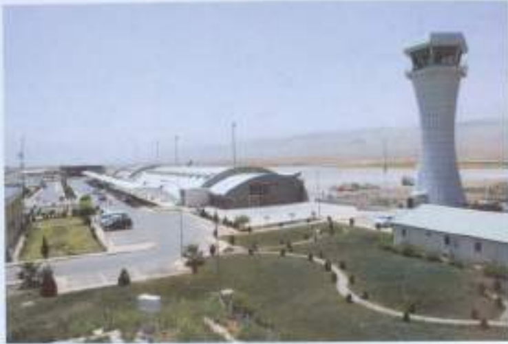
Մուլեյմանիեի միջազգային օդանավակայանը (2015)