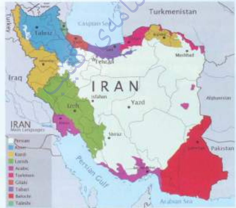
Իրանի Իսլամական Հանրապետության քարտեզը՝ քսո լեզվակիրների տեղաբաշխման