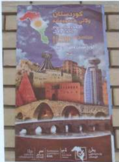
2017 թվականի սեպտեմբերի 25-ի անկախության հանրաքվեի զոլագրային պատատներնից