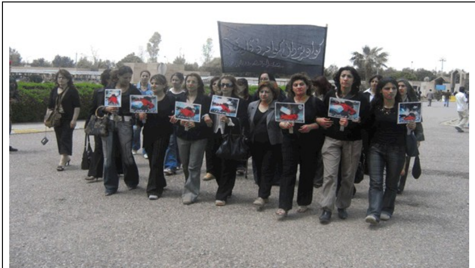
ژنان دژ به کوشتنی نامووسی له به‌رده‌م په‌رله‌مانی کوردستان خۆپه‌شاندان سازده‌که‌ن، ههولێر 2007

ژنانی چالاکی کورد له بواری مافی مرۆڤدا، له چاوپێکه‌وتنی لێبووردنی نیونه‌ته‌وه‌یی به‌ به‌ر ده‌وامی رایانه‌گه‌یاندوه که پێویسته ژینگه‌یه‌کی ژبانی سه‌لامه‌ت و درێژخایهن له‌ناو په‌ناگه‌کان و ده‌روه‌ بو ئه‌و ژنانه بخولقی‌ت که ناتوانن یا نایانه‌ویت به‌گه‌رینه‌وه لای بنه‌ماله‌کانیان. ئه‌وه‌ ده‌بی ته‌گه‌یری باشت‌کردنی سه‌ر به‌خۆیی ئابووری ژنان، له ریکه‌ی ده‌ستره‌گه‌شتن‌یان به‌ په‌روه‌رده‌ی زیاتر، راهه‌ینان بو ئیش و کار و دامه‌زرانه‌ش به‌گه‌رینه‌ به‌ر. ده‌سه‌لات‌داریه‌تی کورد ناگادری لێبووردنی نیونه‌ته‌وه‌یی کردووه‌ته‌وه که خه‌ریکی ئه‌وه‌ن لێهاتوویی و ده‌ره‌تانی ئیش و کار بو ژنانی ناو په‌ناگه‌کان بخولقی‌ن. 41