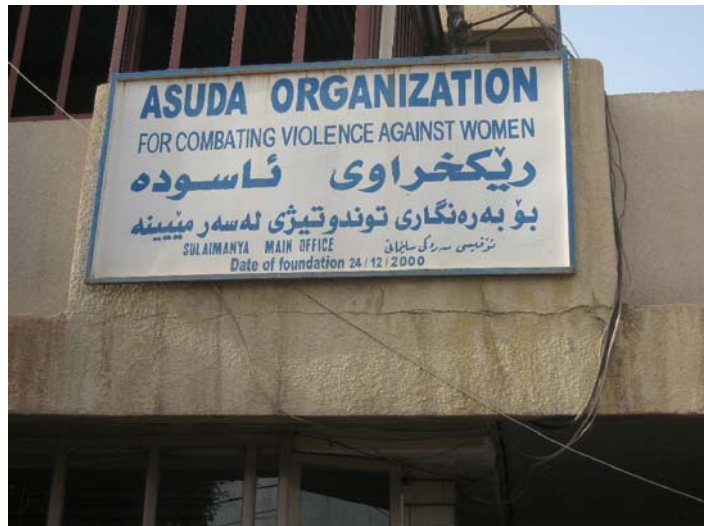
ريكخراوهي ناحكومي "ناسوده" پهنالگهيكي له سلئيماني بهريوه دهبات.

ژنيكي فهرمانبهرا له پهنالگهيكي هيريمي كوردستان به لئيبوردني نئونهتهوهيي گوت: "چهند ساليك پيش ئيستا كه ليره دهستم به كار كرد، ههر له يهكهم رۆژوه ههر شههم لئيكراوه." ناوبراو له سالي 2008 دا ههوالي رووداويكي داوو. خزمي ژنيك وا له پهنالگهدا دهژيا به تهلهفون ههر شههي لئى كردبوو و گوتبووي: "دهموييت پينت بلنم ناوي خۆت و بنهالهكمت دهزانم. دهزانم تۆ ناوي نهو پياوانهه و گوماني هيرشكار بييان لئى دهكرت داوهته پۆليس و ههروهها نامهت بۆ دادگا نووسيوه. تۆ داكوكي لهو بكه، بهلام نهوه كاريكي ههلهيه. من چاو تر سينت دهكهم." دواي تهلهفونهكه، فهرمانبهراي ناوبراو ناگداري پۆليسي كردهوه و وهك تهگبيريكي سهلامهتي خوي، ئيش و كارهكهي خوي به جي هيشت و مندالهكشي ههمان رۆژ له باخچهي مندانان هينايه دهرهوه. كابراي تهلهفونكه ههرگيز نهاسرا.