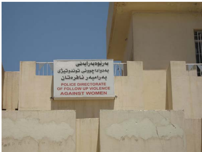
بهريوه بهرايه تي به داوا چووني توندوتيزي بهرام بهر نافرمان، هوليئر

له كاتيكا رهنجي زوريك له ژناني قورباني توندوتيزي ناكهويته بهر سمرنجي دهسه لاتدار بيه تي، ژماره ي گازنده ي تومار كراوي تاواني توندوتيزي دژي ژنان له زيادي داوه. له هه نديك كه پيدا، ژنان نه يانتوانيوه گازنده ي خويان راستهوخ له لاي دهسه لاتدار بيه تي تومار بكن، هه نديكي تر، نه م كارميان به يار مه تي ري كخر او مكاني مافي ژنان نه انجام داوه. هيلي تهله فوني ياري گهيان دن بو ژناني ژير مه ترسي له لايهن حكومته تيش و ري كخر اوه ناحكومييه كانيشه وه دامه زراون.