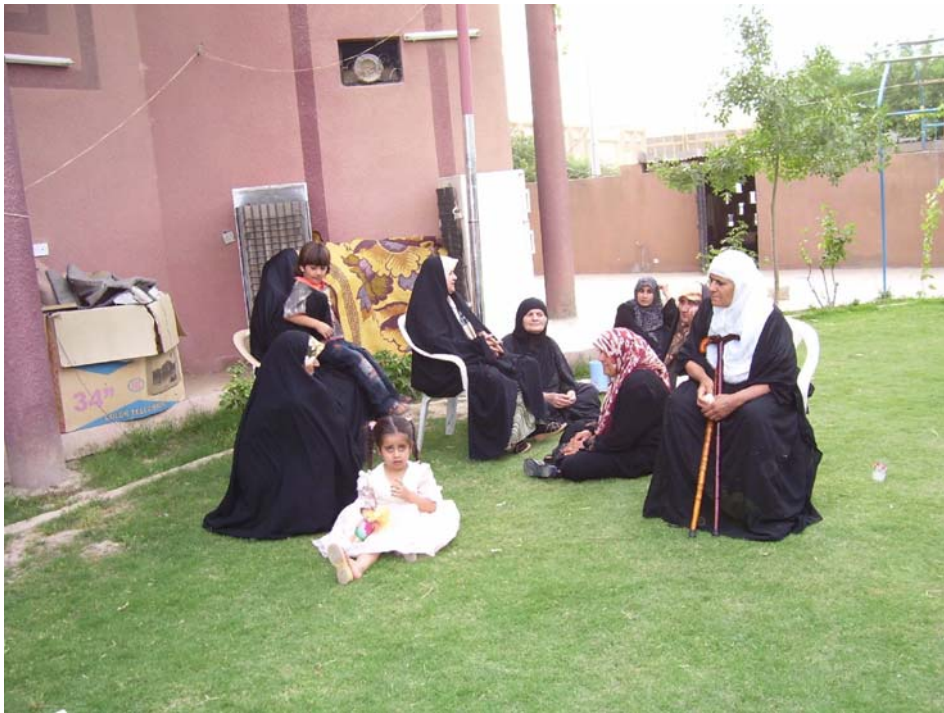
داپكان و خزماني گيراوهكان چاوهرواني چاوپنكهوتن لهگهل لئيووردي نيونهتهومي، مانگي پينج/ شهشي 2008

ياساي رهوتي تاوان، كه به هوي بهشي 30(13)ي يادداشتي ژماره 2ي دهسه لاتداربيعتي كاتي هاوپهيمانانوه گورانكاري تيدا كراوه، دهلئيت ئهو زينداننيانهي وا دادگايي نهكراون دهبي مؤلعتي ئهوهيان بي بدرت كه دهستبهجي دواي گيران ناگاداري كهسوكاريان بكهنوه. بهشي 14(1) له يادداشتي ژماره 2ي دهسه لاتداربيعتي كاتي هاوپهيمانان ههروها دهلئيت گيراوهكان مافي ئهوهيان ههيه به هوي نامه نووسين و سهرداني بهردهوامهوه پهيوندي لهگهل كهسوكارو دوست و برادري خويان بگرن.