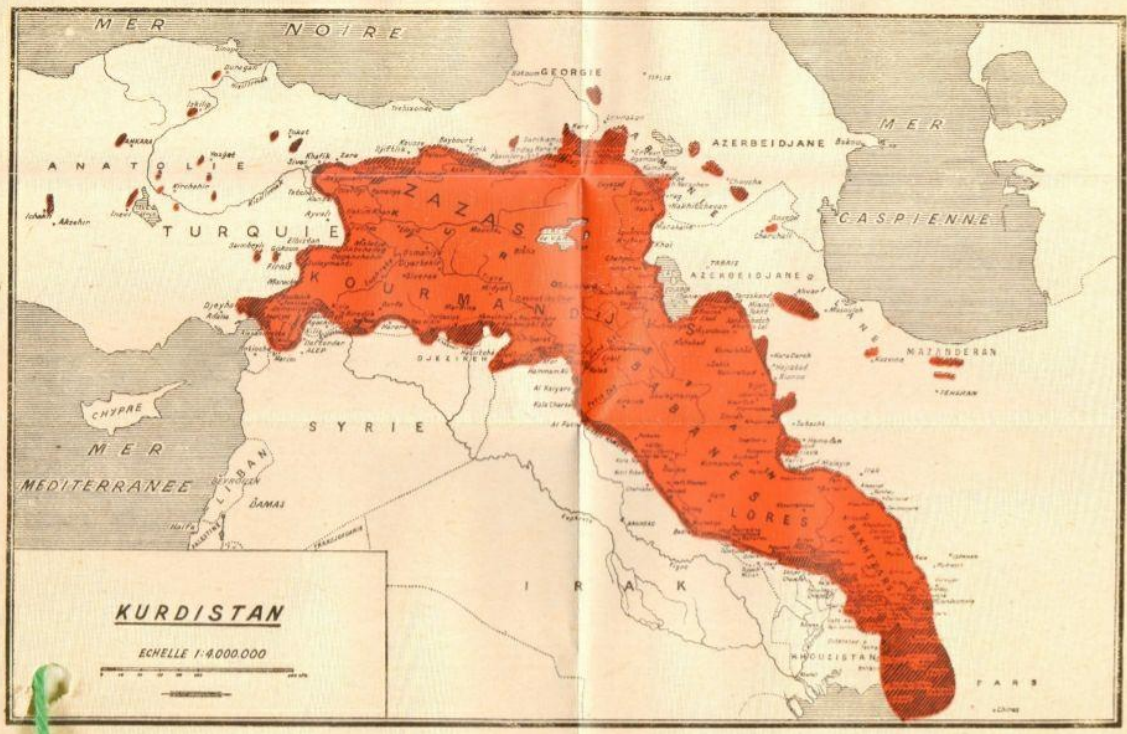
M.325.23, "Kurdistan." French map. Appears with Bulletin Mensuel de Centre d'Etudes Kurdes , issue No. 8, August 1949. [FO 371/75123] Crown Copyright material is published under Licence from the National Archives, London. Original map 305 x 197 mm, reproduced here at 1/175 of the original size.