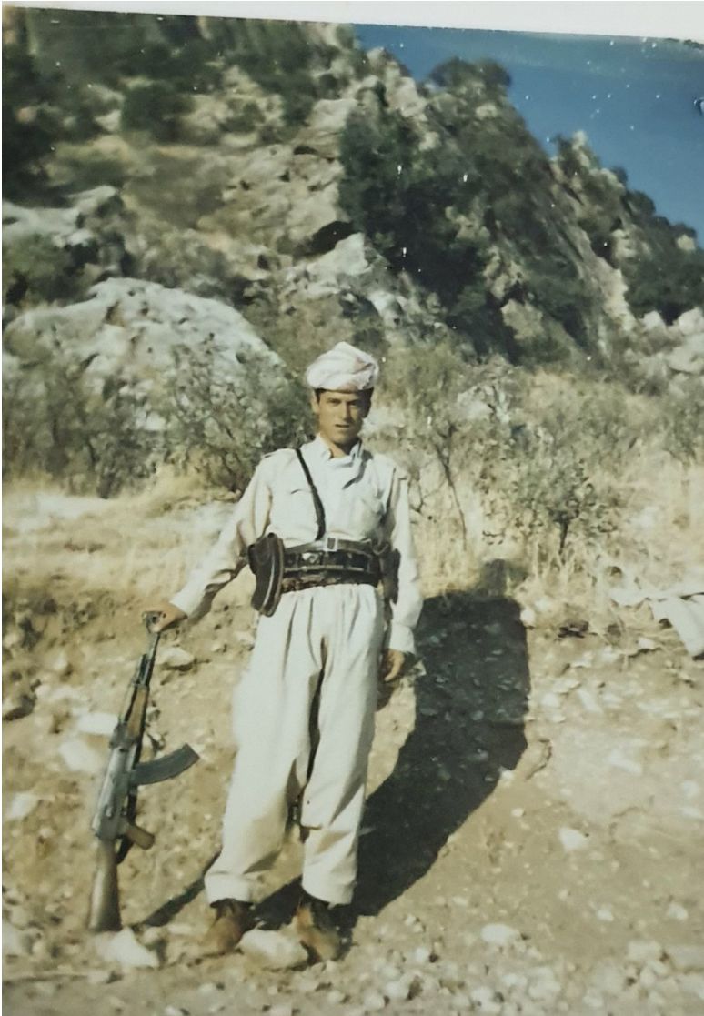
ساللا ۱۹۷۱ - نه حمهه د به داغ