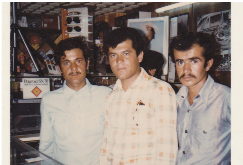
جوزهل وهرمىلى - نه حمده به داغ - اكرم يوسف غلبيش - بندرعباس - ۱۹۷۵ ئى