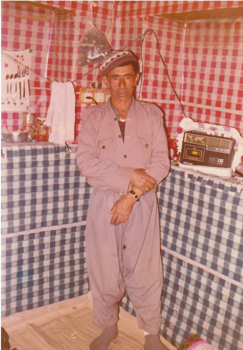
شەھىد حىجى كارەى - خورەم ئاباد لۆرستان - ئىيران - ساللا ۱۹۷۷تى