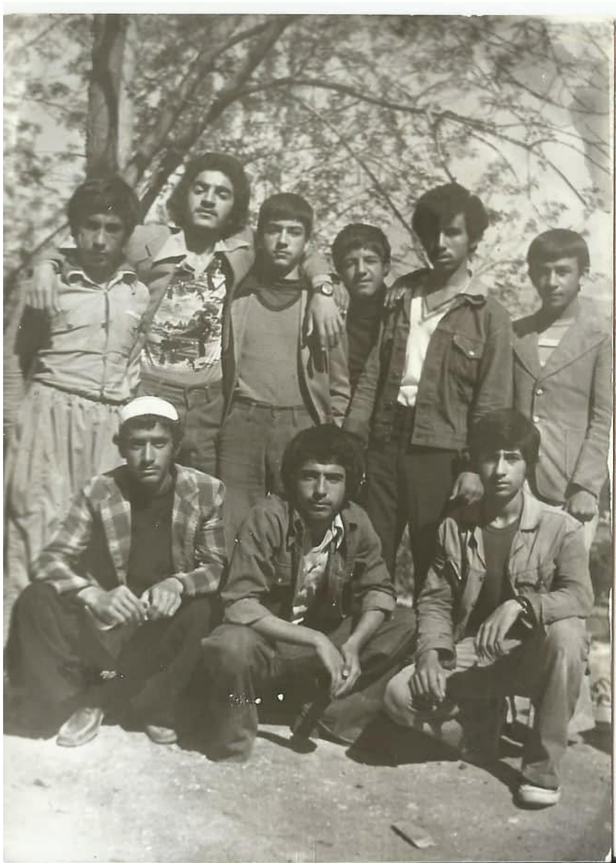
دانشتو و نه فہری یہ کہم لہ چہ پہوہ: مستہ فای شارو تیرانی