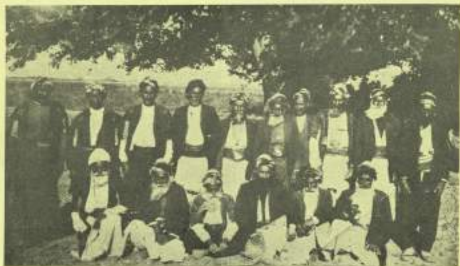
بعض شيوخ ورؤساء الأيضية في منطقة حلب