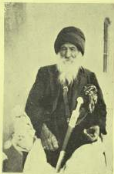
حمو شرو كبير الأيضية في بلاد سنجار