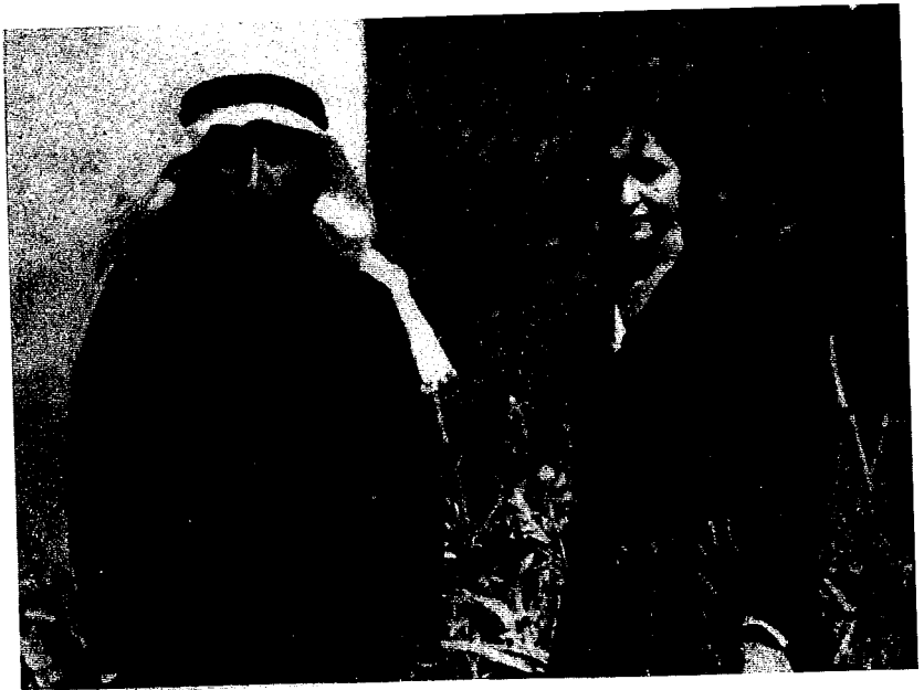
سعید بك أمير اليزيدية وزوجته