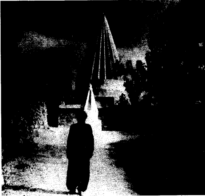
مرقد الشيخ عدي بن مسافر في لالش