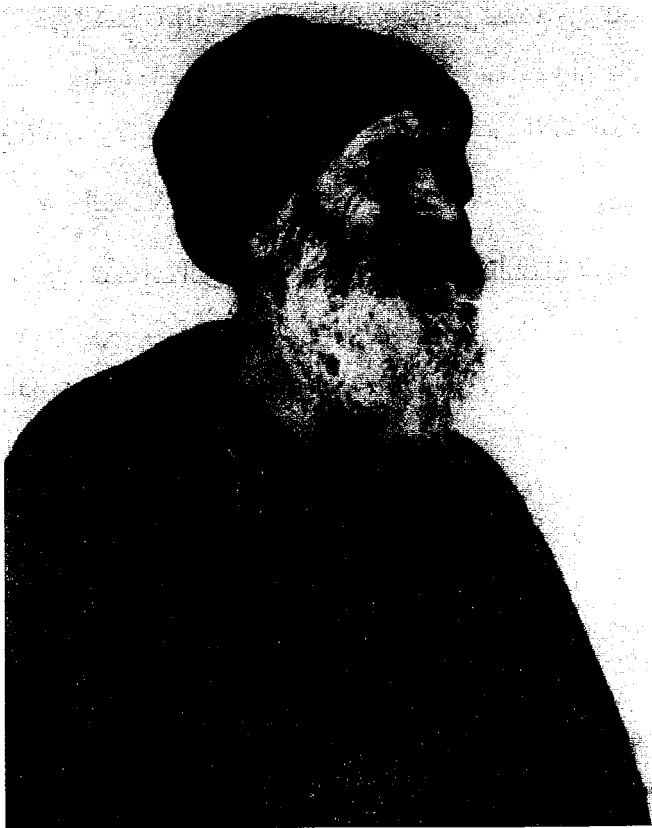
أحد فقراء اليزيدية