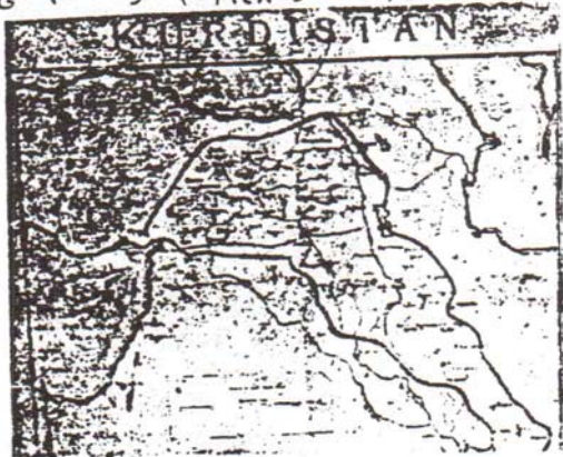
این نقشہ کردستان تورم است کہ قاضی محمد خیال ایجادش را داشت و در دفتر کارش بالای سرش گذاشته بود .