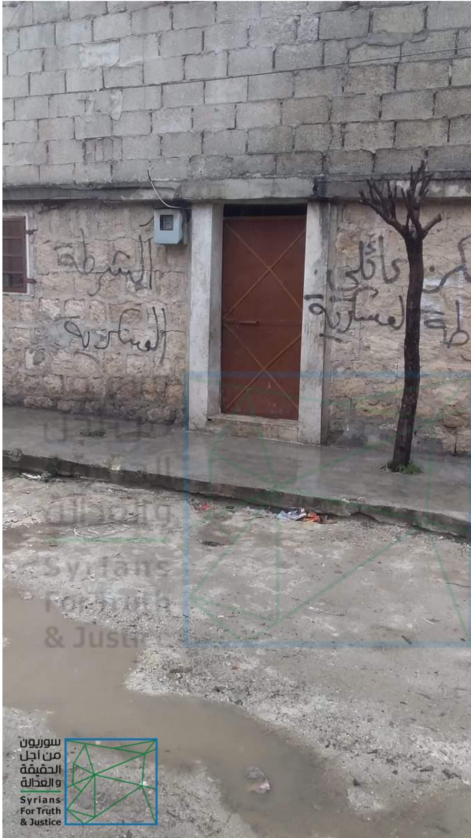
صورة لمنزل ولات بعد الاستيلاء عليه.