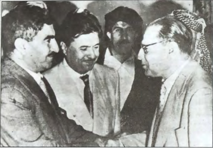
كامل الجادرجي مصافحاً مصطفى البارزاني وبينهما حمزة عبدالله في بغداد أواخر عام ١٩٥٨م