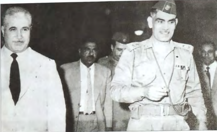
الزعيم عبد الكريم قاسم ورئيس مجلس السيادة نجيب الربيعي خلال إحدى المناسبات عام ١٩٦١م