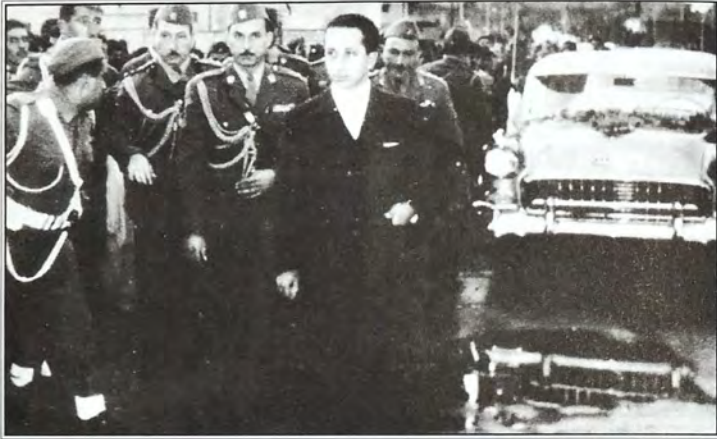
الملك فيصل الثاني خلال زيارته لمدينة أربيل في نيسان عام ١٩٥٨