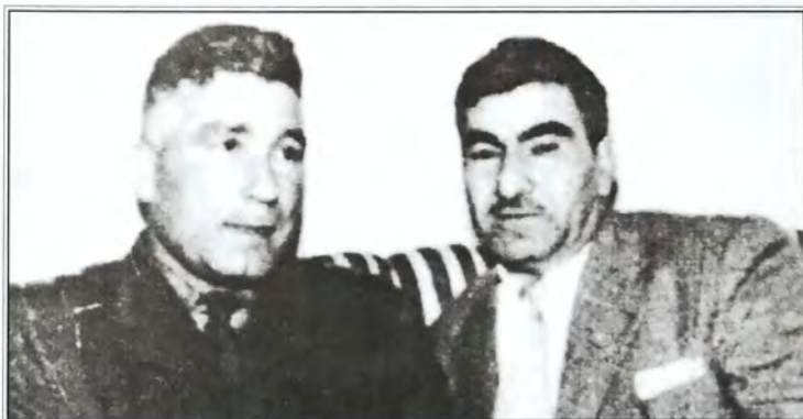
مصطفى البارزاني مع فاضل عباس المهداوي رئيس محكمة الشعب في بغداد أواخر عام ١٩٥٨م