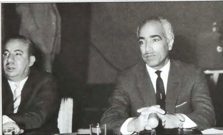
أحمد محمد يحيى وزير الداخلية وبنجانبه هادي الجاوشلي وكيل وزارة الداخلية في بغداد عام ١٩٥٩م