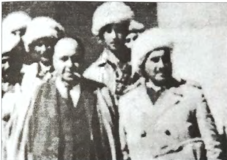
مصطفى البارزاني وإلى جانبه فائق السامرائي نقيب المحامين العراقيين خلال زيارته إلى كردستان عام ١٩٦٤م.