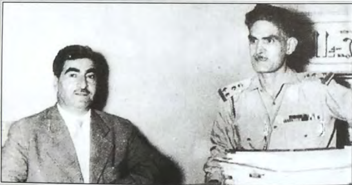
الزعيم عبد الكريم قاسم أثناء استقباله مصطفى البارزاني بعد عودته من الاتحاد السوفييتي في بغداد يوم ٧/١٠/١٩٥٨م