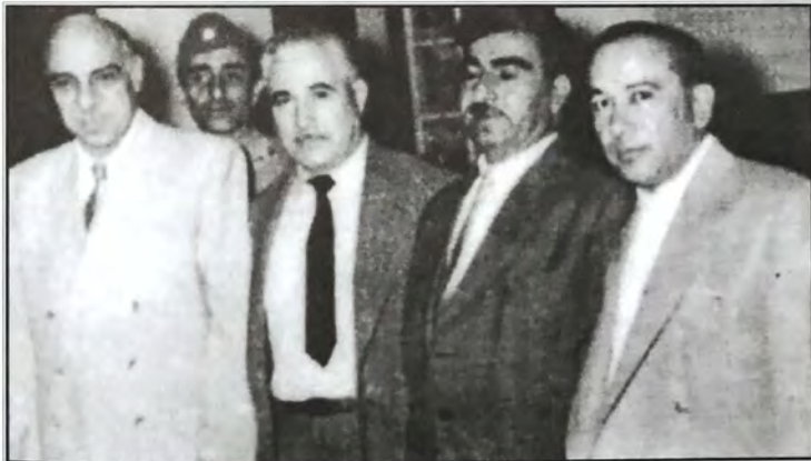
خالد النقشبندى ومصطفى البارزاني ونجيب الربيعي ومحمد مهدي كبة في بغداد أواخر عام ١٩٥٨م