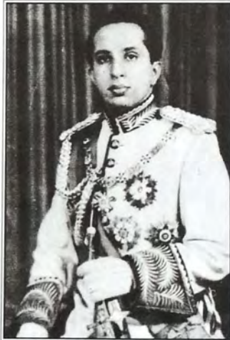
الملك فيصل الثاني آخر ملوك العراق